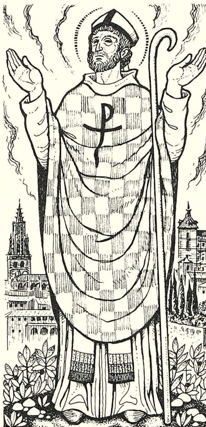
Lletra: Enric Balaguer i Mestres Dibuix: Oriol M. Diví, monjo de Montserrat Música: Joan M. Aragonès i Rebollar

Has omplert sense esvalot, sant Eugeni, la senalla. Sembra joia al nostre ermot, dóna'ns força en la batalla.