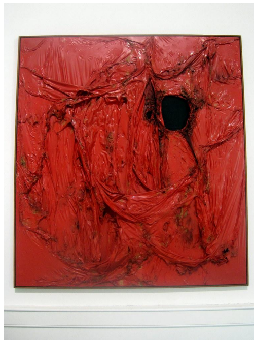
Figura 1: Alberto Burri - Grande rosso 1

Si nos centramos en algunos de los referentes más destacados del arte povera, encontramos a artistas como Alberto Burri, cuyas obras destacan por la incorporación de elementos de vida, ensanchando el lienzo para invadir el espacio del espectador (véase Figura 1). De esta forma, aunque la integridad del lienzo esté a punto de desmoronarse, la materia que lo compone soporta dicha destrucción puesto que los pedazos que lo forman se ayudan entre sí, siendo estos materia pobre (Fernández, 1999).