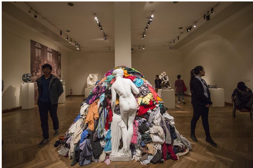
Figura 4: Pistoletto - La venus de los trapos . 5

Como he mencionado anteriormente, la primera escultura elegida es la del artista Michelangelo Pistoletto, cuya obra se titula “La venus de los trapos”. Esta obra está compuesta por dos elementos diferenciados: una estatua fija, colocada de espaldas, y un montón formado por una amplia variedad de trapos (véase Figura 4). A través de esta obra Pistoletto representa la eternidad con la representación de la estatua de Venus, y a su vez se realiza un contraste con el montón de trapos que simboliza el paso del tiempo. Por lo tanto, se hace una crítica a la sociedad de consumo gracias al contrapunto de lo efímero y lo duradero.