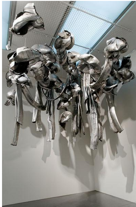
Figura 3: Marisa Merz - Untitled (Living Sculpture) 4