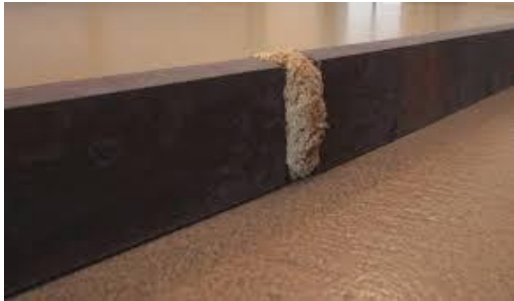
Figura 6: Giovanni Anselmo - Respiro 7 .

energía mostrando la reacción de la vida a las presiones del aumento y el crecimiento (Krauss, 2008).