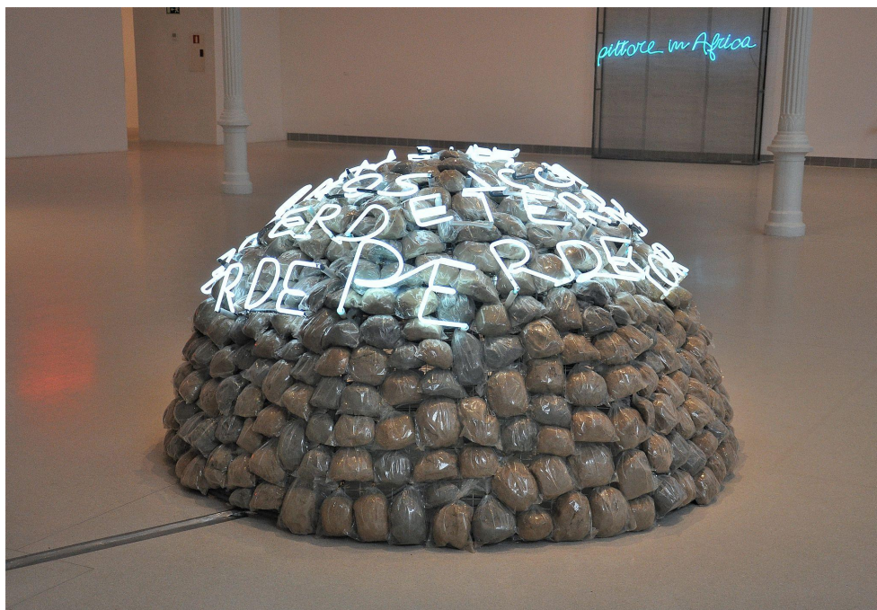
Figura 2: Mario Merz - Iglú de Giap 3 .

Para el artista el iglú representa -encarna- la forma orgánica fundamental. Por su forma corresponde a un sistema geométrico racional, media esfera, pero también es el hábitat nómada por excelencia. [...] Ello anticipa su modo de hacer futuro: la negativa a eliminar, el amor por el principio de integración: la obra abierta. La espiral, como el iglú, es ante todo una forma orgánica que según Mario Merz debe “seguir el ritmo orgánico mismo de la mano que la hace”. Con la introducción de la progresión de Fibonacci, se aleja de una visión renacentista monocular y apuesta por una obra abierta, dinámica, barroca. Amor de lo informe, huida de la geometría; por ello el esqueleto del iglú es recubierto por todo tipo de retazos de recortes, de piezas informes, también por ramas. (Fernández, 1999, p. 81)