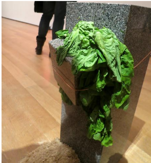
Figura 5: Giovanni Anselmo - Estructura que come 6 .

En segundo lugar, encontramos “Senza titolo” (Estructura que come), una de las obras del destacado escultor Giovanni Anselmo. Esta obra está formada por un bloque de granito colocado en posición vertical y por otro pequeño bloque sujeto a este mediante un trozo de alambre. Entre estos dos bloques se encuentran unas hojas de lechuga que hacen de unión entre ellos. Asimismo, debajo de la escultura se encuentra un montón de serrín (véase Figura 5). Analizando la composición de esta escultura, cabe destacar que lo que la hace especial y única es el hecho de que los dos bloques de granito están sujetos por vegetales, que con el paso del tiempo se deshidratarán y provocarán que el bloque pequeño caiga al suelo: “Según el artista, para que todo se sostenga, los vegetales deben ser sustituidos frecuentemente con nuevos vegetales frescos. En otras ocasiones el vegetal es sustituido por un trozo de carne” (Fernández, 1999, p. 59). En consecuencia, el autor plasma la idea de cómo lo natural rompe con lo férreo y lo sostiene, actuando como soporte teniendo en cuenta el paso del tiempo y su aspecto perecedero.