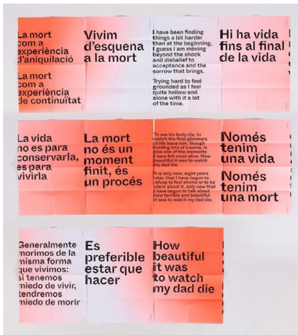
Figura 2. POTRONY, A. (2021) La Bona Mort , Ed. Centre d'art la Panera, Lleida. Edició 11 pòsters.