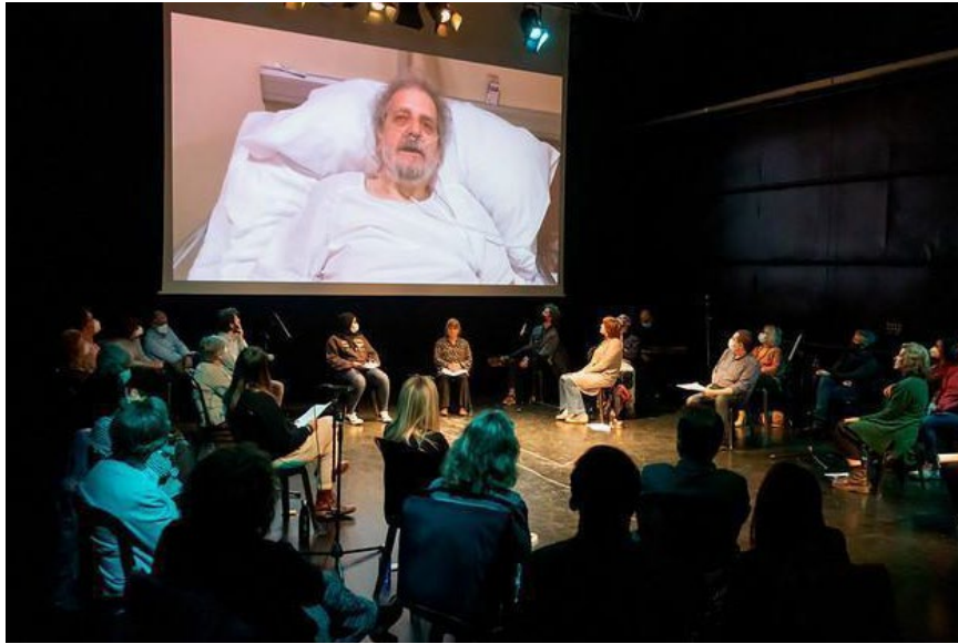
Figura 4. Lectura dramatitzada “Només morim una vegada, reflexions (en companyia) sobre la mort i la vida”.