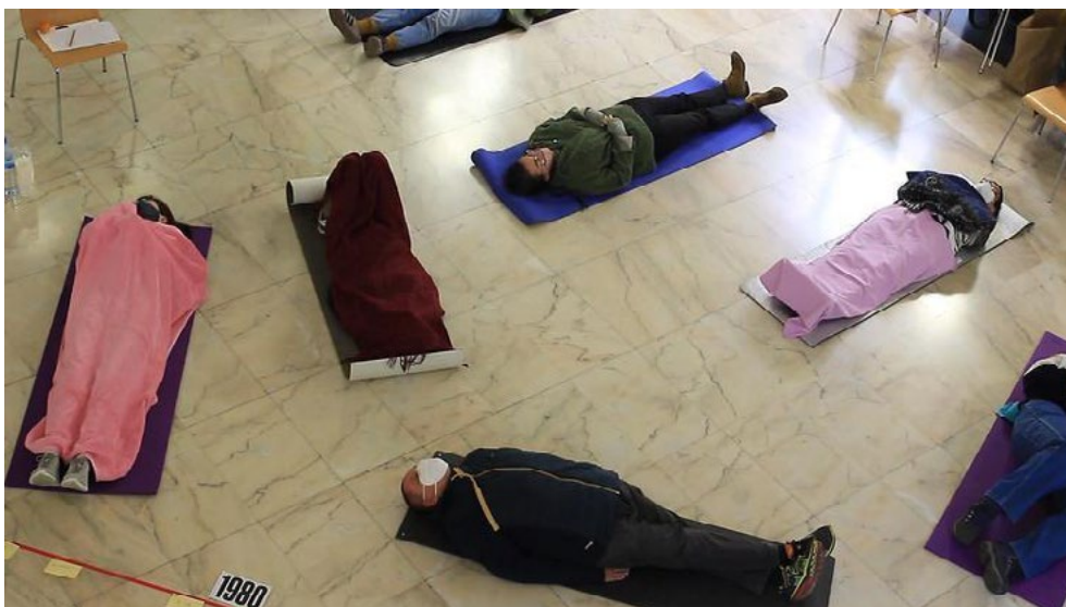
Figura 8. Curs La Bona Mort, vida al final de la vida. Octubre 2020.

Com a element clau de difusió dels continguts generats per al grup de treball es produeix un llibre d'artista, La Bona Mort , inspirat pels Ars Moriendi , que ja hem comentat anteriorment. La Bona Mort és un recull mestís i polifònic on els diversos registres d'investigació (acadèmic, professional i d'experiència de vida) dialoguen en un mateix espai d'una forma horitzontal (figura 9).