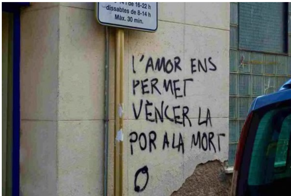
Figura 7. POTRONY, A. (2021): La Bona Mort , Ed. Centre d'art la Panera, Lleida. Pàg. 21.