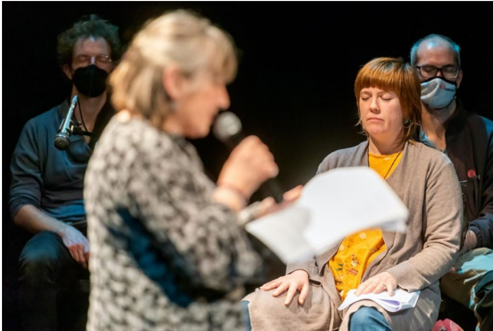
Figura 5. Lectura dramatitzada: Només morim una vegada, reflexions (en companyia) sobre la mort i la vida.