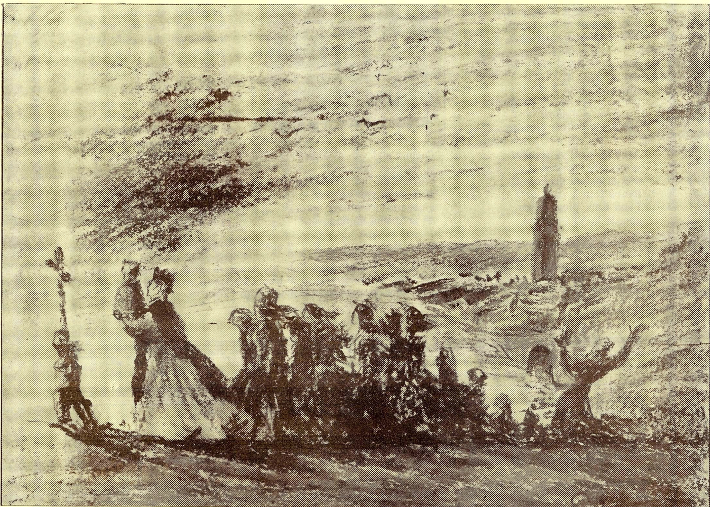
(Sta. Calamanda portada al "Soler") R. Sala