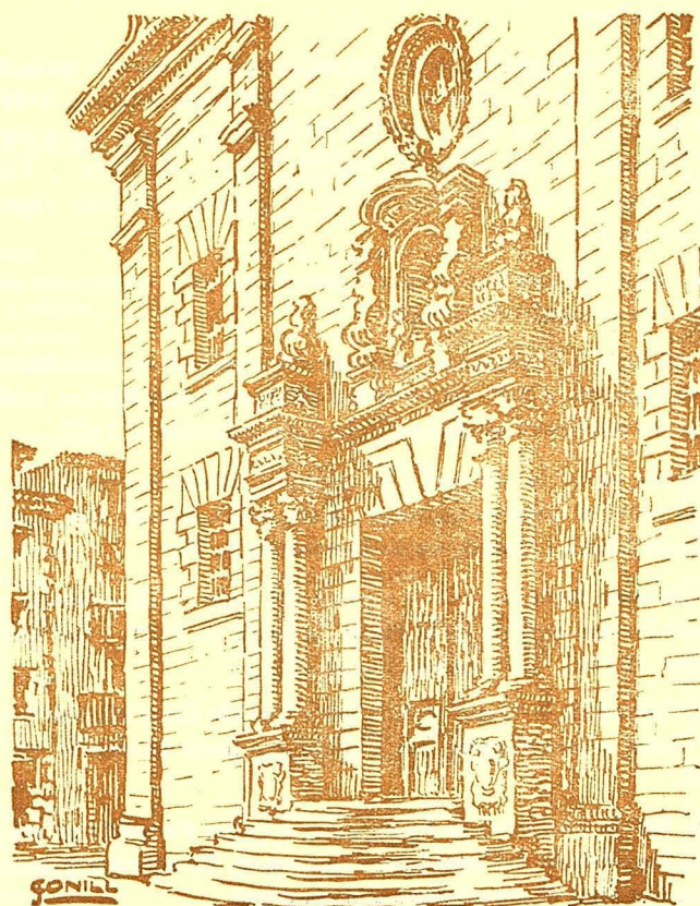
Façana de l'església parroquial de la Mare de Déu de la Pietat de Vic, on es veneren les cendres dels Sants Llucià i Marcià