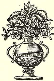
Lletra i música d'autors desconeguts.

AL QUAL, EN EL SANTUARI COM FILL LA PARROQUIA DE