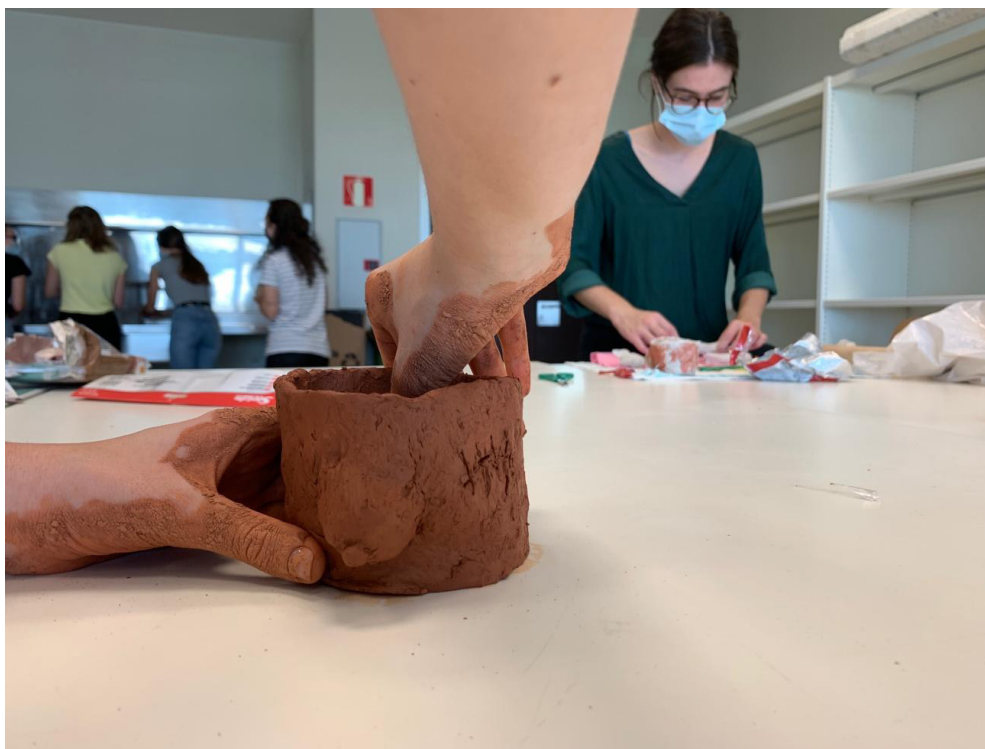
Fig. 3. Modelado en clase de vasija con mastectomía.