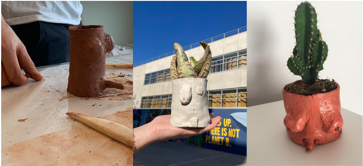
Fig. 5. Estudiante modelando en el aula una silueta transexual y otros trabajos representando la misma cuestión. Vasija de Vicent Navarro Just. Vasija de Marta Tejedo.

al descubierto en los cuerpos representados desnudos.