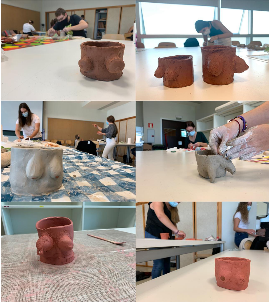
Fig. 2. Vasijas antropomorfas. Facultat de Magisteri, octubre de 2020.

ber insistido en darle forma de pecho perfecto durante excesivo tiempo, no lograba quedar unido a la vasija. La estudiante pidió ayuda diciendo: "profe, se me cae todo el rato". Pensamos a cerca de las prótesis, las mujeres que precisan una reconstrucción de pecho tras sufrir un cáncer de mama. La estudiante decidió dejar la prótesis suelta y otras compañeras optaron por hacer vasijas con un único pecho y una cicatriz por la amputación.