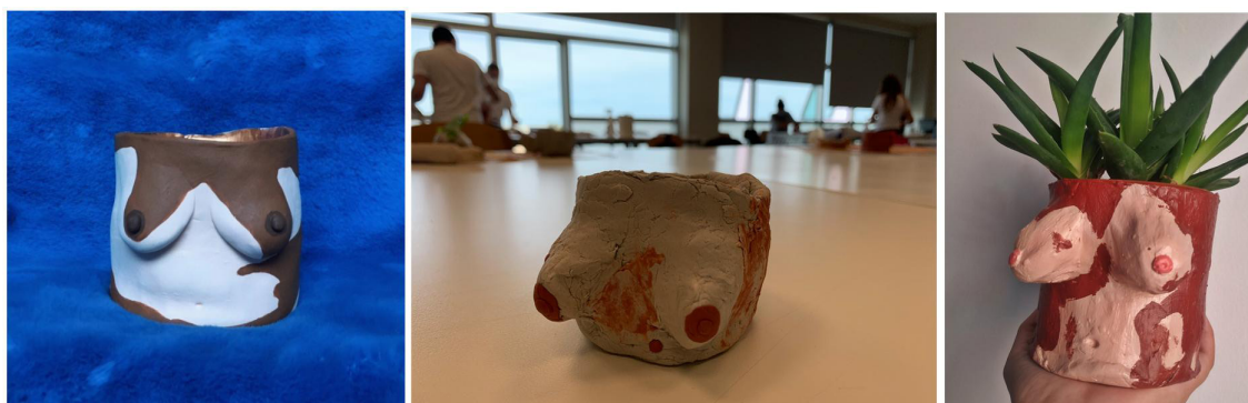
Fig. 4. Emma Low, Vitiligo , 2017. Cita visual de las tazas “Pot Yer Tits Away” de cerámica de la artista Emma Low obtenida de http://www.potyertitsawayluv.com/4700465-pots Trabajo de modelado en clase, fuente: autores. Vasija de Sandra Lapeña Villaplana.

Otra cuestión que mereció nuestra atención fue la ausencia de vello en las corporeidades representadas. Apenas algún estudiante incorporó el pelo en las vasijas femeninas. Esto permitió abrir el tema de los cuerpos depilados, del rechazo al pelo en axilas, pezones o pubis de mujeres; de la infantilización de los cuerpos de mujer y por el contrario la hipersexualización de los cuerpos infantiles, todo ello cuestiones de actualidad y muy vinculadas a reflexiones filosóficas profundas referidas a las estéticas del cuerpo o la somaestética (Shusterman, 1999).