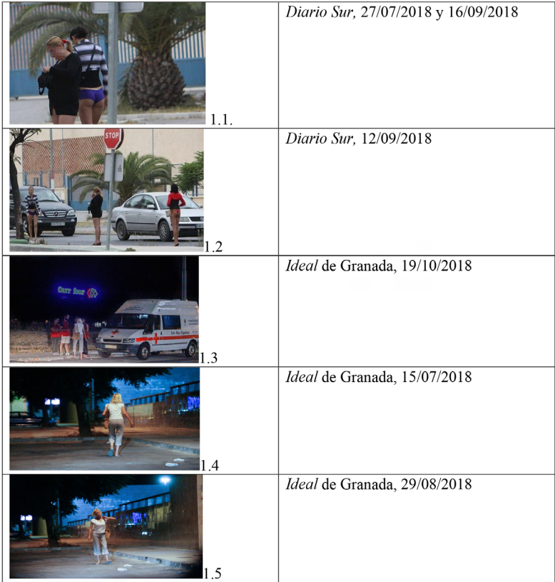
Tabla 1. Despieces y multiusos fotográficos

DOI: http://dx.doi.org/10.6035/2174-0992.2021.22.5