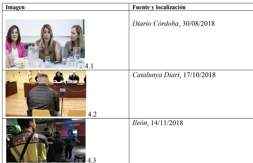
Tabla 4. Cronotopos de la institucionalización en torno a la prostitución

La persecución del delito de trata a través del fotoperiodismo de sucesos se condensa a través de dos escenas, la primera el enjuiciamiento a proxenetas y tratantes (imagen 4.2), representado por las personas acusadas entrando en los juzgados o sentadas frente al tribunal; y la segunda el momento de la redada y/o la detención, imágenes que a su vez remiten directamente al relato de liberación de víctimas por parte de la Guardia Civil o la Policía. Es importante señalar, como apunte de nuevo paradigma, la presencia de mujeres en estos contextos judiciales (como se muestra en la imagen 4.4) -habitualmente acusadas como intermediarias en las redes de trata- y que adquieren una mayor visibilidad en el relato visual que en el verbal.