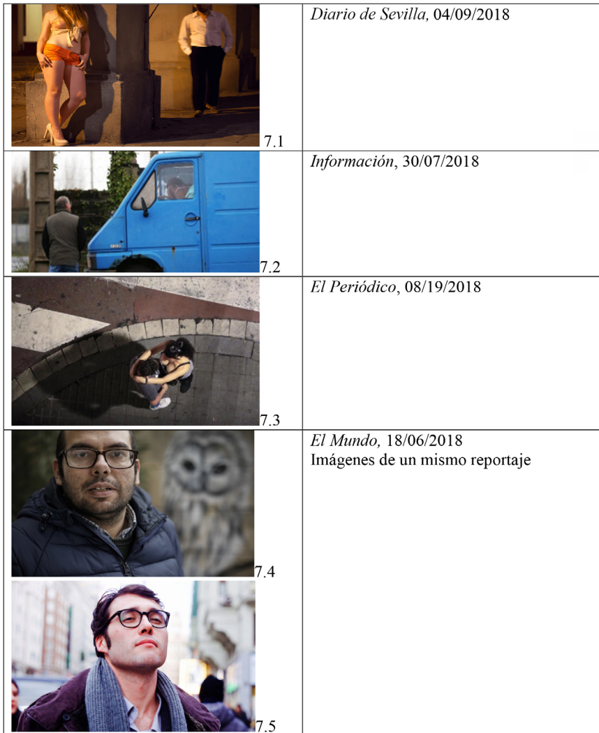
Tabla 7. Cronotopos de las figuras transfronterizas: demandantes de prostitución