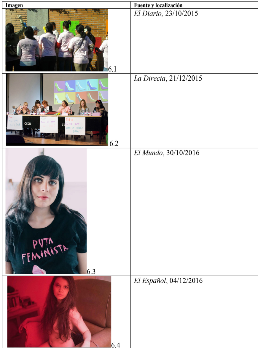
Tabla 6. Cronotopos de las figuras transfronterizas: las activistas proderechos