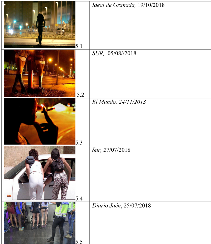
Tabla 5. Cronotopos de las figuras outsiders : las prostitutas