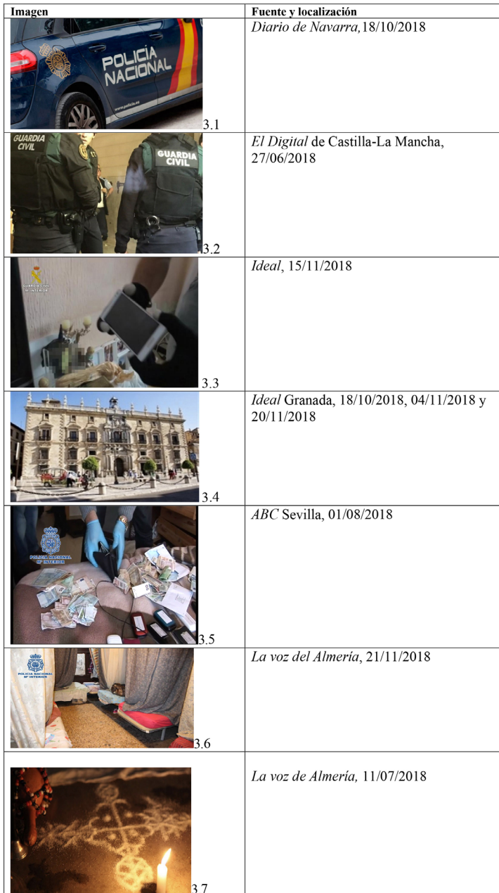
Tabla 3. Los macro-frames metonímicos y la objetivización visual de los relatos

DOI: http://dx.doi.org/10.6035/2174-0992.2021.22.5