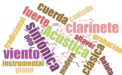
Fig. 1 Música

La percepción del concepto música por los estudiantes, todos ellos titulados superiores de Conservatorio fue la de mayor número de aportaciones. Destacan la tímbrica representada por familias: cuerda, viento, voz, elementos estilísticos y objetos con significación muy específica de la música como es el caso de la batuta. En la nube de palabras, destacan los instrumentos acústicos; en los géneros y tipologías musicales aparecen la música tradicional, clásica y el pop y, finalmente, como elementos específicos del siglo XX, la grabación y el altavoz. En resumen los mapas mentales construidos por el conjunto de los estudiantes de música, por individualidades a partir del visionado de las cinco obras en sus contextos muestran una percepción, al menos docente, claramente inclinada hacia los elementos acústicos de la música y las familias instrumentales reconocidas, sin referencias al lenguaje musical ni a los elementos o estructuras musicales, y apareciendo la música de los siglos XX y XXI con menor énfasis. (Figura 1).