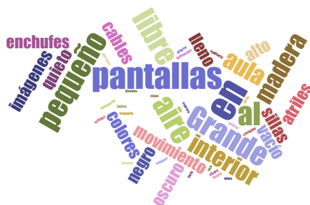
Fig. 2 Escenario