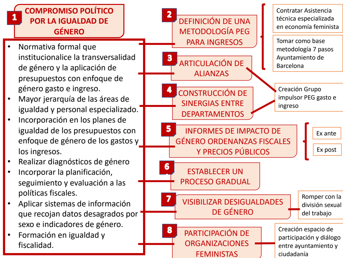
Imagen 3. Recomendaciones para aplicar el análisis de género al ingreso municipal