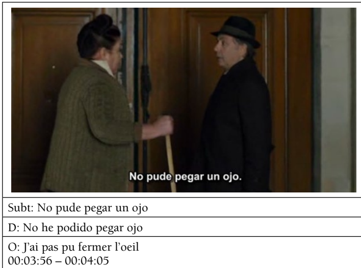
Captura de imagen nº 1

aparece en pantalla: no pude pegar un ojo , podemos pensar que se trata de un error o de una mala traducción literal (ver captura de imagen 1).