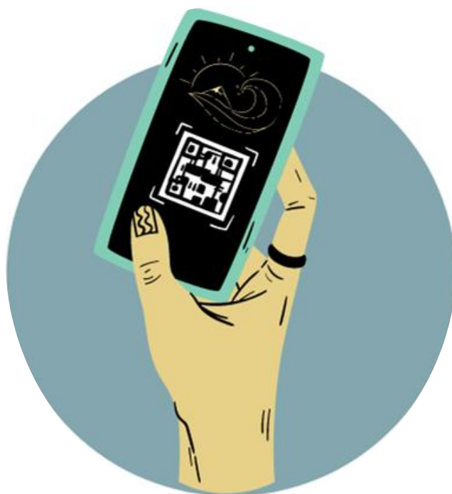
FIGURA 2) LOGOTIPO DE ALCOPOINT

Una vez descargada la aplicación en el dispositivo inteligente, se procederá a abrirla. Tras pulsar en el icono de la app , la pantalla mostrará el logotipo de AlcoPoint sobre un fondo blanco liso. El logo se compone de un círculo de color turquesa, haciendo alusión a la joya mediterránea de la que goza el destino castellonense. Dentro de este círculo azulado se incluyen varios elementos caracterizadores de la herramienta digital AlcoPoint. En primer lugar, se puede apreciar en la Figura 2 un boceto de una mano sosteniendo un dispositivo móvil, cuya pantalla muestra, de forma simplificada, el proceso de escáner de un código QR. Sobre este código QR y en mucho menor detalle se ha incluido un pequeño dibujo de forma intencionada; se trata de un pequeño trazo compuesto por una ola, una colina y el sol, en referencia al binomio costa-montaña característico del destino turístico Alcalà-Alcossebre.