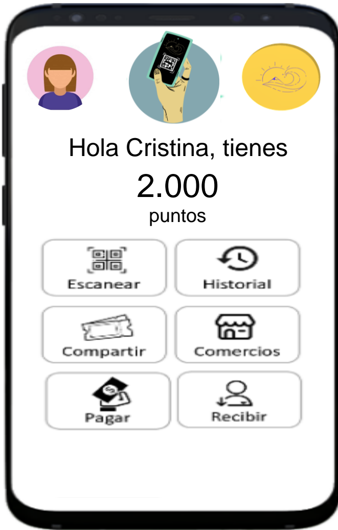
FIGURA 3) DEMO ALCOPOINT Elaboración propia.