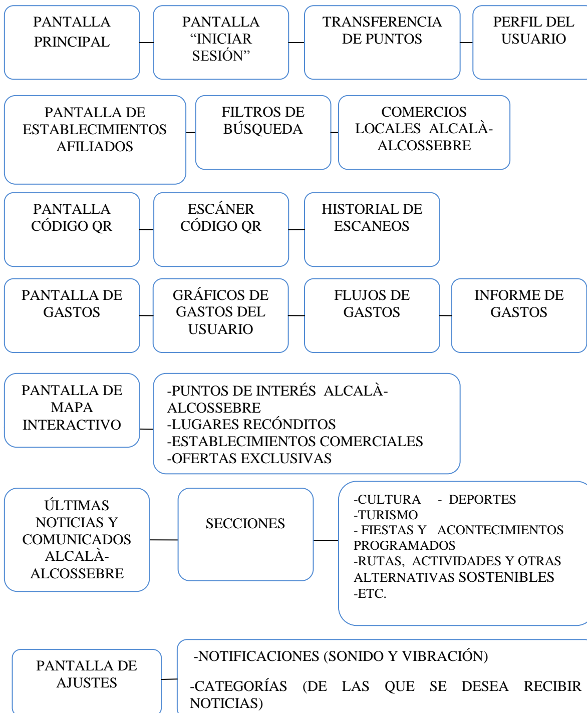
DIAGRAMA 1) PLANTILLA DE ESQUEMA DEL PROTOTIPO DE ALCOPOINT