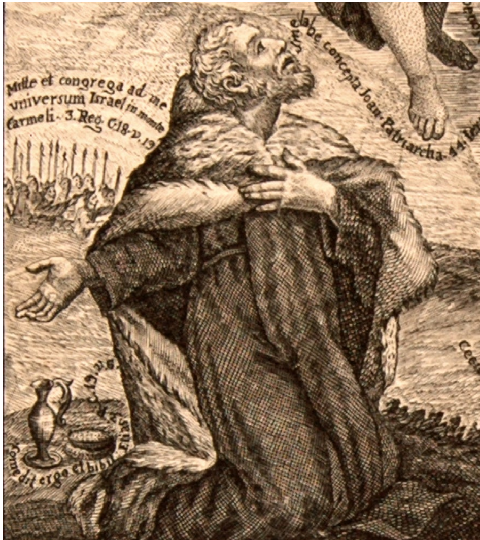
Fig. 4. Francisco Gordillo, detalle de Inmaculada carmelitana , 1805, 46 x 30 cm, Museo Francisco Cossío, San Luis Potosí, SLP, México.