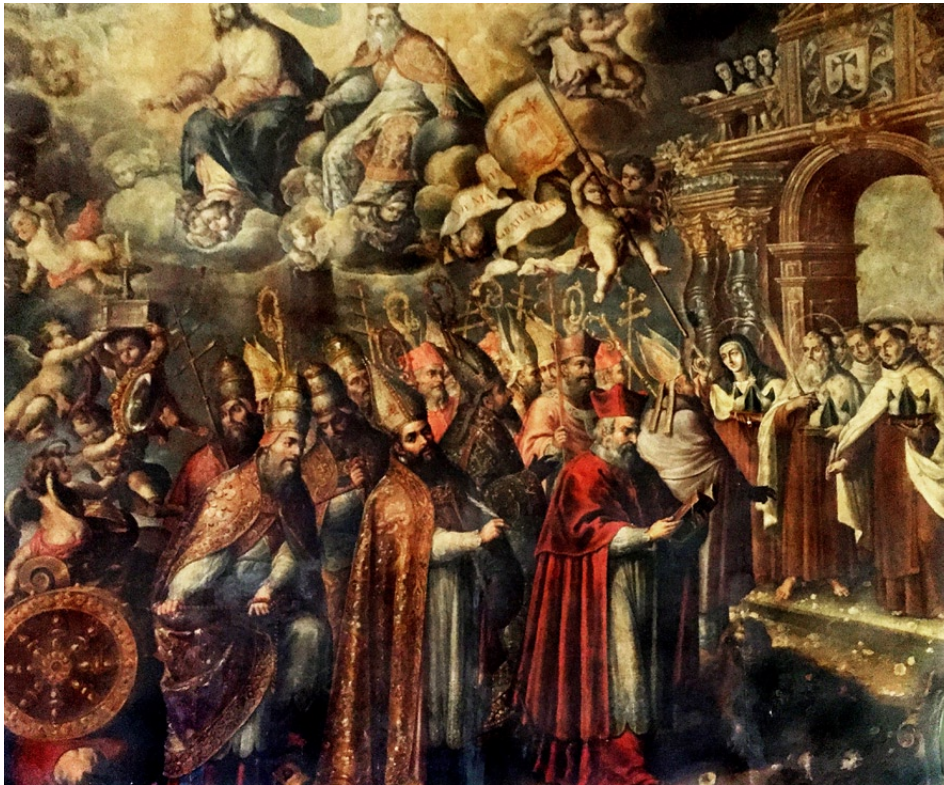
Fig. 8. Nicolás Rodríguez Juárez, fragmento de Triunfo de la Virgen del Carmen , 1695, óleo sobre lienzo, iglesia del Carmen, Celaya, Guanajuato, México

En la segunda cartela podemos leer (fig. 9):