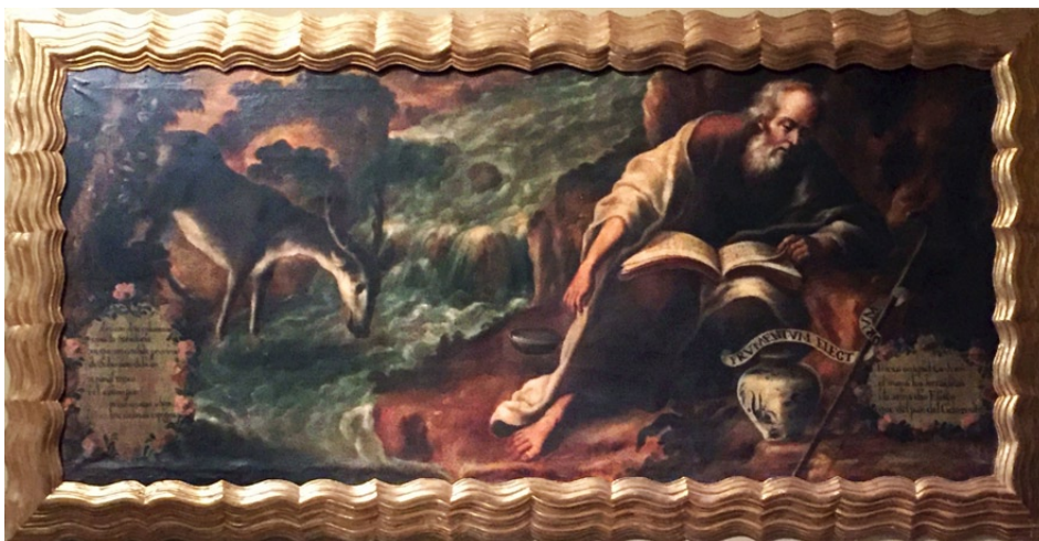
Fig. 1. Anónimo, Elías en el torrente del Querit , siglo XVIII óleo sobre lienzo, 113 x 262 cm, Museo de la Basílica de Guadalupe, Ciudad de México