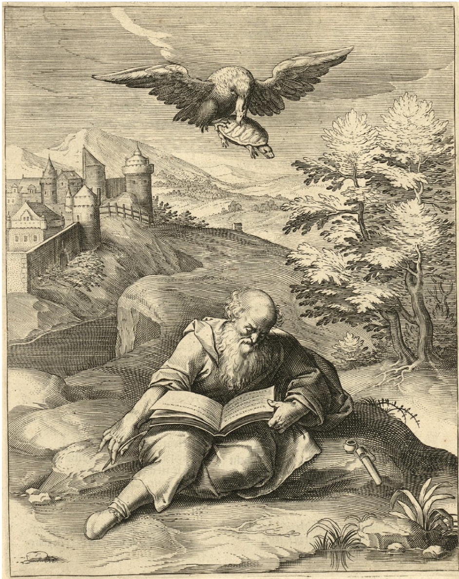
Fig. 2. Gijsbert van Veen, Tute, si recte vixeris , en Otto Van Deen, Quinti Horatii Flacci Emblemata , Antuerpiae, Prostant apud Philippum Lisaert, auctoris aere & curae, 1612, p. 187, Biblioteca Nacional de España, Madrid