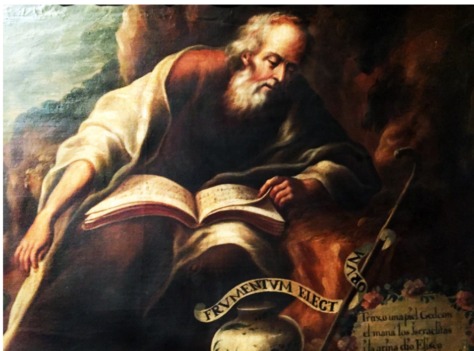
Fig. 6. Anónimo, fragmento de Elías en el torrente del Querit , siglo XVIII, óleo sobre lienzo, 113 x 262 cm, Museo de la Basílica de Guadalupe, Ciudad de México

Ello nos permite suponer que la vasija de cerámica representada junto al báculo contiene la harina imprescindible para la fabricación del pan.