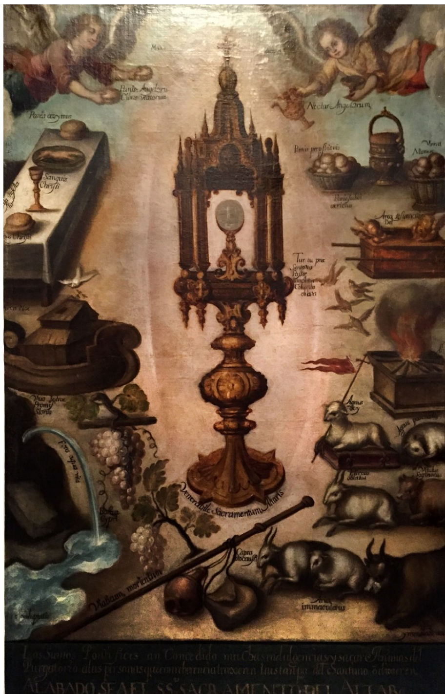
Fig. 10. Anónimo, Alabado sea el Santísimo Sacramento del altar , siglo XVIII, óleo sobre lienzo, 104 x 159 cm, Museo de Arte Religioso de Santa Mónica, Puebla, México