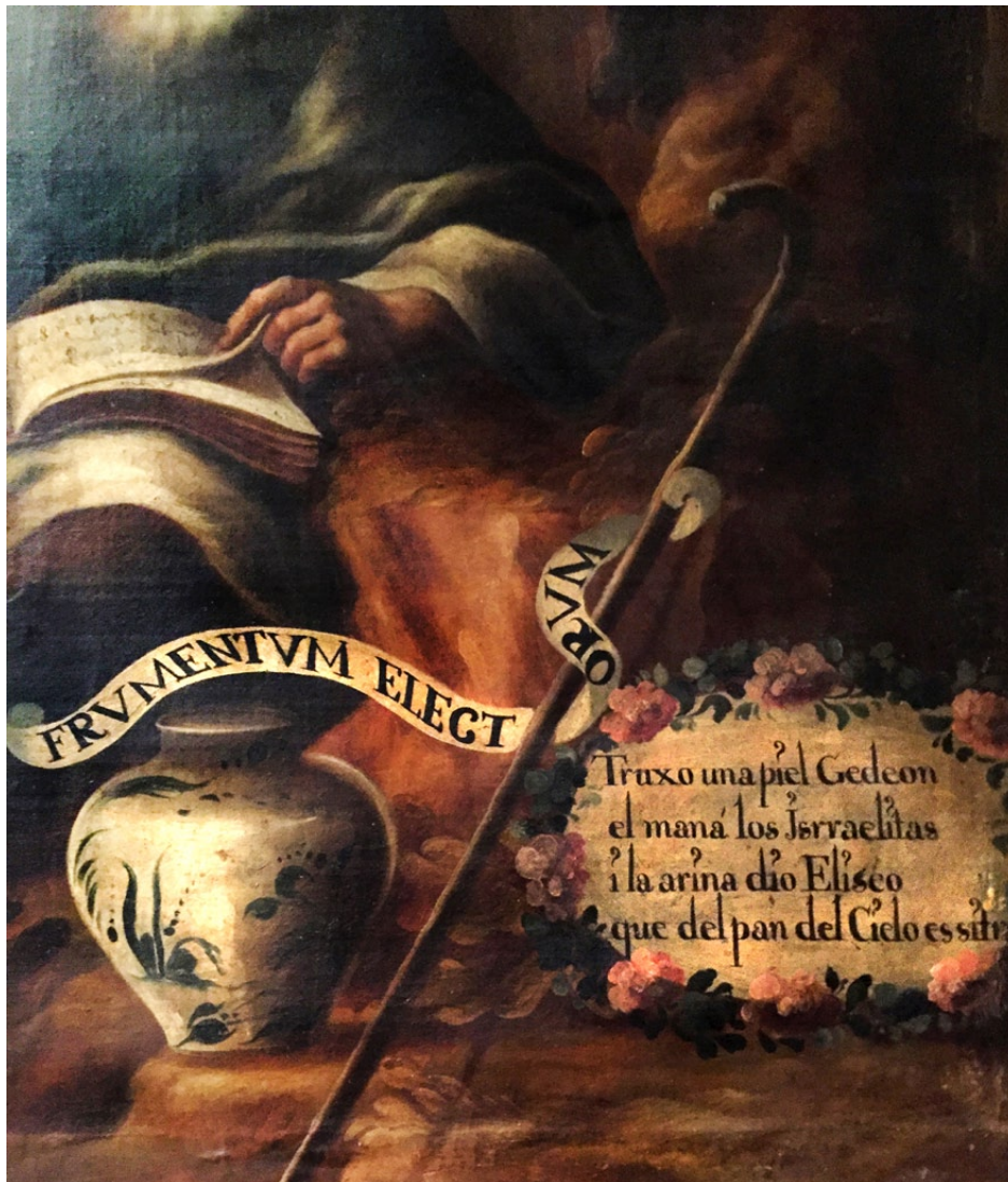
Fig. 9. Anónimo, Elías en el torrente del Querit (detalle), siglo XVIII, óleo sobre lienzo, 113 x 262 cm, Museo de la Basílica de Guadalupe, Ciudad de México