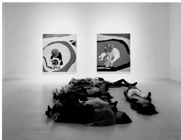
Auxiliar sala museo, EAPV-C, 2019