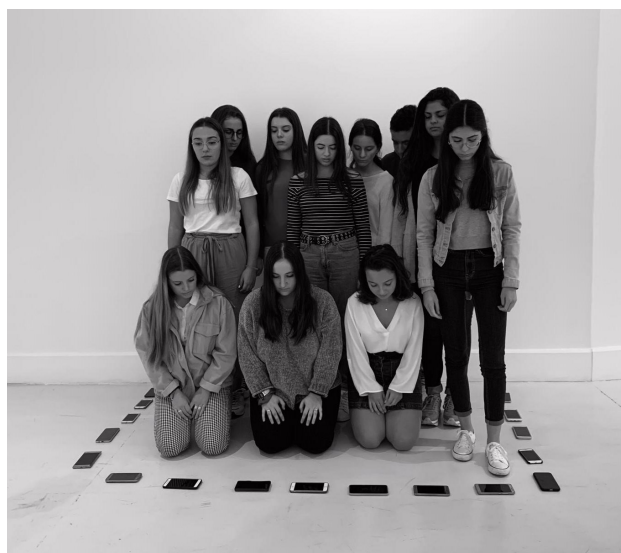
Grupo ADN de colores y Black & White, EA-