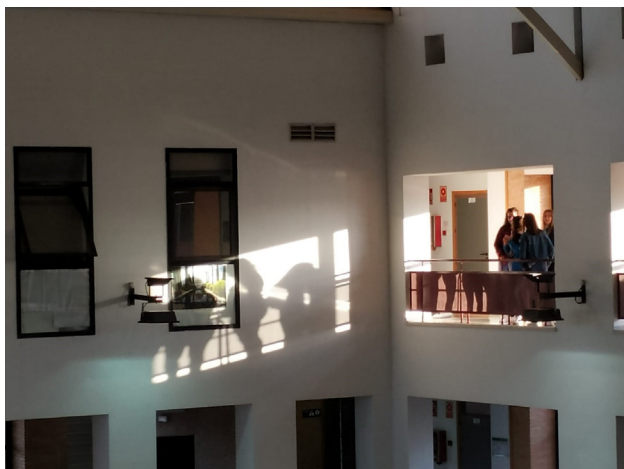
Grupo Introspectivos, Actividad Contramirada, EAPV-C, 2019

Antes de la visita, las profesoras -a pesar del desasosiego que a veces generan estas prácticas docentes- compartimos el espacio de seguridad de avanzar juntas y progresivamente y, aunque la asignatura y la acción en el CAC siempre acontecen de forma diferente, haber estado allí en otras ocasiones , con otros grupos resulta determinante y nos reconforta. Por tanto, los antecedentes que configuran nuestro imaginario docente también nos ayudan a buscar nuevas posibilidades, ya que nos muestran recorridos transitados en la formación de maestros y maestras que demandan una continuidad, seguir explorando la potencialidad del encuentro real con el arte contemporáneo desde otro lugar .