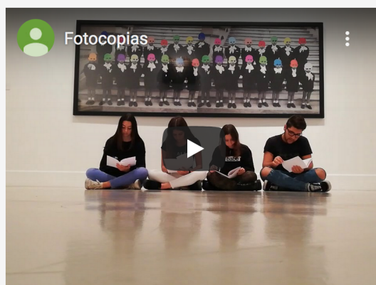
Grupo Los introvertidos, EAPV-C, 2018

Quizás no seréis capaces de ver este vídeo completo, simplemente porque es monótono y aburrido, pero pensad un segundo ¿no es la misma monotonía que hemos aguantado durante más de 15 años? Es hora de cambiar y dejar de ser los mismos con distintos pantalones, es hora de ser únicos y de demostrar que lo somos.