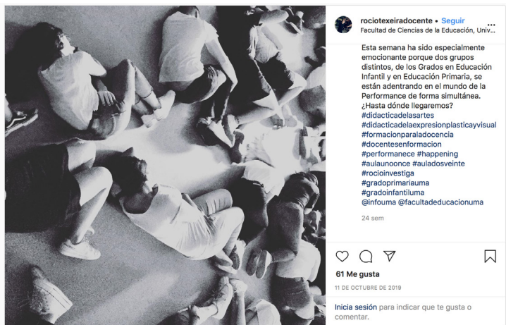
Teixeira, R., Instagram, EPV-A, 2020