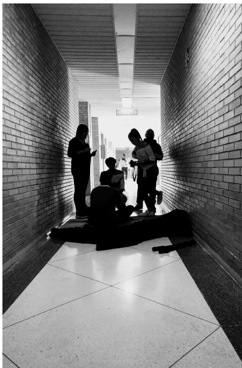
Vaquero, C., EAPV-C, 2019