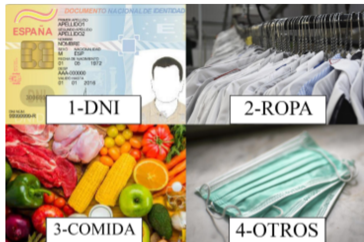
2-Diferentes recursos a los que se destina el dinero recaudado.

Una pregunta muy importante que se debe aclarar a los mecenas es en qué se va a invertir el dinero que han aportado. En este caso, realicé una imagen con la que los internautas podrían ver a simple vista en qué íbamos a invertir las donaciones, acompañado de un texto explicativo.