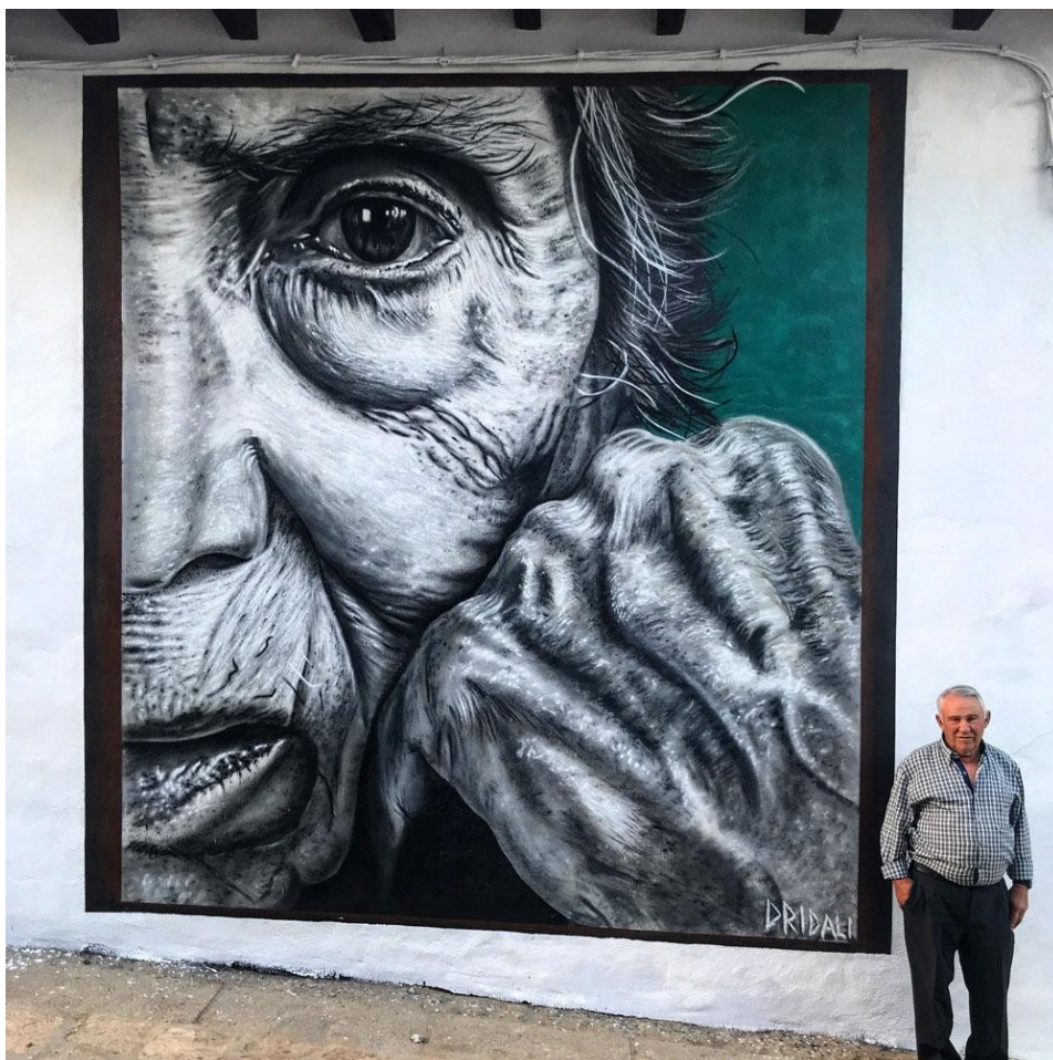
Mural 3: La lechera - Garcibuey (2019). Dridali

"Intento que mi obra no sea una simple reproducción de una fotografía, mi principal objetivo es representar la expresión perfecta de la persona retratada, convirtiendo el espacio público en un espacio de reflexión. Tengo la suerte de pintar en el museo más grande del mundo: la calle. Aquel que permite su entrada a todos los ciudadanos, sin importar género, situación económica o religión".