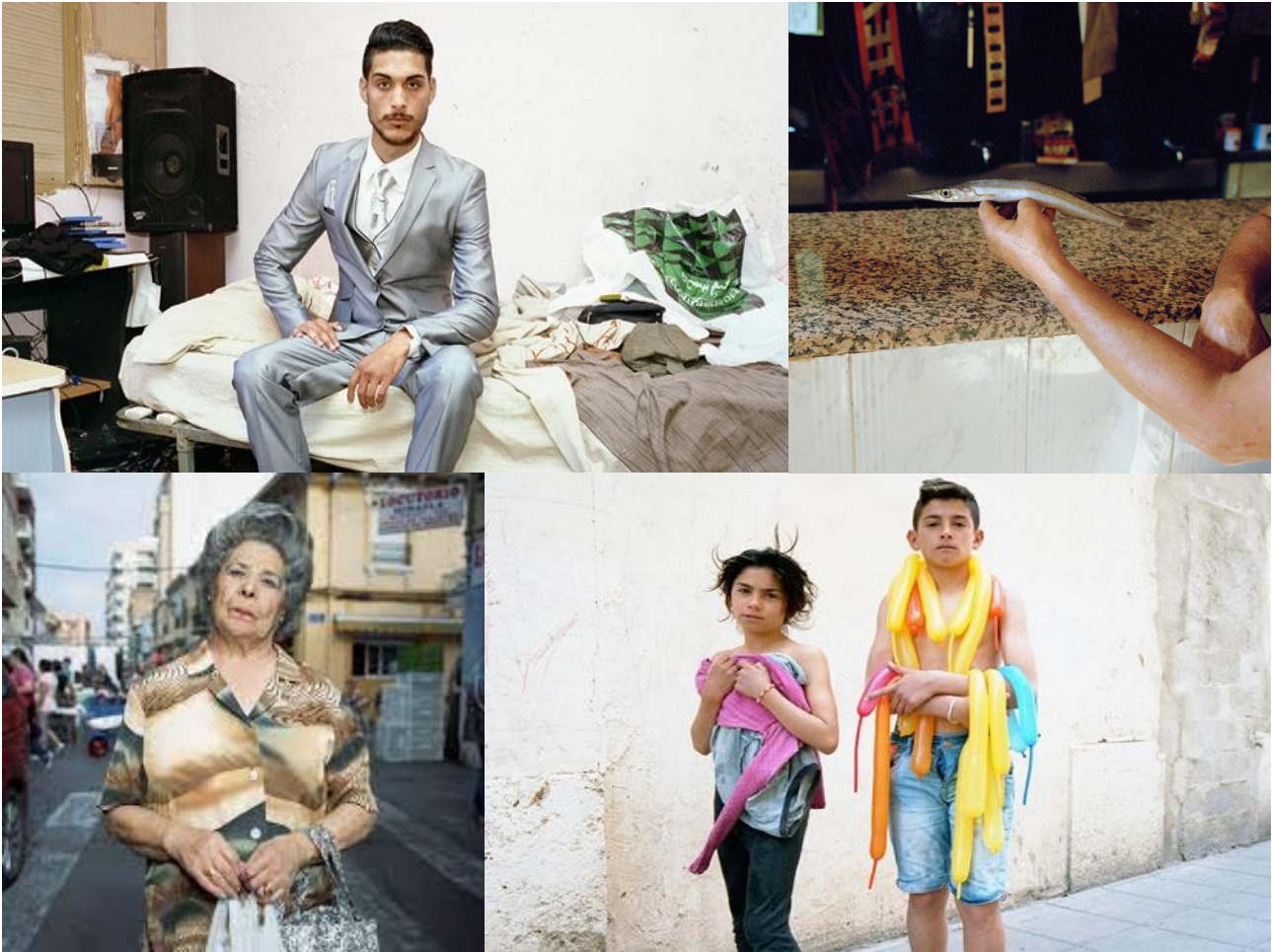
Photos 2: Quisiera que siempre fuera así - dijo él. Siempre es sólo un momento - respondió ella (2019), Laura Silleras

Silleras was inspired by Michael Ende's 2 La historia interminable , the project is proposed as a journey through the Cabañal in which time plays a fundamental role.