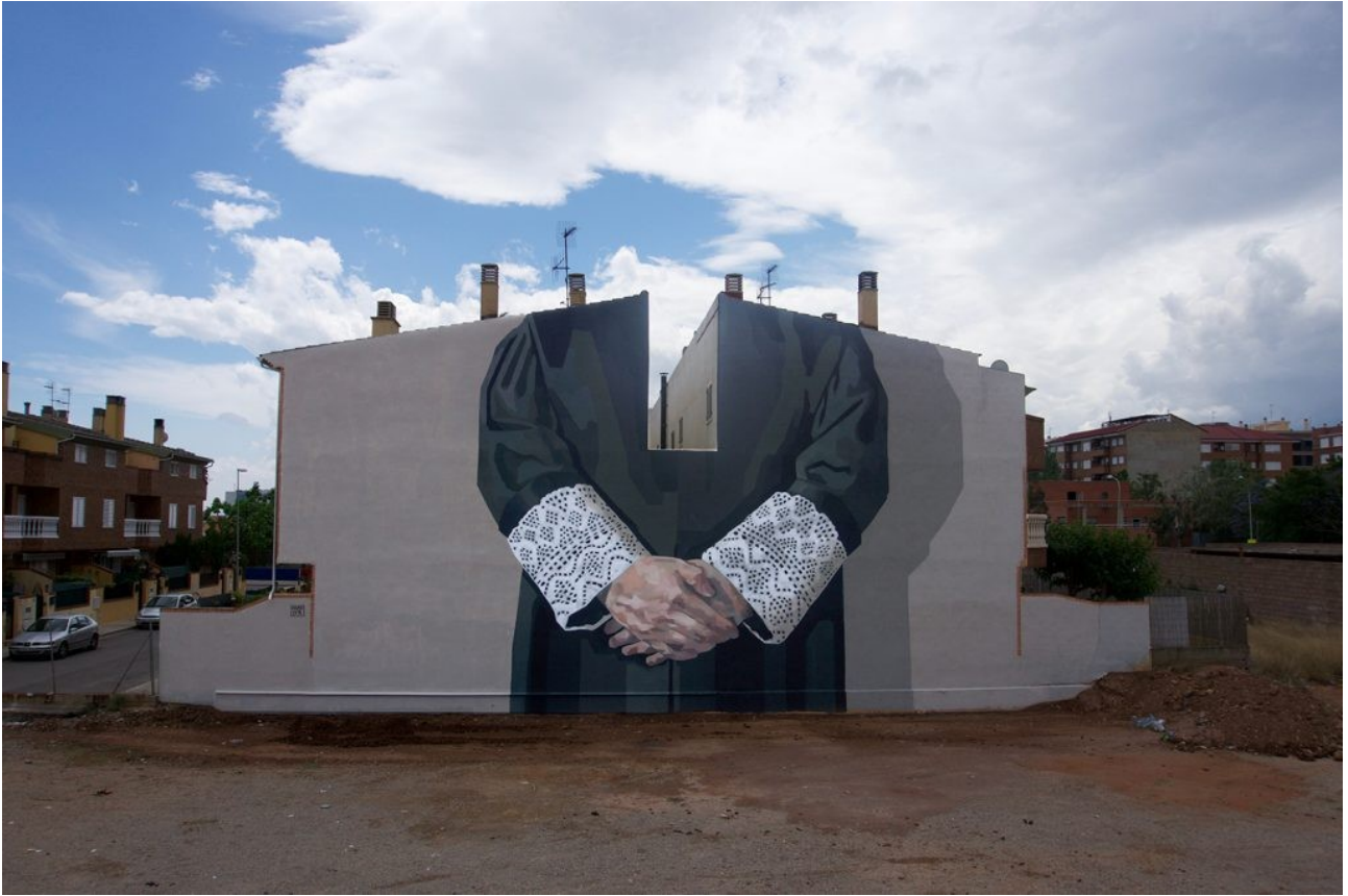
Mural 2 : Patriarcado . Villarreal (2018). Hyuro.