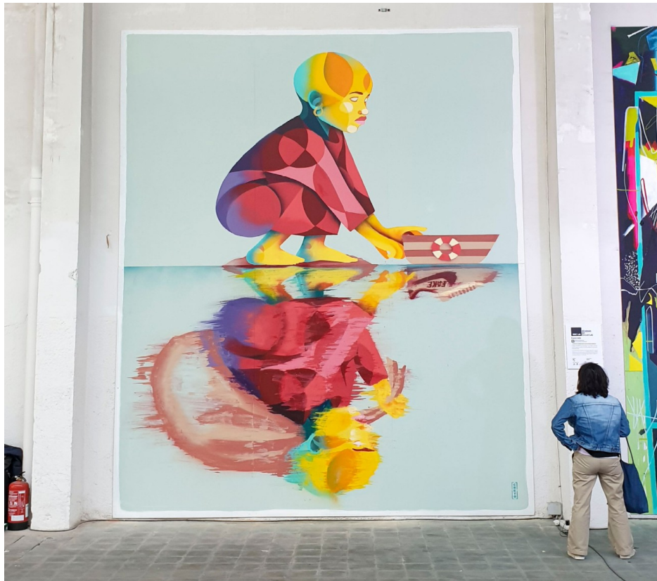
Mural 5: Mantenerse a flote - Trabajo para WAC LAB . El Poblenou, Barcelona (2020).

“El arte para mi es como un escape a la cotidianidad. El arte es la vía de escape a la dura realidad a la que te enfrentas cuando te haces adulto. Es una forma de seguir soñando e imaginando. Siempre busco transmitir algo del lugar donde nací o donde estoy en ese momento y busco plasmar siempre un mensaje a la sociedad.”