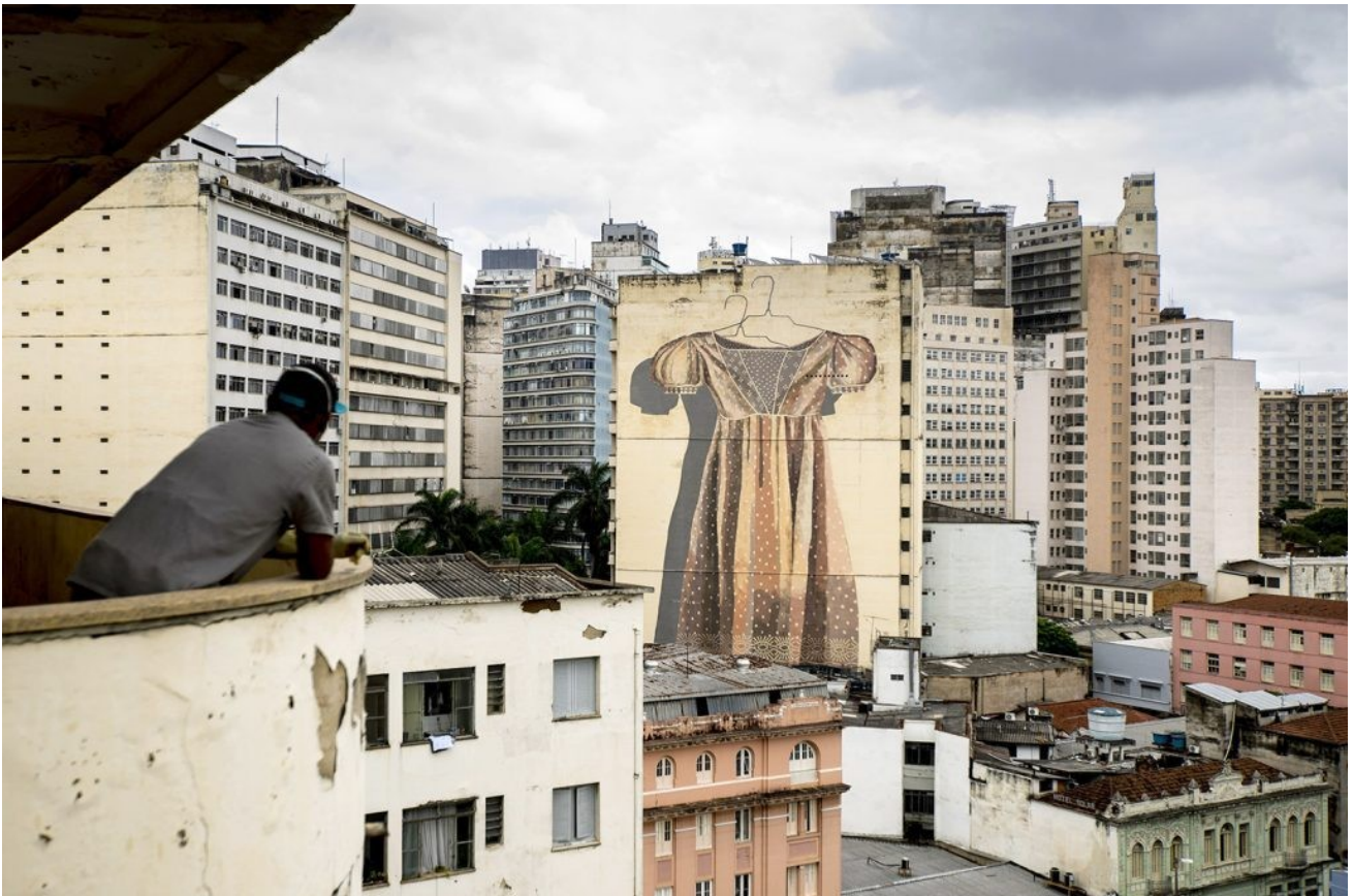
Mural 1: O que fica (What Remains) - Belo Horizonte, Brasil 2018. Hyuro