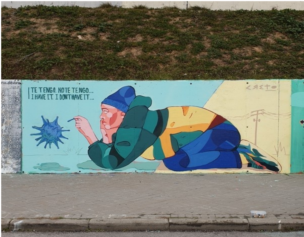
Mural 6 : Te tengo. No te tengo... - Moratalaz, Madrid (2021). Concreto