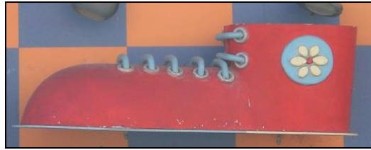
Imagen 6. Escultura de un zapato de grandes dimensiones. Avenida Corazón de Jesús (Vall d'Uixó).