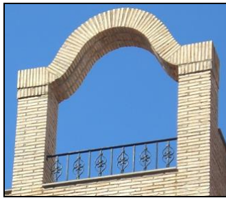
Imagen 2. Arco decorativo en la balconada de una vivienda unifamiliar. Plaça de l'esglèsia de l'Assumpció (Vall d'Uixó). Década de 1990 (aproximadamente).