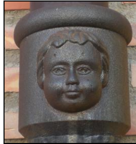
Imágenes 3, 4 y 5. Caras de agua en canaladuras. Calles Lope de Vega, Escultor Marco y Plaça l'Assumpció (La Vall d'Uixó).

En esta misma actividad se puede incluir una breve aproximación transversal al sistema comunicativo no textual basado en imágenes o iconos publicitarios (que muestran un significado supuestamente conocido por el conjunto de la sociedad que los utiliza). Estos dibujos y representaciones hacen referencia a una tipología específica de negocio y se ubican en la zona superior de la entrada al local. Tras una breve explicación del docente, la inclusión de esas imágenes icónicas en el dossier permitirá establecer nuevamente la conexión con el pasado y observar cómo antiguamente también determinados oficios y negocios situaban en el acceso a sus locales símbolos distintivos y representativos, sin necesidad de un mensaje escrito. Al igual que antes, podemos plantear al alumnado la identificación del significado de la simbología actual del dibujo o icono y sugerir la búsqueda en internet de elementos similares del pasado para establecer comparaciones.