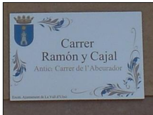
Imagen 8. Placa indicativa de nombre de calle.

través de éste podemos preparar una nueva batería de preguntas a resolver, algunas de las cuales precisarán nuevamente del uso de un buscador en internet. Además, esta actividad cuenta con el aliciente de efectuar posibles encuestas orales a las personas más veteranas que habitan en tal lugar, con la capacidad de grabación de las respuestas a preguntas variadas relativas al nombre de la calle o el barrio (si saben el por qué tiene ese nombre o si queda alguna reminiscencia visible que permita establecer la conexión entre el nombre y lo que le da nombre), e inclusive ampliar el espectro de la documentación con preguntas a esas mismas personas sobre su propia experiencia vital en el lugar (tipo de trabajo que desarrollaban, origen geográfico, antiguas fiestas o costumbres en la calle, etc...).