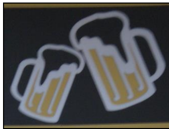
Imagen 7. Panel con jarras de cerveza. Avenida Octavi Ten (Vall d'Uixó).