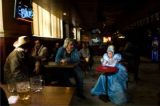
Figura 3. Goldstein, D (2007). Fallen Princesses [fotografia]. Recuperat de https://www.dinagoldstein.com/fallen-princesses/