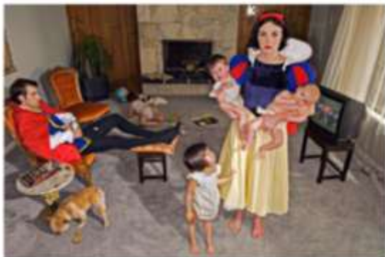
Fallen Princesses, SNOWY, 2008