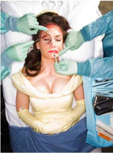
Figura 2. Goldstein, D (2009). Fallen Princesses [fotografia]. Recuperat de https://www.dinagoldstein.com/fallen-princesses/