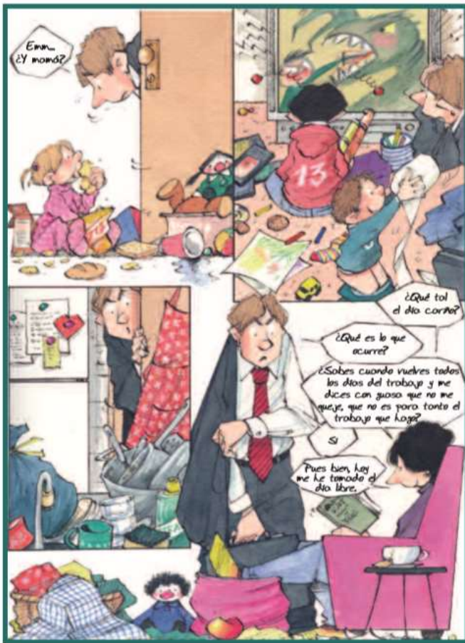
Figura 1 Mahatma, G. (2007) El hogar [Il·lustració] recuperada de http://www.educatolerancia.com/wp-content/uploads/2016/12/Y_tu_te_apuntas_a_rompe_el_machismo.pdf