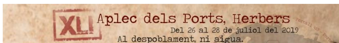
Figura 6: Lema XLI Aplec dels Ports, Herbers 2019

Per finalitzar, m'agradaria concloure amb el lema del quaranta-unè Aplec dels Ports celebrat a Herbers el 2019, que girava entorn de la lluita contra la despoblació i el desequilibri territorial: "Al despoblament, ni aigua"