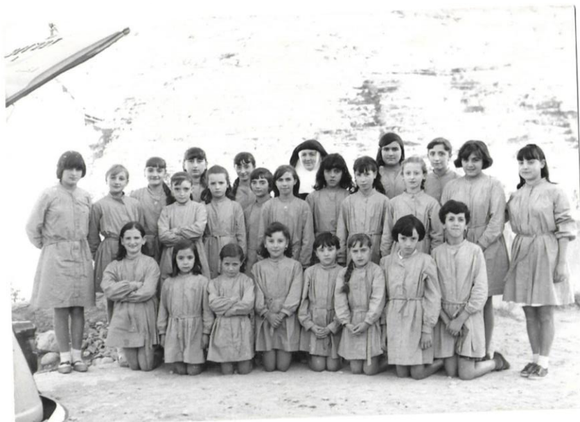
Figura 5. Escola de la Consolació, Forcall anys 60.

Si, anaem d'excursió, en les monges normalment tots els anys feem una o dos excursions. Vam anà a Saragossa, a València... I después el dia que ere la festa de... de lo del col·legio que se die "La Presentación" a les monges, anaem a dinà per ahí. I a les xiques de l'escola ere "Santa Catalina" i també feen lo mateix. I els xics ere "San Nicolás", i també se'n anaen a dinà per ahí pel monte o per allí per el poble. (E2)