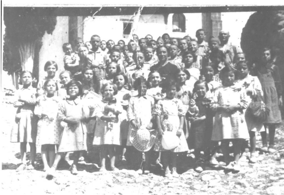
Figura 1. Anys quaranta a L'Ermite de la Consolació, Forcall

Altrament, és va crear també durant aquests anys de la mà de la II República el Consell de l'Escola Nova Unificada (CENU), on es volia dur a terme una metodologia activa i crítica, oposada a la tradicional pedagogia teòrica. La finalitat d'aquest consell era formar a professionals agricultors que milloraren els cultius de la terra, a més de formar ciutadans actius i crítics, per relacionar l'amor per la terra amb la permanència a les poblacions. Una altra novetat que també afegia aquest Consell era la graduació de les escoles (escoles mixtes), on en pobles com Castell de Cabres, escoles unitàries, ja eren existents o a Xiva de Morella on demanaven aquelles escoles graduades, però amb la Guerra Civil, totes aquestes expectatives de futur es van veure afectades, i a la comarca dels Ports van passar de llarg.