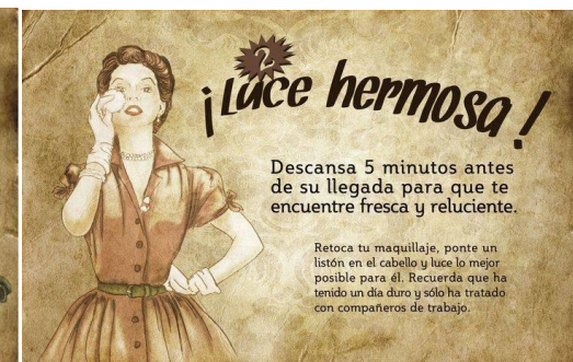
Figuras 28 y 29: Sección Femenina. Guía de la buena esposa (1953).