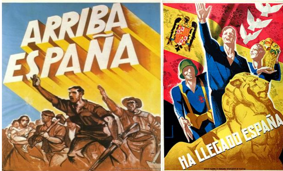
Figura 17. Anónimo. Arriba España . Madrid: Carteles de la Guerra Civil Española (VVAA: 1981).

Como podemos observar en la cita, se recalca que el cometido de las mujeres siempre será el hogar y hacerles la vida agradable a los hombres. A continuación, expondremos y analizaremos algunos de los carteles más relevantes del bando sublevado donde podremos ver claramente reflejada esta ideología moderada y tradicionalista y su influencia directa sobre la imagen ideal de la mujer fascista durante el período bélico. En primer lugar, vamos a exponer los carteles que representan a la mujer en sus roles tradicionales, como son el de madre y ama de casa (figuras 17 y 18).