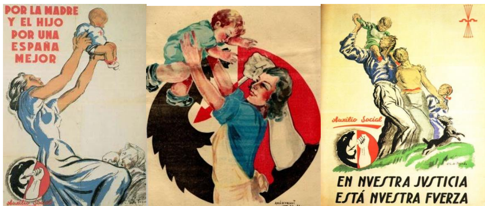
Figura 19. Sáenz de Tejada, Carlos. Por la madre y el hijo por una España mejor. (1938).

Entrando ya en los carteles que muestran nuevas labores de las mujeres como consecuencia del estallido de la guerra, destacamos aquellos que llaman a su participación en labores asistenciales, como son el cuidado de heridos o niños huérfanos (figuras 19, 20 y 21). En los siguientes tres carteles podemos ver representado el símbolo de Auxilio Social, una organización de socorro humanitario que se creó durante la Guerra Civil en el bando sublevado para atender a las víctimas de la guerra. En los tres carteles, de manera reiterada vemos cómo se hace hincapié en el sentimiento más maternal de las mujeres, ya que siempre salen acompañadas por infantes. Tradicionalmente, a las mujeres se las ha asociado con los cuidados y los atributos de tiernas, dulces y cariñosas, predispuestas por naturaleza a prestar ayuda, cuidado y protección a los demás, por ello vemos como en los carteles de esta organización, cuyo objetivo es pedir ayuda para atender a las víctimas siempre se utiliza la imagen de las mujeres, acompañadas de niños, o como vemos en la figura 21 acompañadas de la unidad familiar completa.