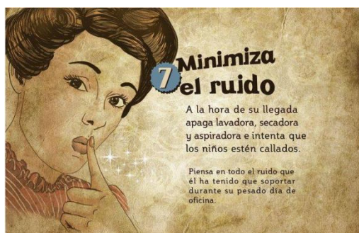
Figura 34: Sección Femenina . Guía de la buena esposa (1953).

Con el análisis de esta guía llegamos al final de nuestra revisión, en la cual hemos podido comprobar la evolución de la imagen de la mujer durante la Guerra Civil Española y la posguerra llegando con ella a la culminación de la creación de la mujer ideal del régimen fascista que permaneció vigente en España hasta 1975 con el inicio de la democracia. Aunque todavía hoy en día muchas de estas ideas siguen estando en nuestra sociedad explican, de algún modo el machismo y la sociedad patriarcal que todavía nos persigue.