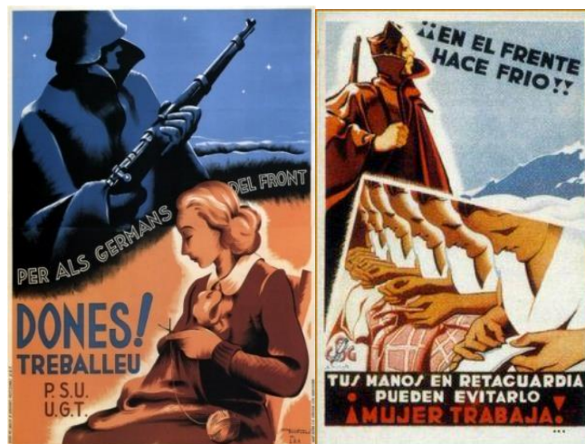
Figura 2. Fontserè, Carles. Dones! Treballem per als germans del front. Barcelona: P.S.U y U.G.T.

En los siguientes carteles que nos ocupan (figuras 2 y 3) vemos un llamamiento a la incorporación de las mujeres a la industria textil. Hemos querido destacar precisamente esta industria porque además de servirnos como ejemplo de ese nuevo espacio que se abre ante la mujer, la industria textil, muestra una de las necesidades de la guerra, ya que esta se dilató en el tiempo y llegó el invierno. En este sentido se realizaron diversas campañas contra el frío que animaron a las mujeres a incorporarse a la industria textil con el objetivo de tejer ropa para los soldados. Pero si algo nos llama la atención de ambos son sus eslóganes, ya que van dirigidos al colectivo femenino, el cual se subordina en todo momento al masculino, claramente podemos verlo reflejado en el lema de la figura 2: «Dones! Treballem per als germans del front».