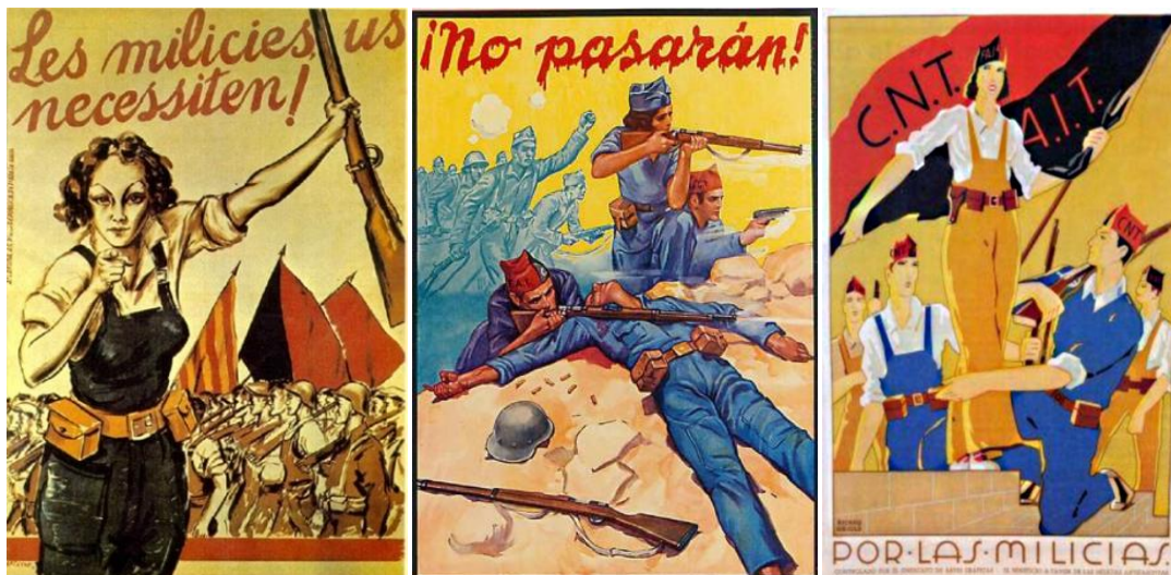
Figura 11. Arteche, Cristobal. Les milicies us necessiten . Barcelona: Comissariat de propaganda Generalitat de Catalunya (1936)

Y para finalizar con este apartado referido a los carteles del bando republicano, destacaremos dos últimas temáticas. En primer lugar podemos ver los carteles que muestran la imagen de mujer miliciana (figuras 11, 12 y 13). Estos carteles pertenecen a los primeros meses del conflicto, en los cuales se popularizó la imagen de la mujer miliciana ataviada con el mono azul típico de los combatientes masculinos y empuñando un fusil. Durante esta primera etapa las mujeres milicianas fueron consideradas como heroínas, ya que tuvieron el coraje y la valentía de trasladarse a la primera de batalla. No obstante, pronto cambiaron las opiniones al respecto y los estereotipos negativos, como los que acabamos de exponer referidos a la transmisión de enfermedades venéreas por parte de las mismas, hicieron que desde el gobierno se publicara un decreto que las obligó a retirarse de los frentes, dando paso a la división sexual de la que hablábamos anteriormente.