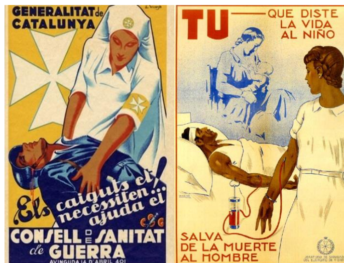
Figura 7. Vicente Pérez, Eduardo. Els caiguts necessiten ajuda . Barcelona: Consell de Sanitat de Guerra (1937).