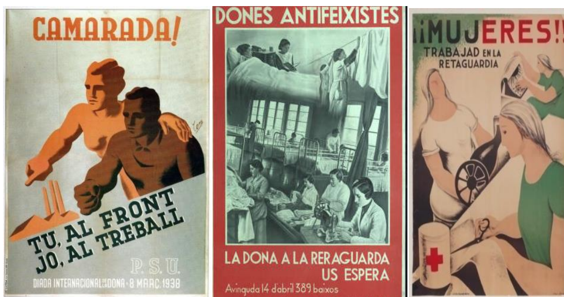
Figura 14. Tona, Rafael. Tu, al front, jo, al treball . Barcelona: Partit Socialista Unificat de Catalunya (1938).

Fue en este momento cuando se popularizó el lema «Los hombres al frente y las mujeres a la retaguardia» que podemos ver en los siguientes carteles (figuras 14, 15, y 16).