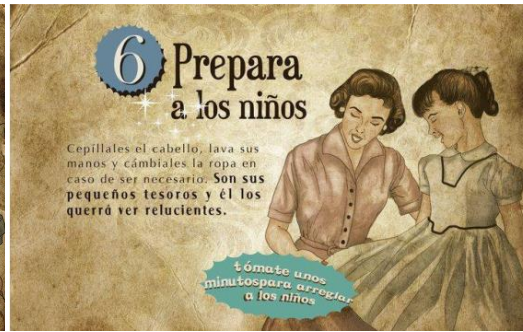
Figuras 26 y 27: Sección Femenina. Guía de la buena esposa (1953).