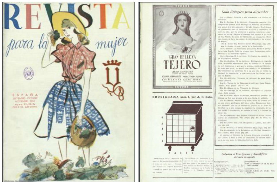
Figuras 26 y 27: Portada e interior de la Revista Y (Madrid), septiembre de 1945.

supo entrar en los hogares españoles de la época y transmitir sus valores y su modelo moral, considerado el idóneo para el régimen.