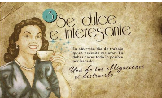
Figuras 32 y 33: Sección Femenina. Guía de la buena esposa (1953).