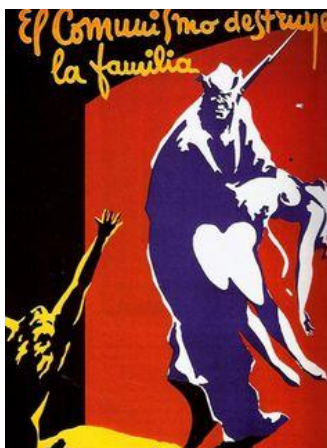
Figura 22. S.A. El comunismo destruye la familia (1936-1939).

Y por último queremos destacar también los carteles que muestran a la mujer como víctima (figura 22). En este caso vemos una figura femenina que yace sobre las manos de otra figura que representa el comunismo, mientras una mujer en actitud desesperada intenta alcanzarla con su mano. Se trata de un cartel, cuyo objetivo es desprestigiar al enemigo, en este caso el comunismo, no obstante, nos llama la atención que sean dos figuras femeninas las que protagonizan la escena. Este hecho tiene su explicación en que la mujer, desde el punto de vista de la ideología fascista, se asocia con un ser débil, por ello es utilizada en estos carteles cuya temática es representar la violencia del enemigo y las víctimas de la guerra.