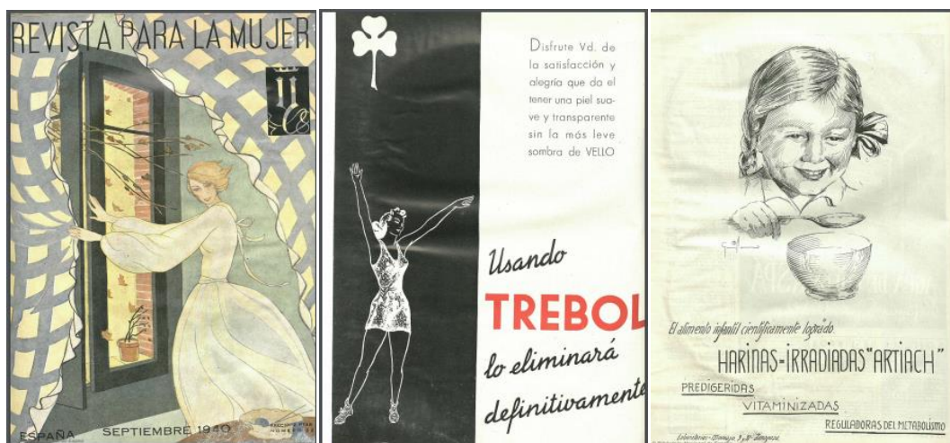
Figuras 23, 24 y 25: Portada e interior de la Revista Y (Madrid) , septiembre de 1940.

Aquí podemos ver una muestra de la portada de la revista para mujeres Y (Madrid) del número de septiembre de 1940 (figura 23), es decir, reciente al final de la guerra. En ella podemos ver una mujer que mira por la ventana, lo que nos indica que está en el interior de un hogar, es decir, una vez más se pone de manifiesto cual es el lugar que han de ocupar las mujeres. Asimismo, en el interior de este mismo número podemos ver los siguientes anuncios (figuras 24 y 25) en los que se publicitan productos, por un lado, relacionados con la feminidad y la necesidad de mantenerse perfectas para el hombre, y por otro, con el cuidado de los hijos.