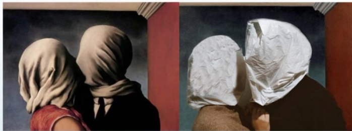
Los amantes, René Magritte