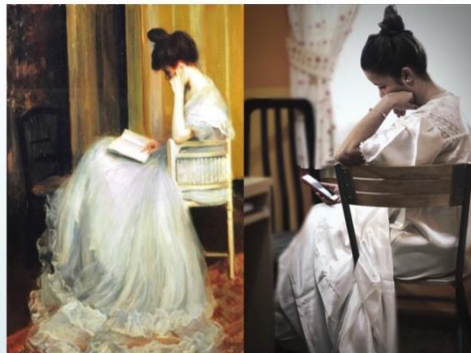
Mujer leyendo , Jacques Emile Blanche