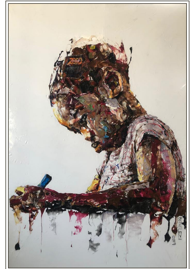
Buthelezi, Mbongeni (2019). Serie ...and full of hope . Cita visual.