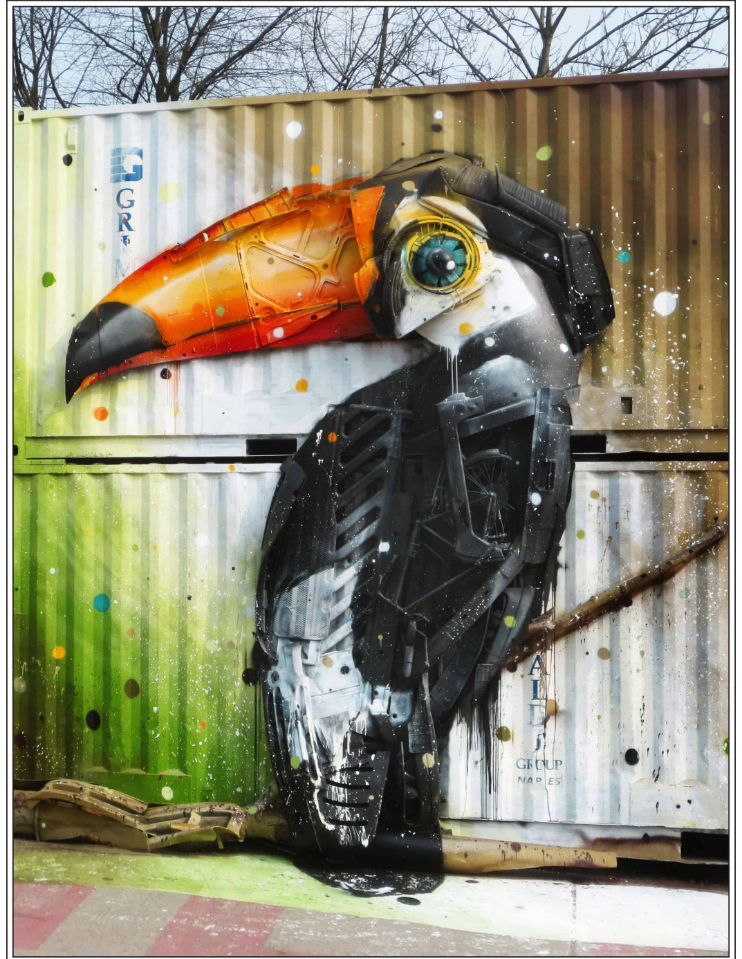
Bordalo II (2015). Froehlicher Tucan . Cita visual.

Potser aconseguim valorar un poc més aquests objectes que de vegades llancem al fem quan encara poden ser reutilitzats, amb un poc d'imaginació i ganes.