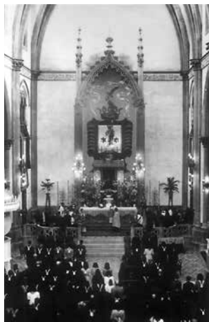
Antic altar dels frares.