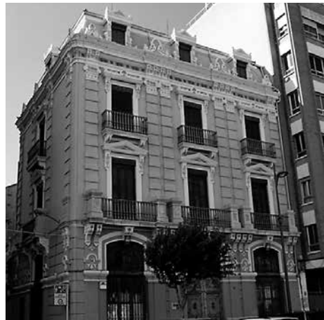
Casa de Bernabé Peris.