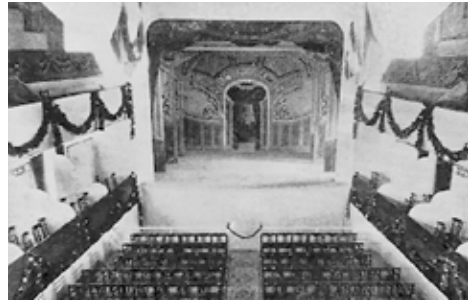
Sala d'Actes Xiquet Jesús de Praga.