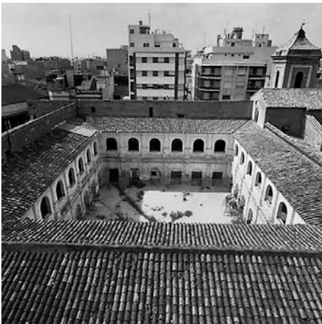
Exconvent de la Mercè.