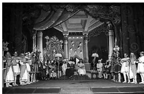
Betlem del Pare Alberto.