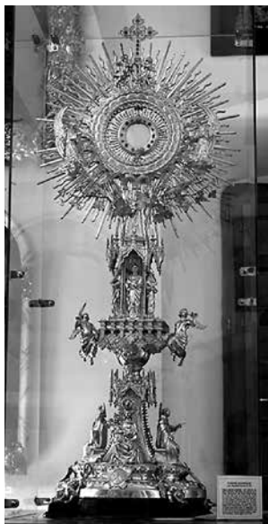
Custòdia dels frares Carmelites.