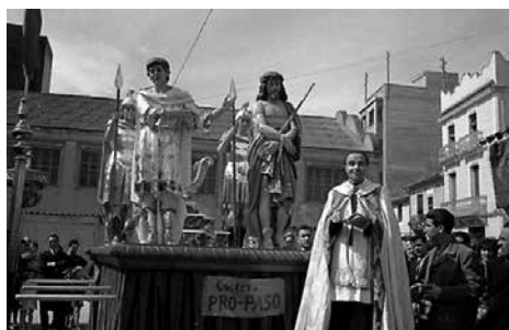
Benedicció del nou pas de l'Ecce homo a les Dominiques.