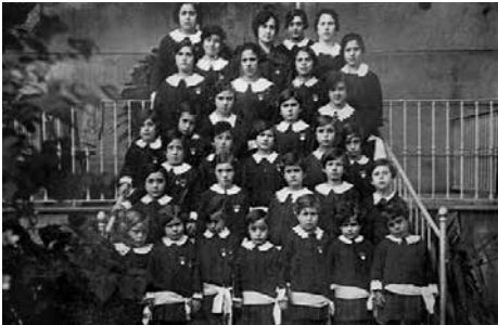
Col·legi Dominiques 1930.