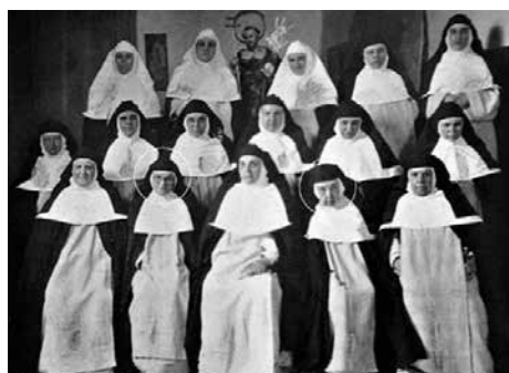
Monges Dominiques 1936.