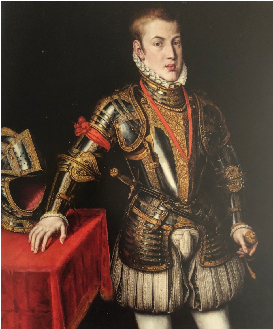
Fig. 6. Jooris van der Straeten (Jorge de la Rúa). El príncipe don Carlos de Austria , c. 1562, óleo sobre lienzo, 98,5 x 85 cm. Colecciones Reales, Patrimonio Nacional, inv. 00612065. Madrid, Monasterio de las Descalzas Reales.

Desgraciadamente, no tenemos datos que nos permitan conocer el valor de su tasación, pero dadas las guarniciones empleadas, estas debieron alcanzar altas cifras en la consabida almoneda del duque. Su fabricación con técnicas de ataujía, damasquinado, pavonados, dorados a fuego, todas sobre labores previas de forjado y cincelado, las convertían en auténticas piezas de lujo.