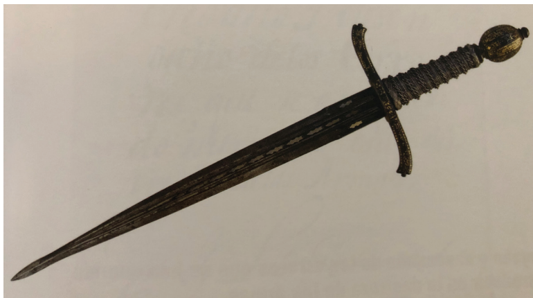
Fig. 3. Anónimo, Península Ibérica. Daga de mano izquierda , siglo XVI, forjado, fundido, damasquinado, plata, oro, acero, madera e hilo de plata, inv. CE22246. Madrid, Museo Nacional de Artes Decorativas.

Las dagas también están presentes y suponemos que no son las armas de parada, sino las llamadas dagas de mano izquierda, es decir, el resultado de la evolución de la esgrima con la espada. Usadas para el duelo a la española, están compuestas por un guardamanos triangular, a manera de vela, con decoración calada o grabada. Su número en el inventario es numeroso, a veces a juego con las espadas (fig. 3).