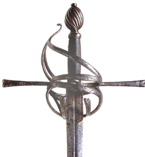
Fig. 5. Anónimo. Espada de lazo de tipo civil , 1550-1570, madera, acero forjado, fundido, pulido y troquelado. Toledo, Museo del Ejército.

dedo índice. Con posterioridad surgen los pitones y los puentes. El inventario del duque nos describe una con puentes: «otra espada con su guarnición llana negra de dos puentes e su bayna sobre bayna de cuero negro de bayeta con cuchillo y punçon». 57 En este modelo se unían los extremos de los pitones que enlazaban a otro que surgía de los brazos del arriaz, formando así el puente. El lazo fue la evolución natural hacia el modelo de empuñadura que los investigadores consideran típicamente español 58 (fig. 5).