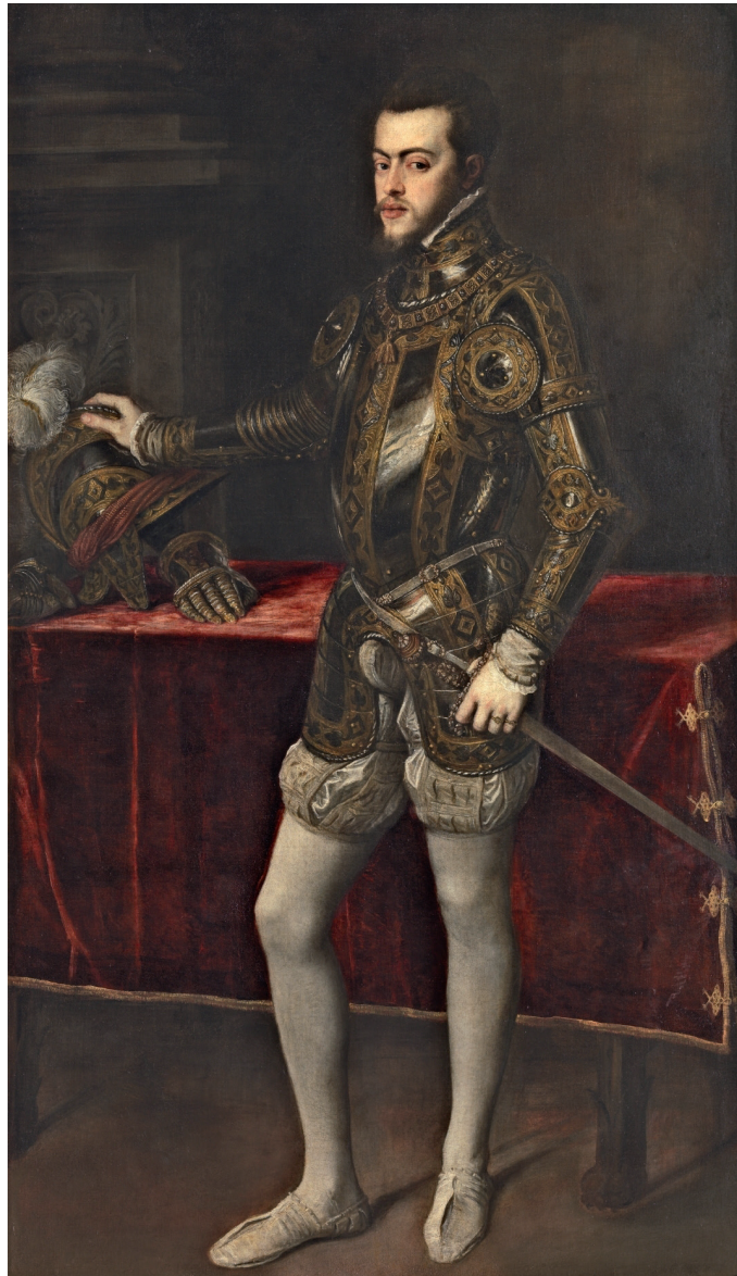
Fig. 2. Tiziano. Felipe II , 1551, óleo sobre lienzo, 193 x 111 cm. Madrid, Museo Nacional del Prado.

El objetivo que persigue este trabajo no es otro que el de estudiar la colección de armas blancas que reunió don Juan de la Cerda, IV duque de Medinaceli. Para ello nos basaremos en la información inédita que se refleja en su inventario post mortem protocolizado en Madrid, en 1575. 15 En él se asienta