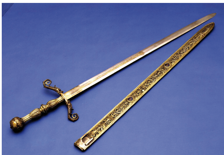
Fig. 1. Giacomo Magnolino. Espada y vaina del Conde de Tendilla , 1493. Espada: altura 140,50 cm, anchura 31,50 cm. Vaina: altura 113,50 cm, anchura 6,20 cm. Museo Lázaro Galdiano de Madrid.

armas tenían un valor históricamente implícito y fueron objeto de valiosos obsequios diplomáticos. 4 Es de sobra conocido el regalo del estoque bendito con el que el papa Inocencio VIII honró al conde de Tendilla, Íñigo López de Mendoza 5 (fig. 1).