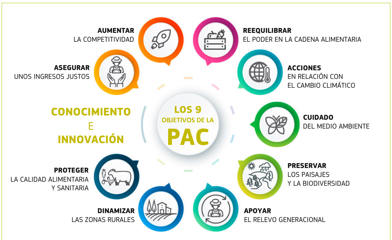
Gráfico 1: Los nueve objetivos propuestos para la PAC 2021-2027

el gráfico 1) a los que los EM deben demostrar que contribuyen de manera coherente mediante las actividades que proponen financiar de ambos pilares de la PAC. Estos se establecerán en los nuevos planes estratégicos de la PAC, ampliando la forma de apoyo de la programación para el desarrollo rural al pilar I por primera vez. Estas actividades deben encajar dentro de una serie de intervenciones tipo. Dentro de este marco, los Estados miembros tendrán mucha más libertad para decidir los detalles de qué se financiará exactamente y dónde. El desempeño de estos objetivos se evaluará mediante una serie de indicadores, que se basan en la experiencia del actual Marco Común de Seguimiento y Evaluación (MCSE). Es importante destacar que estos planes deben mostrar una mayor ambición con respecto a los objetivos medioambientales y relacionados con el clima en comparación con la situación actual.