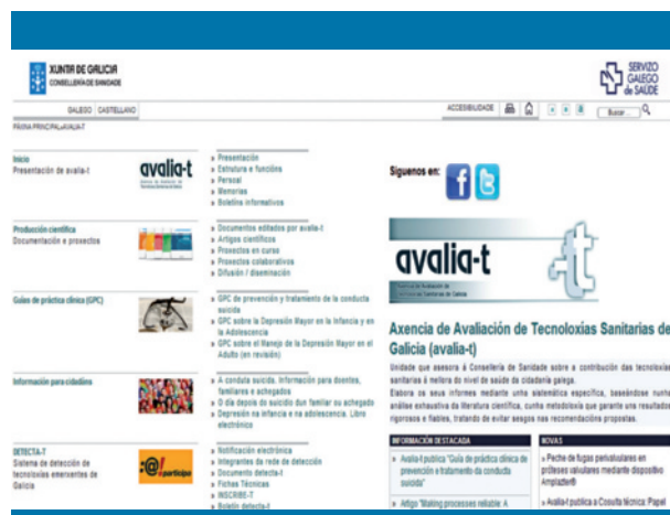
Figura 6. Página web de la Axencia de Avaliación de Tecnoloxías Sanitarias (Galicia)