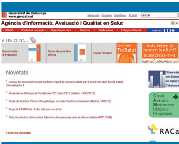
Figura 2. Página web de la Agència d'Informació, Avaluació i Qualitat en Salut (Cataluña)

carencias de información imprescindible para decidir sobre la inclusión de una tecnología sanitaria en la cartera de servicios del Sistema Nacional de Salud. Otra área importante de esta agencia es la promoción de la investigación evaluativa.