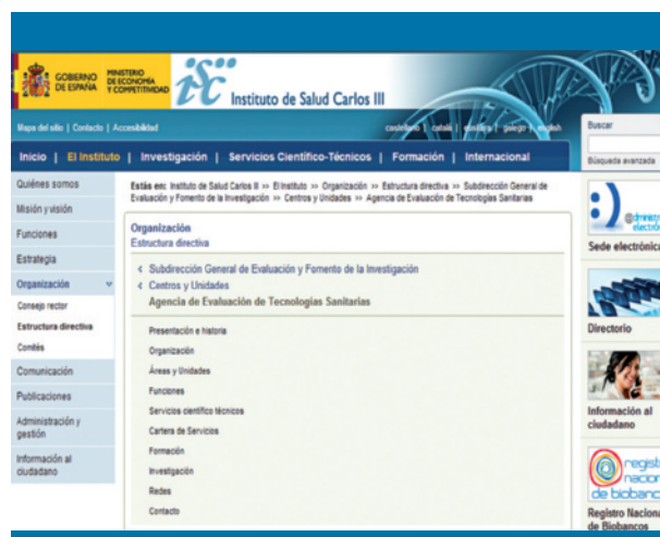
Figura 1. Página web de la Agencia de Evaluación de Tecnología Sanitaria (ISCIII)

Hay que señalar que la labor de las AETS ha sido ingente en todo este tiempo. El número de IAETS de las agencias españolas