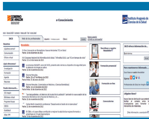
Figura 8. Página web del Instituto Aragonés de Ciencias de la Salud (Aragón)

El INAHTA agrupa la mayoría de agencias del mundo, entre ellas las españolas (las 8 citadas previamente). La cooperación y coordinación se ha constituido en la característica esencial del trabajo de las