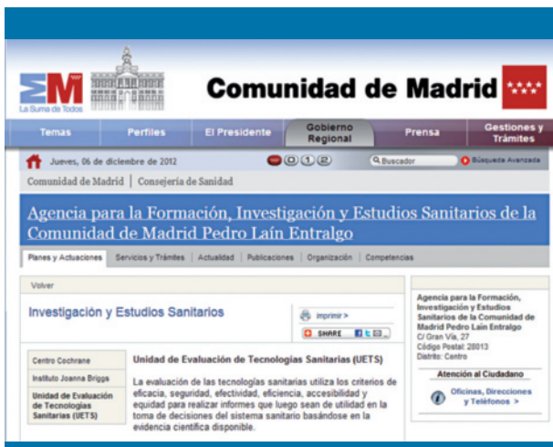
Figura 7. Página web de la Agencia para la Formación, Investigación y Estudios Sanitarios de la Comunidad de Madrid «Pedro Laín Entralgo» (Madrid)