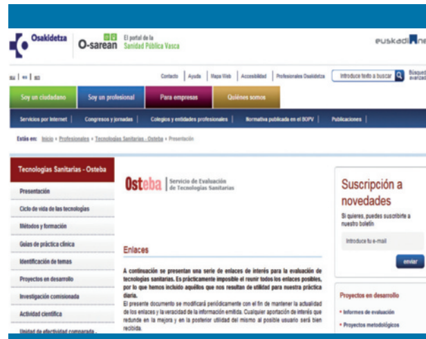
Figura 3. Página web de OSTEBA (País Vasco)

Igualmente, OSTEBA imparte seminarios y cursos específicos en respuesta a peticiones formales por parte de los colectivos sanitarios. Por último, cabe mencionar que esta agencia lleva a cabo proyectos de análisis de la evidencia científica y lectura crítica; en este sentido, ha creado fichas de lectura crítica, que son instrumentos que permiten extraer los datos de interés de los estudios, de manera que posteriormente se facilite la evaluación de su calidad.