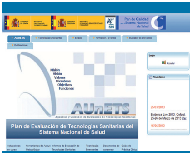
Figura 9. Página web de las Agencias y Unidades de Evaluación de Tecnologías Sanitarias (AUnETS)