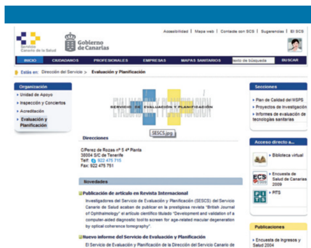
Figura 4. Página web del Servicio de Evaluación del Servicio Canario de Salud (Islas Canarias)

nómico ni el organizativo. También con el objetivo de agilizar los trámites, pone a disposición del público un servicio de consultas técnicas de respuesta rápida. Dedicada especial atención a la formación, y tiene un plan de formación interno de la agencia. Una de las particularidades más destacables de la agencia es el «Boletín NETS», en el que se recogen noticias relacionadas con la ETS, informes de otras agencias, bibliografía comentada, novedades bibliográficas, convocatorias, opinión y tratamiento monográfico de temas de interés. Por último, cabe mencionar su labor en la creación de documentos de consenso.