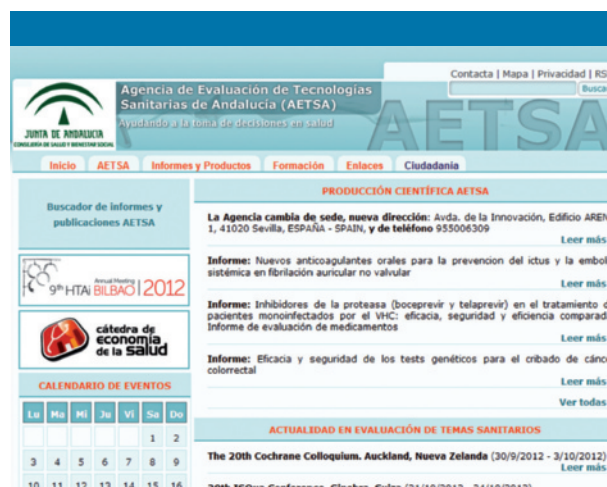
Figura 5. Página web de la Agencia de Evaluación de Tecnología Sanitaria (Andalucía)