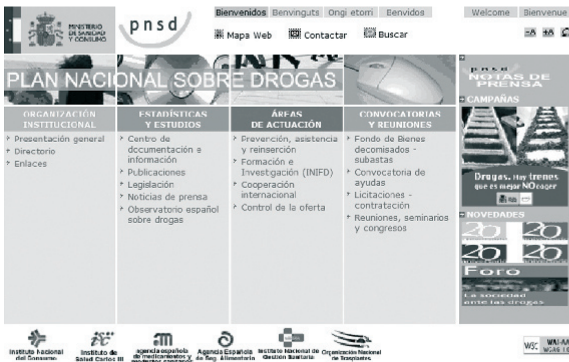
Tabla 2. Instituciones públicas, privadas, colegios profesionales y sociedades científicas de interés en relación con el Abuso de Sustancias.