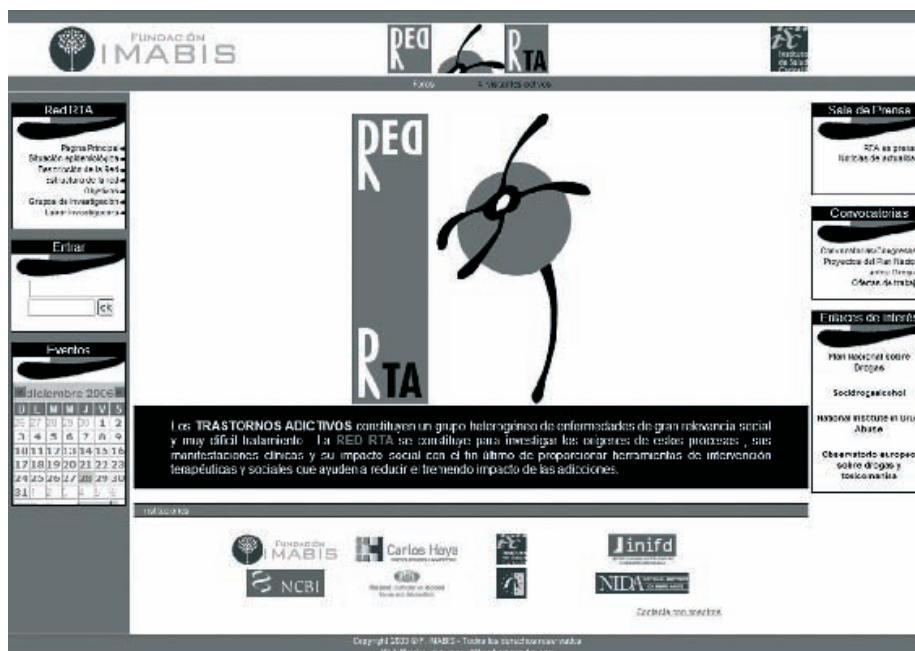
Figura 7. Página principal de la web de la Red de Trastornos Adictivos (RTA).

A lo largo de su período de funcionamiento, la Red RTA ha promovido sinergias que han posibilitado el fomento la investigación cooperativa entre centros y el desarrollo de nuevas líneas de investigación, cuyos resultados se han plasmado en numerosos documentos difundidos a través de publicaciones científicas nacionales e internacionales 31 .