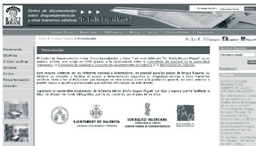
Figura 5. Página principal del sitio web del Centro de Documentación sobre Drogodependencias y Otros Trastornos Adictivos Dr. Emilio Bogani Miquel.