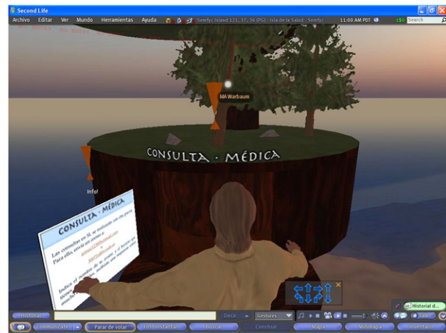
Figura 2 Imagen de la consulta médica en Second Life de la Sociedad Española de Medicina de Familia.

colectiva que ha generado la Web 2.0, la inteligencia artificial y la gestión del conocimiento de una forma eficiente. Además, será posible obtener y compartir esta información desde diferentes dispositivos además de los ordenadores, como los móviles y los asistentes digitales personales.