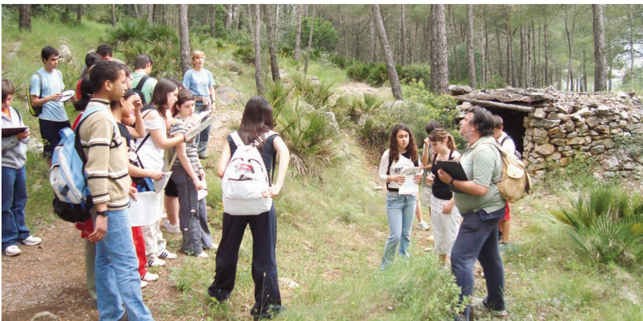
Sortida amb el Departament de Ciències a la Serra d'Irta. An