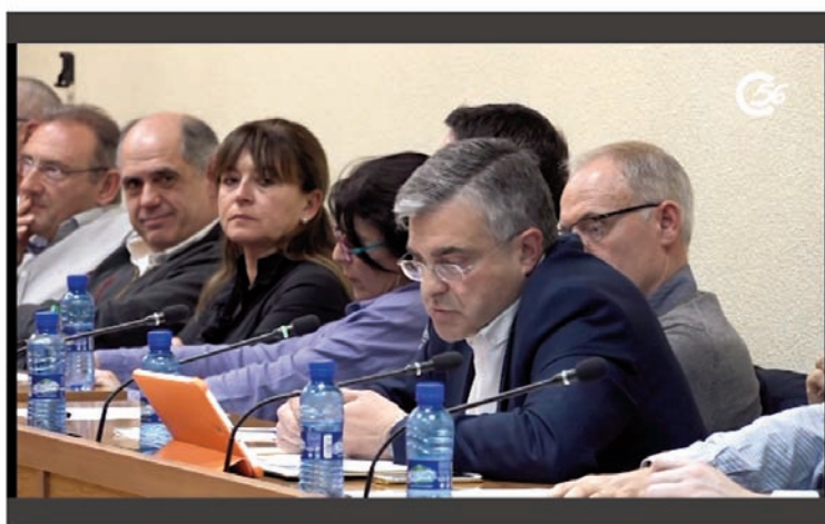
Benicarló; sessió extraordinària del Ple de l'Ajuntament 28/03/2018