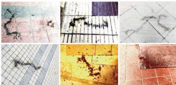
COMPOSICIÓN ARTÍSTICA EN HOMENAJE A LOS CAÑELES, ENERGUÉMENOS Y DESCEBRADOS QUE CIRCULAN POR LAS CALLES ENJUAGANDO NUESTRAS TRADICIONES