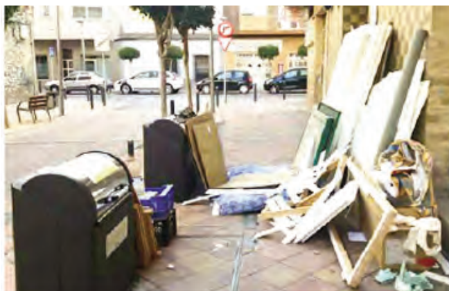
Incivisme sense control

Panissola : als porcs que continuen pensant-se que el voltant dels contenidors de la brossa, plàstic, vidre i cartró, són la seua porquera particular. Ja n'hi prou de deixar les escombraries fora dels contenidors, de no respectar els horaris i, sobretot, de llançar allí voluminosos com matalassos, mobles, vàters, .... A banda de la pèssima imatge que donem, damunt, és completament insalubre. No entenem per quina raó no s'actua de forma contundent contra aquest incivisme.