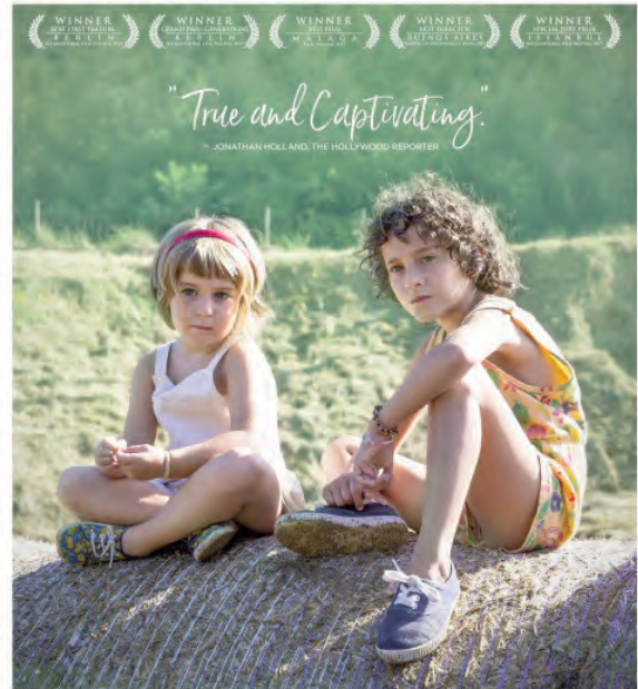
SPAIN'S OFFICIAL SUBMISSION FOR FOREIGN LANGUAGE FILM COMPETITION FOR THE 90TH ACADEMY AWARDS

“Cuando leemos una historia la habitamos. A ella más que nada en el mundo le encantaba el