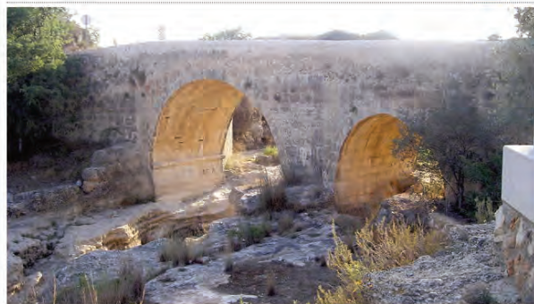
Pont del Olivari sobre el riu Cenia.