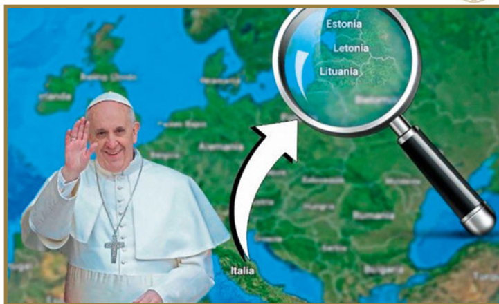
Viaje del Papa a los Países Bálticos.

Soy consciente del esfuerzo y del trabajo que se realiza en distintas partes del mundo para garantizar y generar las mediaciones necesarias que den seguridad y protejan la integridad de niños y adultos en estado de vul-