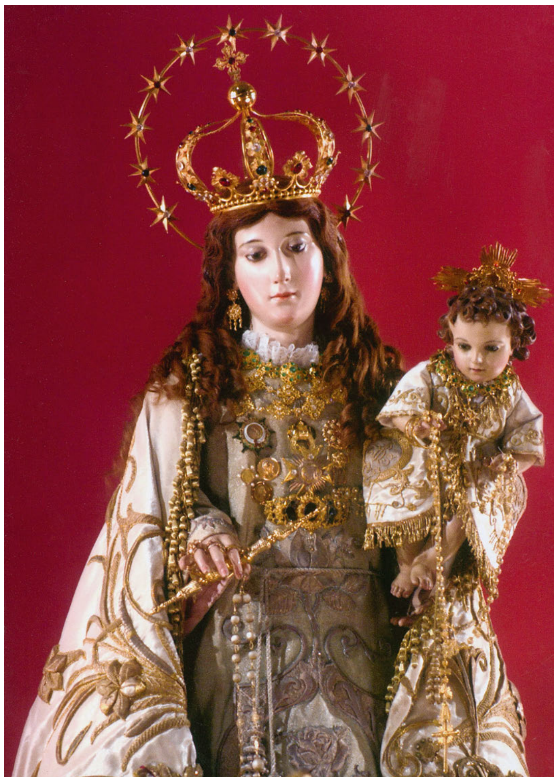
Ntra. Sra. La Virgen del Rosario, imagen titular de la Asociación de Hijas de María del Rosario de Vila-real.