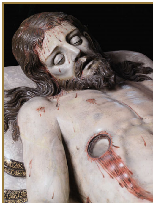
Cristo Yacente. Pedro de Ávila. Madera policromada 1720-1729. Cofradía de Nuestro Padre Jesús Nazareno. Valladolid.