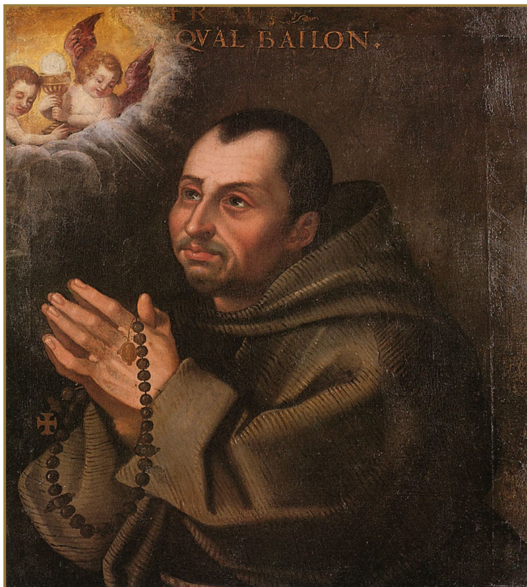
SAN PASCUAL BAYLÓN, lienzo 70x65 cm. Anónimo siglo XVII, Parroquia Santa María La Blanca, Torrehermosa (Zaragoza).

autores los consideran formando parte de clase dirigente española.