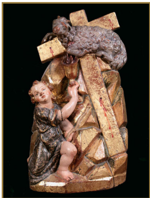
Ángel recogiendo la sangre del Cordero, Juan Sanz (escultura) y Juan Urarte (policromía), 1607. Iglesia de Santa María de Calatañazor. Almazán (Soria).