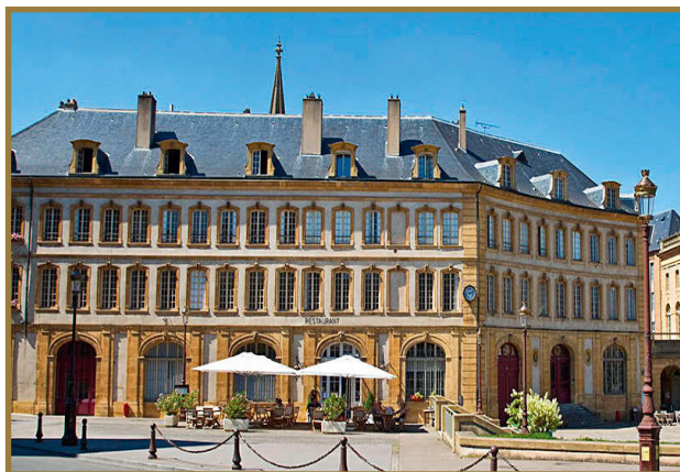
Plaza de las Armas de Metz