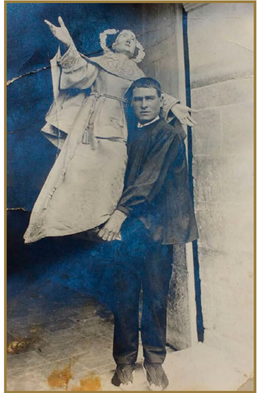
Antigua imagen procesional de San Pascual para ser colocada en sus andas, antes de 1936.

“Entre mis recuerdos vivenciales, me vienen estos días a la memoria las sobremesas de después de cenar en casa, cuando sólo se escuchaba a las diez de la noche las noticias de Radio Nacional, lo que hoy llamamos “telediario”; en aquellas horas pacíficas mi padre me contaba lo que para él había sido una guerra cruenta y dura, así como para muchas familias.