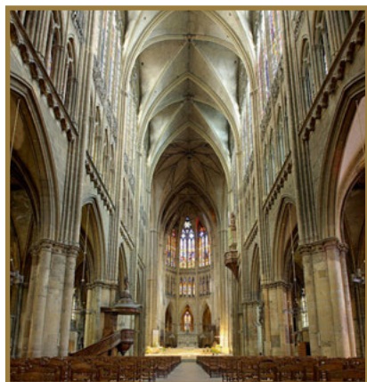
Interior Catedral de San Esteban.