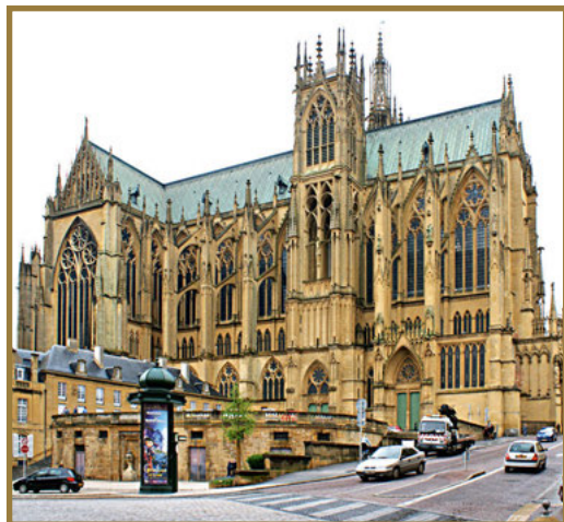
Catedral de San Esteban.