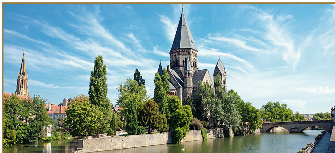
Vista sobre el puente medieval del templo nuevo rodeado por el río Mosela.