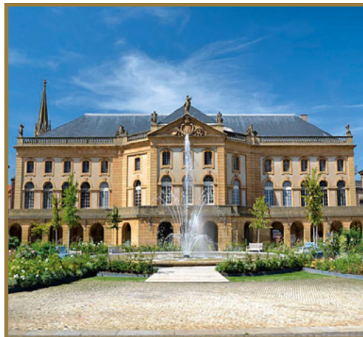
Opera de Metz.