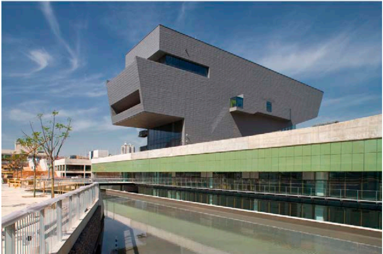
Edifici Disseny Hub Barcelona. Museu del Disseny.