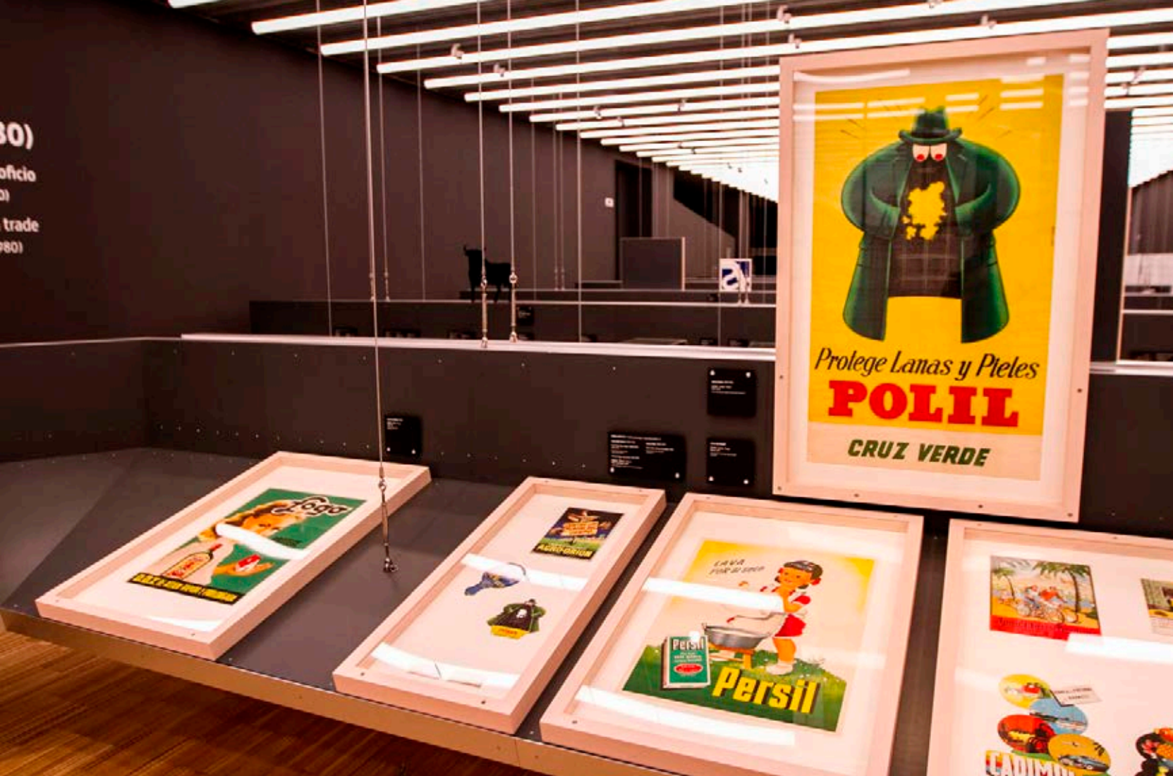
Exposició Disseny Gràfic. Museu del Disseny.