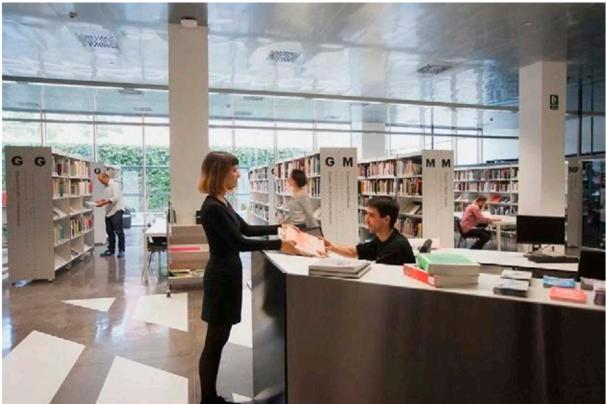
Centre Documentació. Museu del Disseny. Fotografia: Xavier Padrós