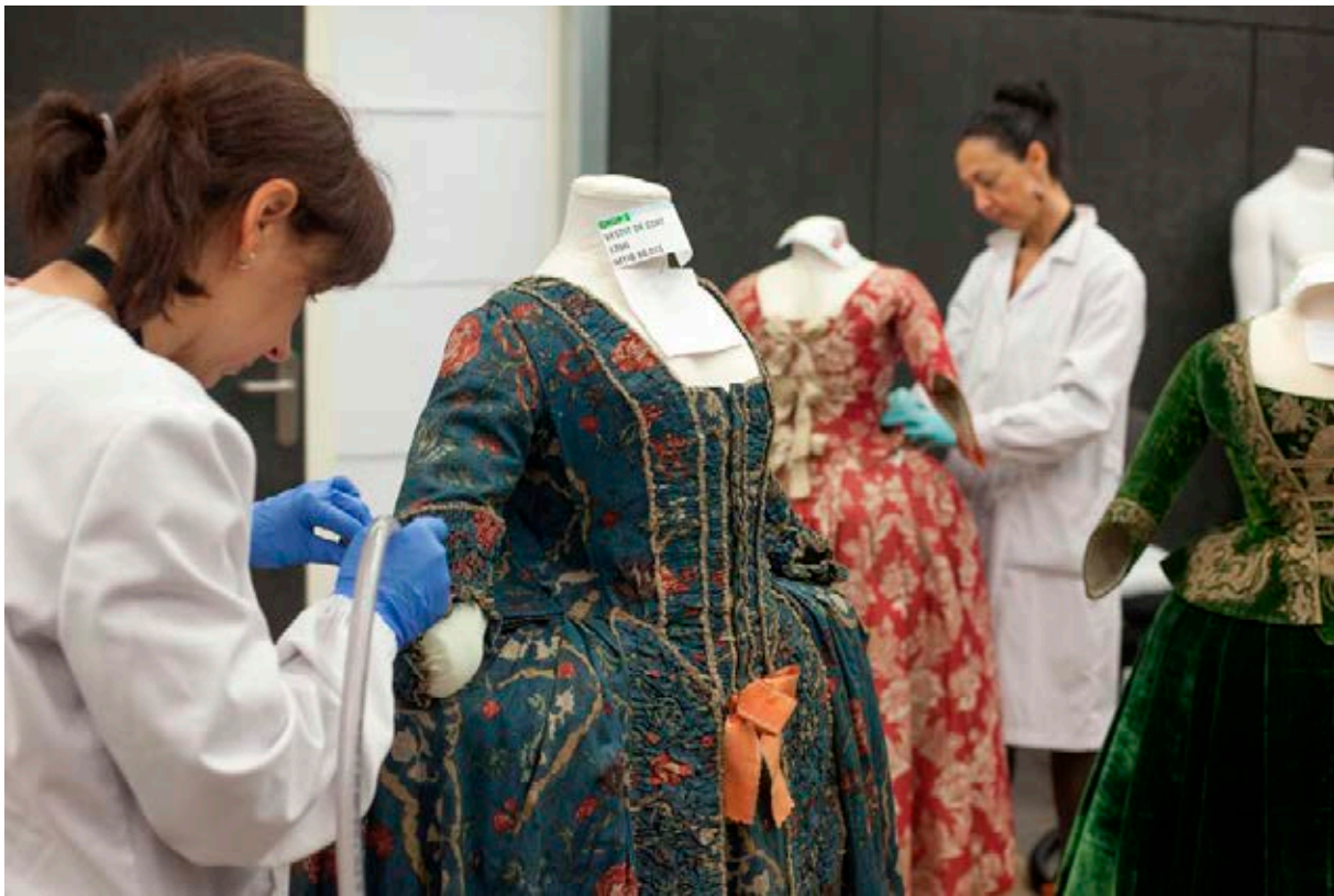
Tasques conservació. Museu del Disseny.