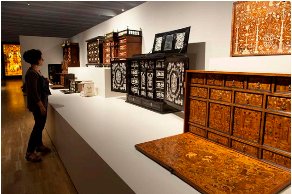
Exposició Extraordinàries. Museu del Disseny.

A més de la seva funció com a biblioteca i arxiu complementari de les col·leccions objectuals, el Centre de Documentació és també un espai on tenen lloc diverses activitats pròpies o relacionades amb el Museu, com alguns màsters, jornades, tallers, etc., sovint impulsades des del mateix Centre, i alhora ofereix una sèrie de serveis presencials i online , especialment de temes relacionats amb el disseny, amb la voluntat sobretot de servir als professionals dels diversos sectors relacionats.