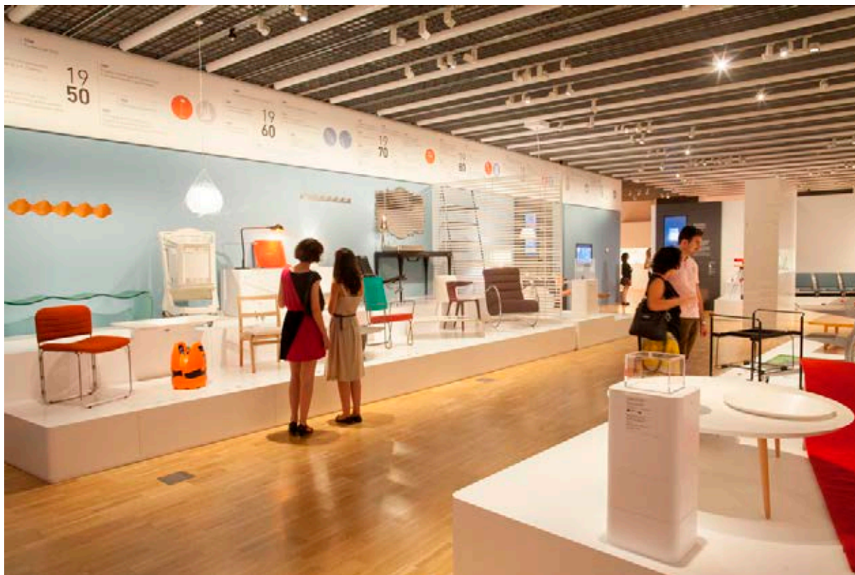
Exposició Del món al museu. Museu del Disseny.

gratuïta i defensaren el valor de l'estandardització i el compromís ètic del disseny, donant pas al naixement del disseny industrial. Alhora, també en el primer quart del segle XX, algunes arts decoratives començaren a gaudir d'una consideració equiparable a les belles arts. L' Art Nouveau hi va contribuir, sens dubte, i des d'aleshores el procés havia de ser imparable.