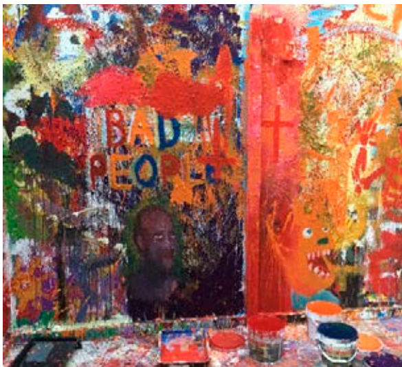
En la estancia de Allan Kaprow.

Mucho que ver, por supuesto, con el antimétodo literario de los dadaístas. Un antimétodo que potencia el azar, llevado al extremo con el tercero de los artistas que por ahora ocupa el espacio: Allan Kaprow. Como si se tratase de una espiral, la obra de este artista remite a la de John Cage, pues para él fue definitiva su asistencia a los cursos de música experimental impartidos por aquél en la New School for Social Research de Nueva York entre 1956 y 1958. En Casa Morra nos