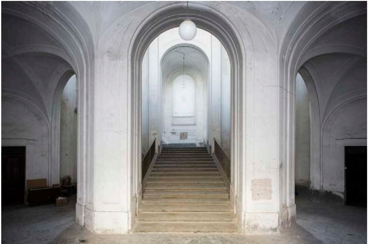
Casa Morra – Archivio d'Arte Contemporanea, 2016. Escalera. Nápoles.