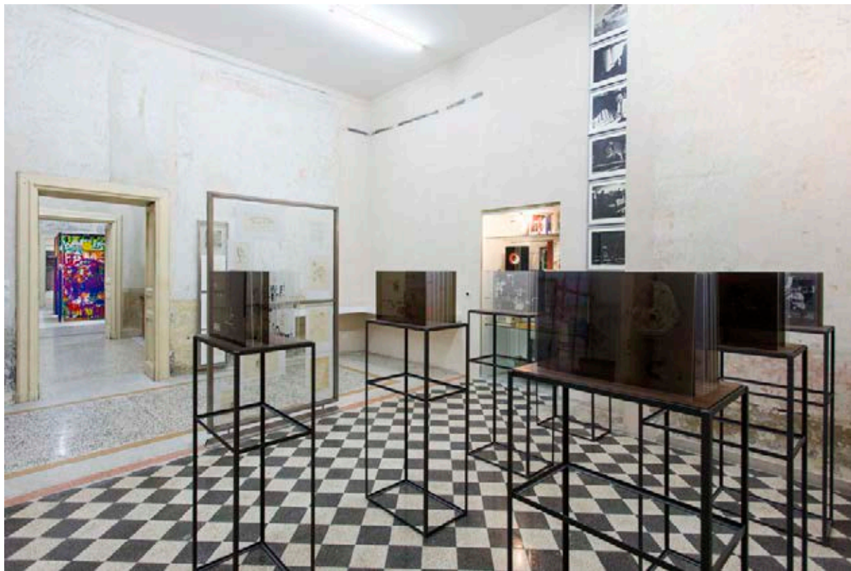
John Cage - Marcel Duchamp - Allan Kaprow, 2016, vista de la instalación, Casa Morra - Archivio d'Arte Contemporanea, Nápoles.