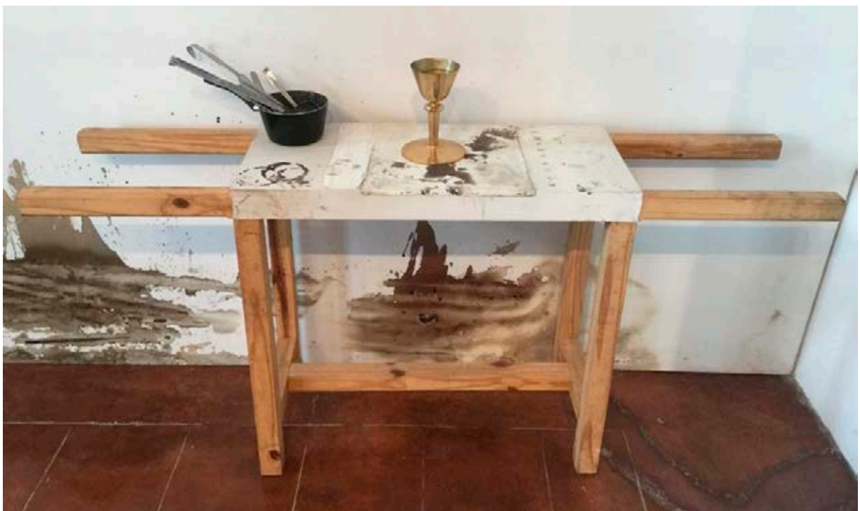
Hermann Nitsch, Arena. Opere dall'opera, 2016-2018, Museo Nitsch, Nápoles (detalle).