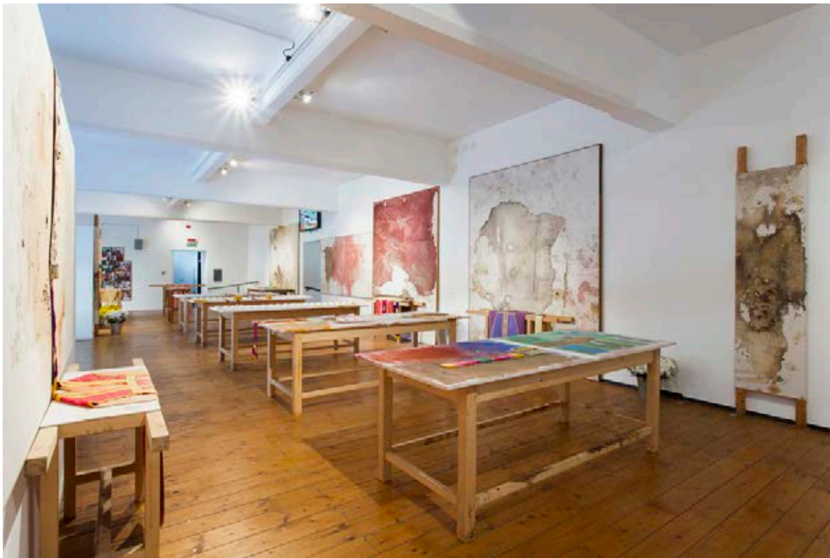
Hermann Nitsch, Arena. Opere dall'opera, 2016-2018, vista de la instalación. Museo Nitsch, Nápoles.