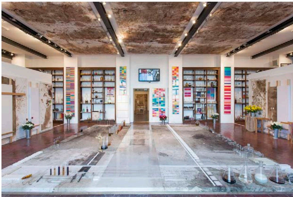
Hermann Nitsch, Arena. Opere dall'opera, 2016-2018, vista de la instalación. Museo Nitsch, Nápoles.