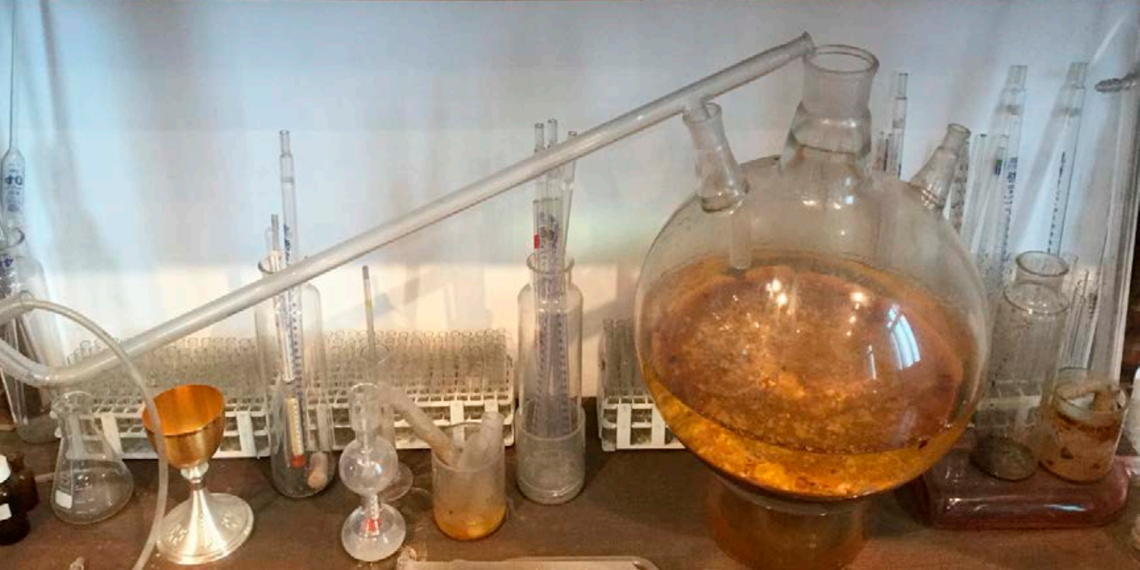
Hermann Nitsch, instalación permanente, 2008, Museo Nitsch, Nápoles (detalle). © Fondazione Morra.

en el teatro de Orgías y Misterios, que parte con la idea romántica del arte total. La música tiene también su protagonismo, pues los sonidos forman parte del todo del artista, que, desde su vertiente dinonisiaca, podemos unir a nuestro músico Carles Santos.