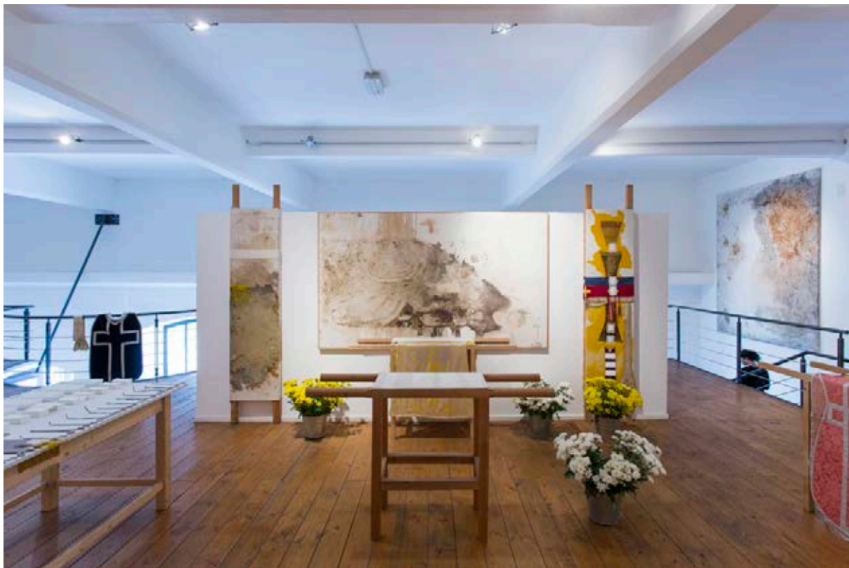
Hermann Nitsch, Arena. Opere dall'opera, 2016-2018, Museo Nitsch, Nápoles. Detalle de la instalación.

de objetos se repite en las instalaciones que, sobre mesas alargadas o especie de caballetes, se distribuyen en el espacio remitiéndonos a las diversas acciones del artista. Me recuerdan, en su concepto, al maestro de la Bauhaus Johannes Itten y su exploración de los contrarios. Nitsch opone la frialdad del vidrio y el metal con las telas coloridas de casullas o estolas. O el metal de tijeras y pinzas con la ductilidad de la cera. Pero también, y sobre todo, enfrenta lo primario de las acciones (los momentos de desbordamiento y éxtasis y muerte) con el cuidadoso orden con el que expone los restos de sus acciones. También sus teorías del color (en el museo pueden verse parte de sus «escalas») están en consonancia con las de algunos maestros de la escuela alemana, como Kandinsky, y en general con la idea de las correspondencias, en las que los colores nos llevan a la idea de sonidos musicales, olores o sabores. Todo ello se funde