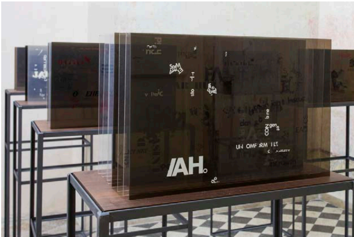
John Cage, Not wanting to say anything about Marcel (1969), 2016, Casa Morra – Archivio d'Arte Contemporanea, Nápoles.

algunas de las más bellas escaleras abiertas de la ciudad. Intervenciones posteriores eliminaron elementos barrocos y le dan al edificio un aire clásico, escenario imponente para este nuevo paso en la construcción de un Quatiere dell'Arte.