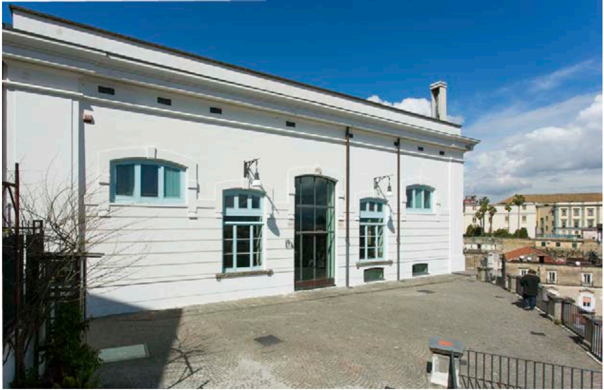
Museo Nitsch, vista exterior, Nápoles.