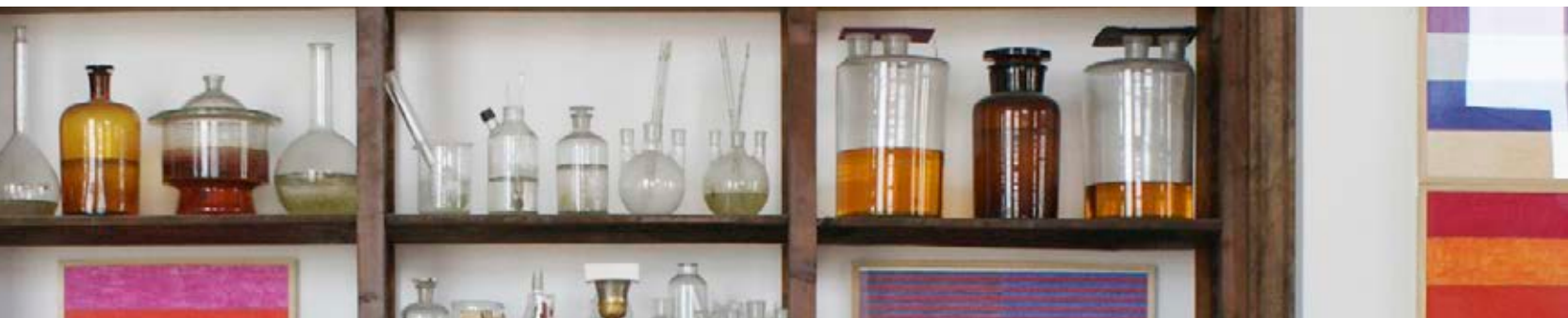
Hermann Nitsch, permanent installation, 2008, Museo Nitsch, Nápoles (detalle)

Recibido el 10 del 7 de 2017 Aceptado el 11 del 10 de 2017 BIBLID [2530-1330 (2017): 360-77]