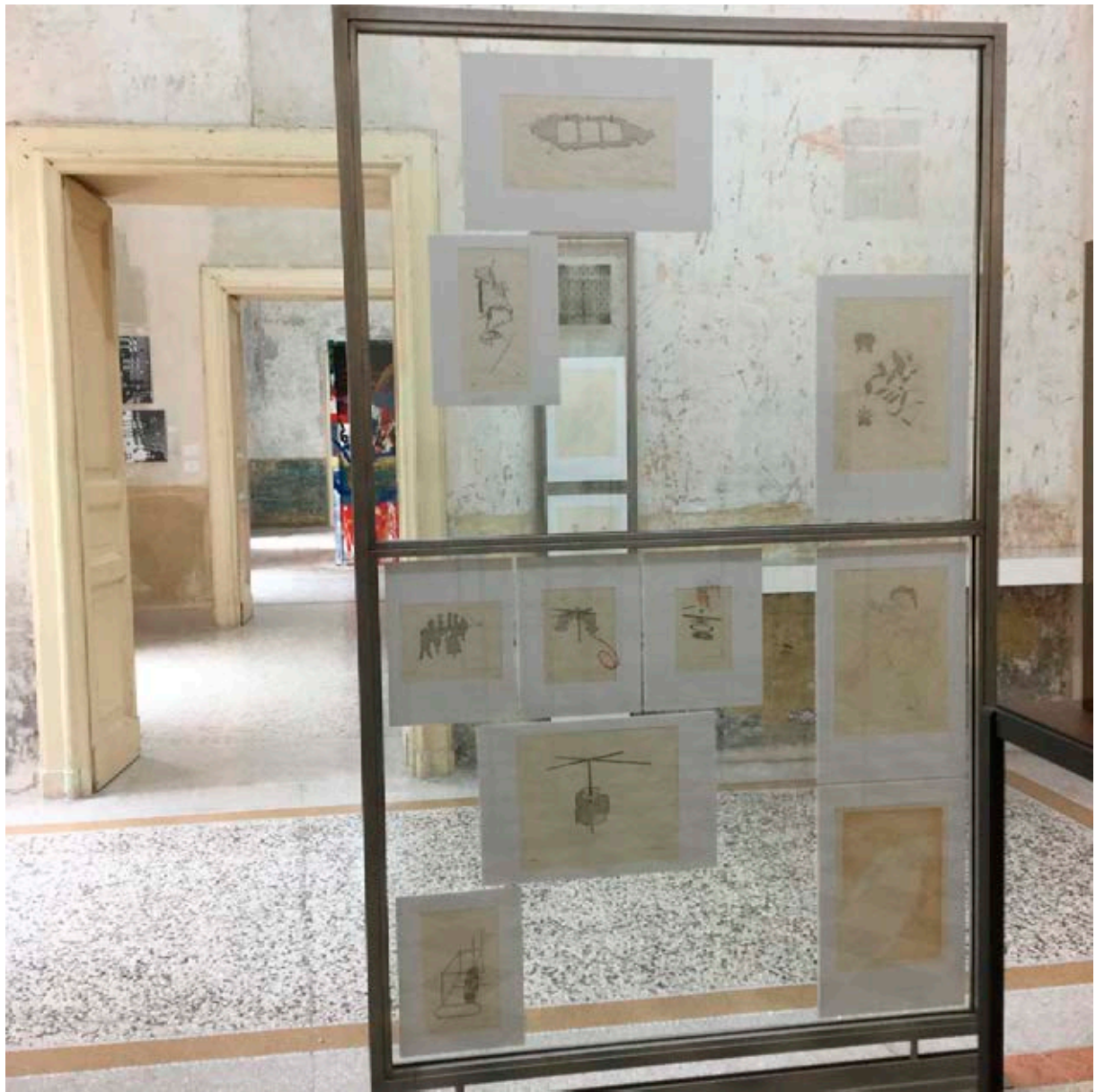
Marcel Duchamp, 2016, vista de la instalación, Casa Morra - Archivio d'Arte Contemporanea, Nápoles.

en los 4.200 metros cuadrados del inmueble, que progresivamente será reparado para poder contenerla. En el futuro, además de a los accionistas, sus estancias acogerán las obras de aquellos movimientos y creadores que de alguna manera tienen una relación con los presupuestos vitales de aquellos: Gutai, Fluxus, Living Theatre, experiencias de happening, poesía visual... todo lo que ha subyugado a Morra durante su ya larga etapa de mecenas y coleccionista.