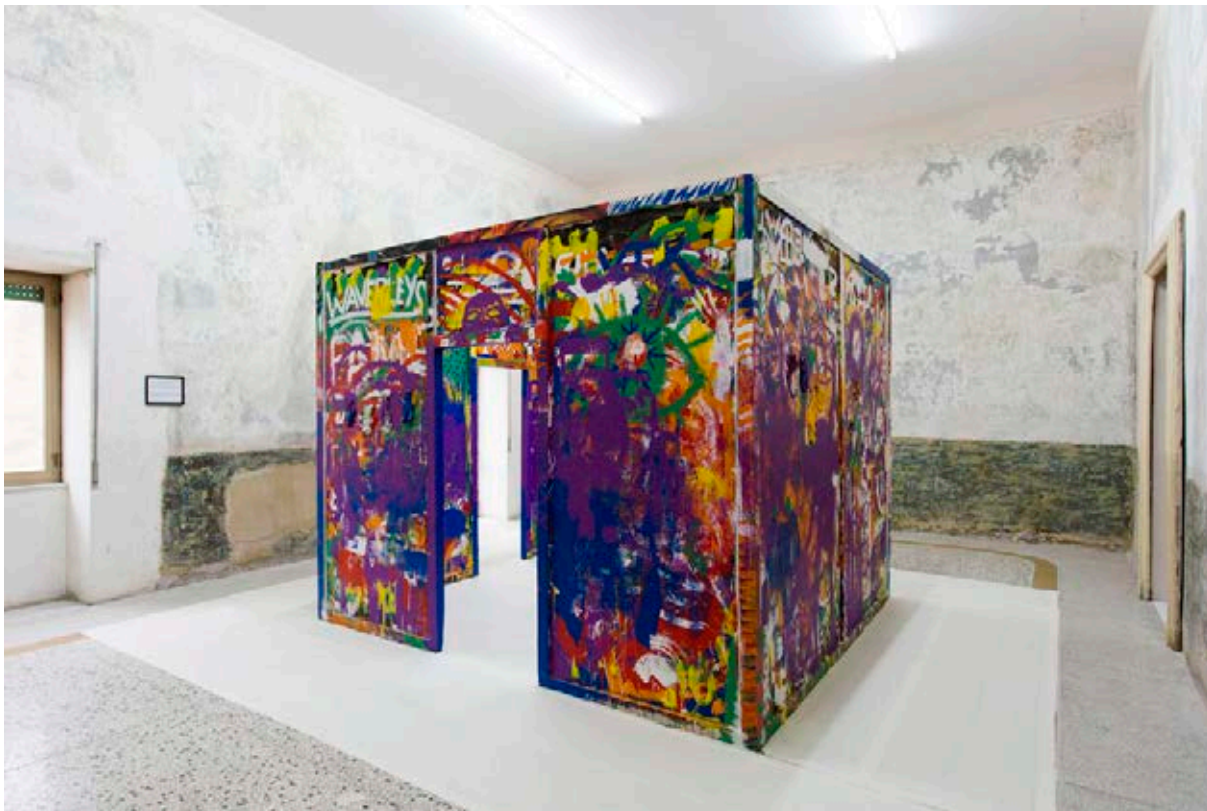
Allan Kaprow, Stockroom (1957-1964), 2016, Casa Morra - Archivio d'Arte Contemporanea, Nápoles.

la que se producirán encuentros y desencuentros, estímulos y frenos, hasta llegar –o no– al jardín de la casilla 63).