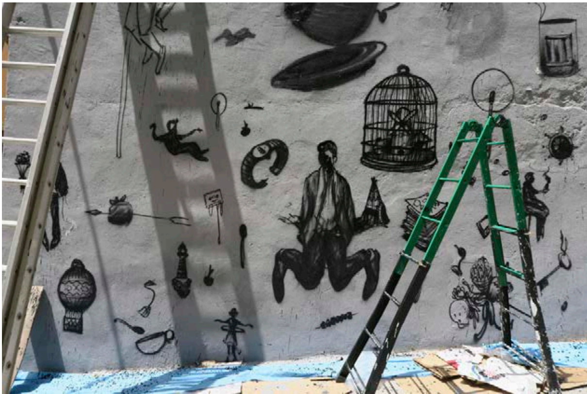
Obra de Gael en proceso, 2015.

turo, Cere con El laboratorio del doctor stencil , Btoy con La plantilla del stencil , Fotolateras con Enlatando Fanzaras , Lolo&Sabek con De la forma más absurda y Julian Arranz con Artesanos del blackbook ).