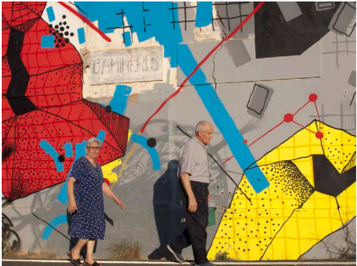
Paseando ante la obra de Sger, 2015.

El arte contemporáneo incide en el ser cultural, es decir en la suma de forma o acto y valor. El arte material no es arte si no tiene valor, y el valor es muy difícil de entender y apreciar si no tiene forma o acto que lo sustente. En realidad es lo que Santo Tomás de Aquino (1979: 220-240) llamaba quiddidad, esto es, la substancia de las cosas, lo que hace que algo sea, quod quid erat esse , aquello por lo que una cosa tiene que ser algo, aquello por lo que una cosa es arte. Al igual que en la filosofía,