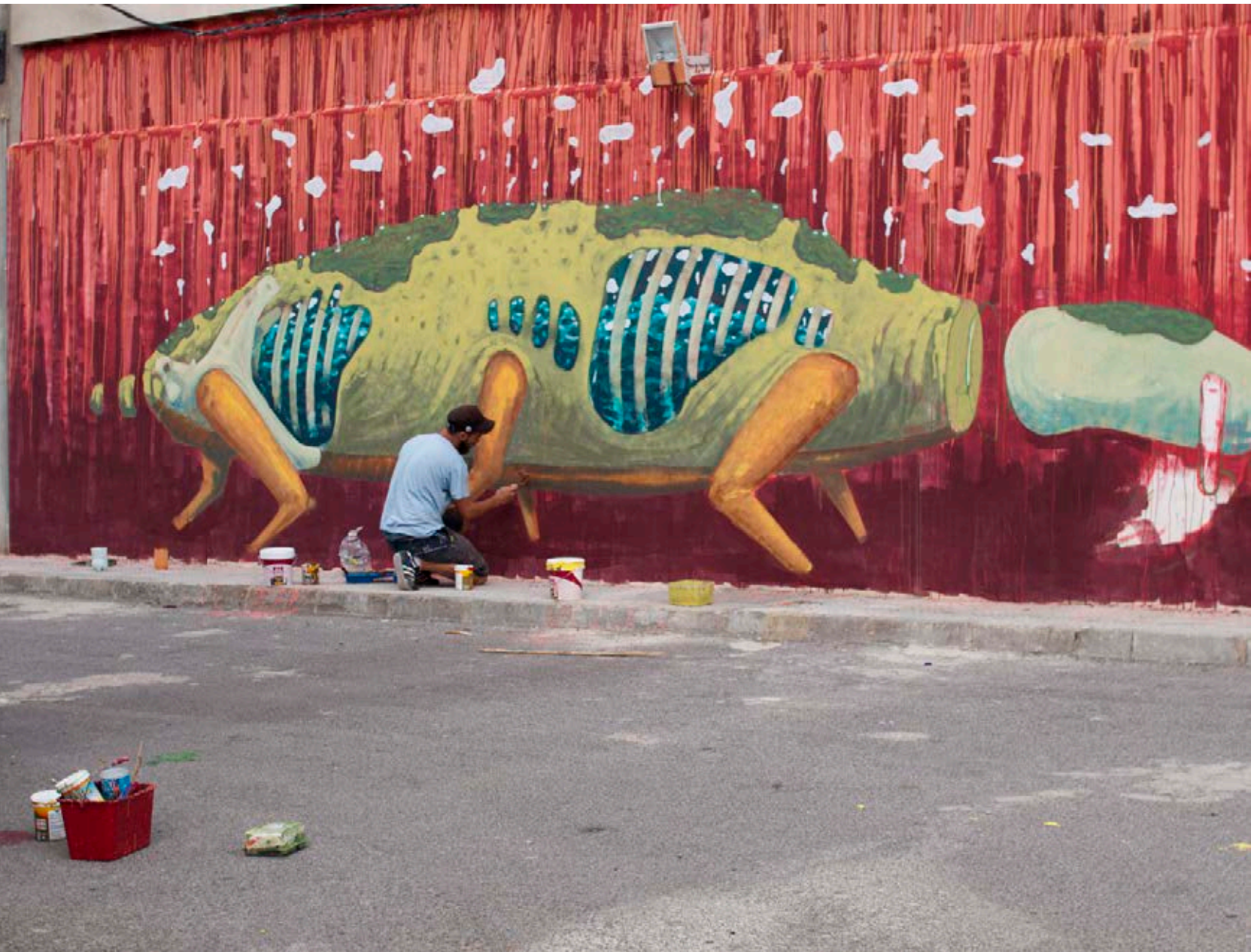
Chylo trabajando en el mural del salón de actos de Fanzara, 2014.