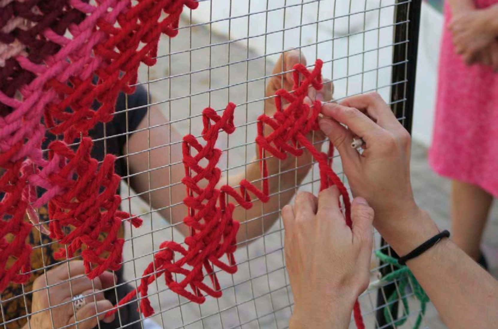
Arquicostura, 2016.