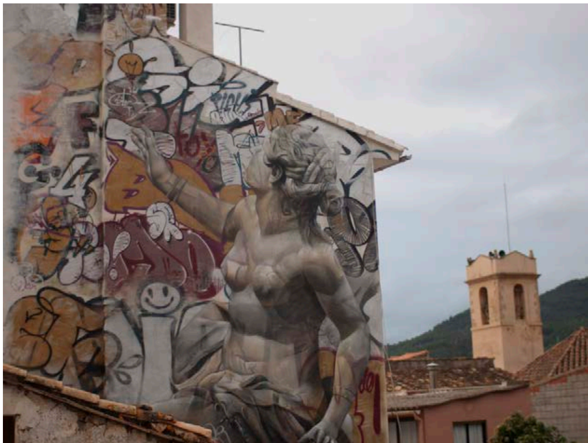
Pichi&Avo, 2016.

George Berkeley decía que las diversas sensaciones o valores que nos llegan por los sentidos no pueden existir más que en una mente que las perciba: «la mesa sobre la que escribo existe; es decir, la veo y la siento; y si yo estuviese fuera de mi escritorio diría que existe; entendiéndolo por ello que si yo estuviese en mi escritorio la podría percibir» (Berkeley, 1930: 431-440). No es posible que nada tenga una existencia fuera de las mentes o seres pensantes que las perciben. Las manifestaciones artísticas en tanto no son conocidas por