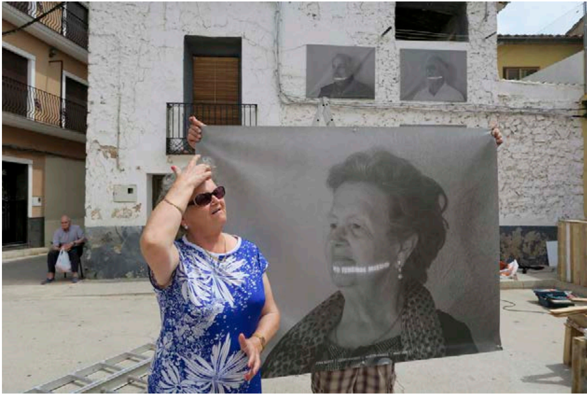
La modelo ante la obra de Martin Firrell, 2016.

que parecían asomar desde el lateral de una vivienda cercana a la zona escolar.