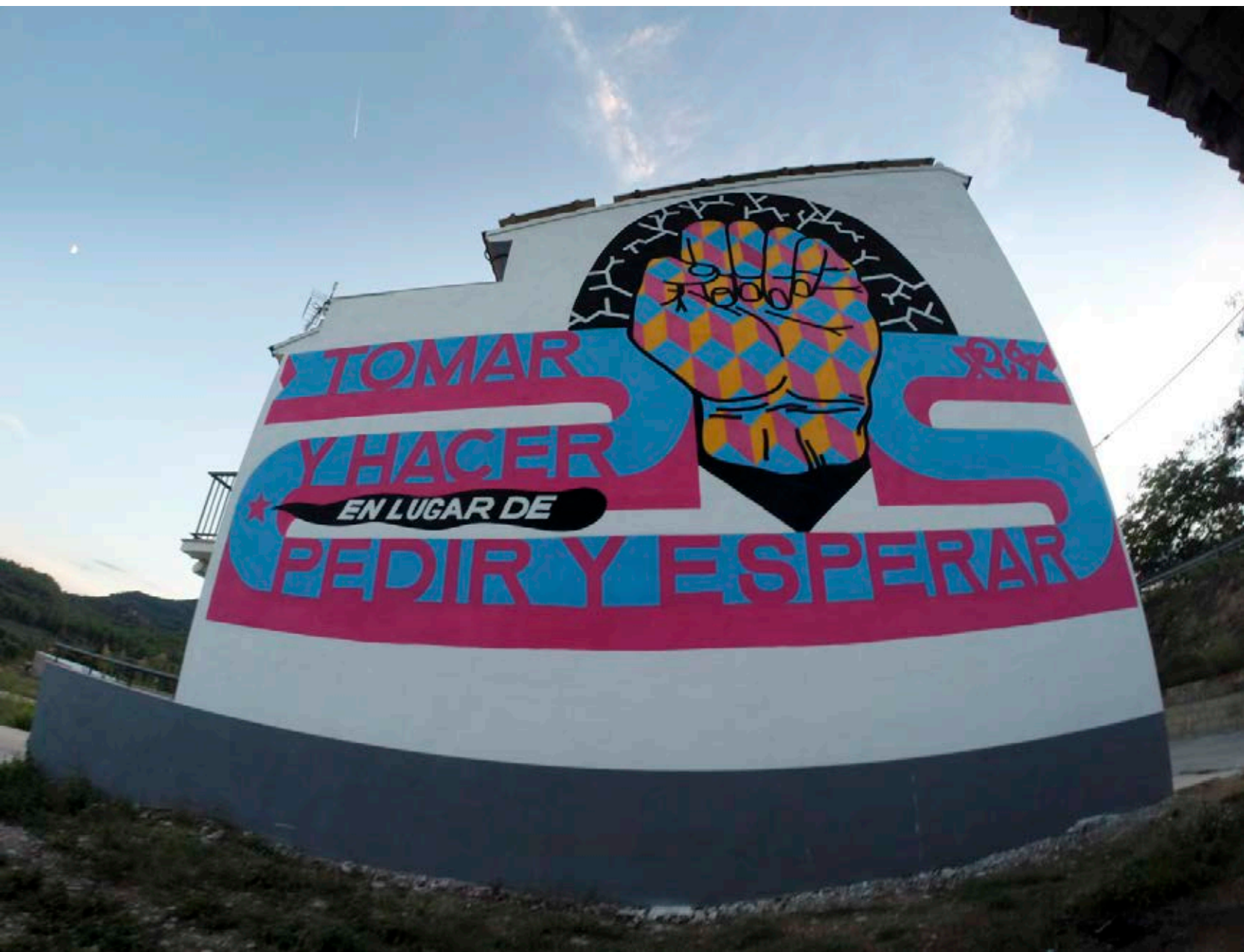
Mural de Ruina, 2015.