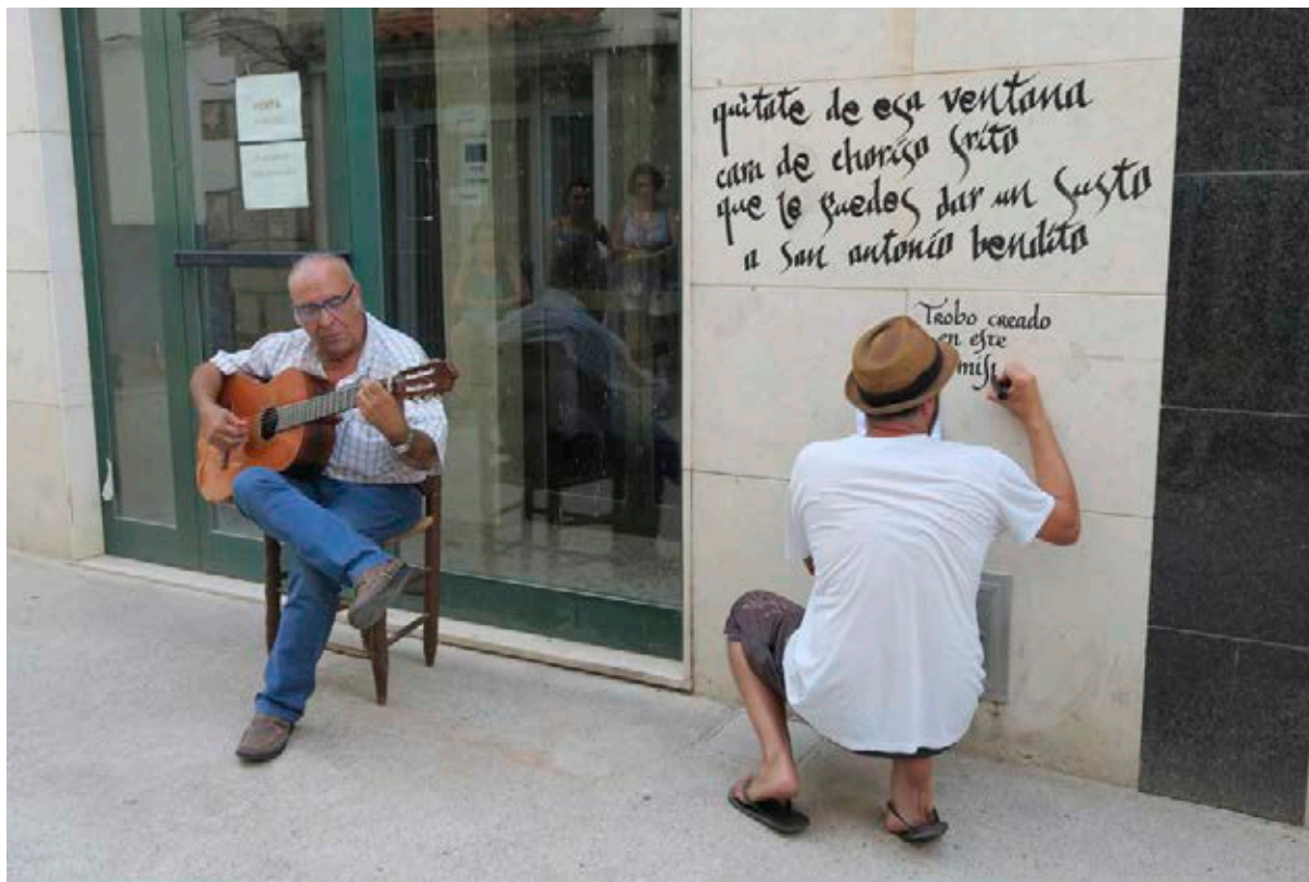
Hombrelópez reproduciendo frases de los vecinos, 2014.

pués, con el deseo de hacer comprender a los propios vecinos lo que había supuesto la celebración del primer MIAU, Marte organizó un ciclo de conferencias en Fanzara los primeros meses de 2015, con la participación de, entre otros, Bocangelus, Irene Gras o Belén García Pardo.