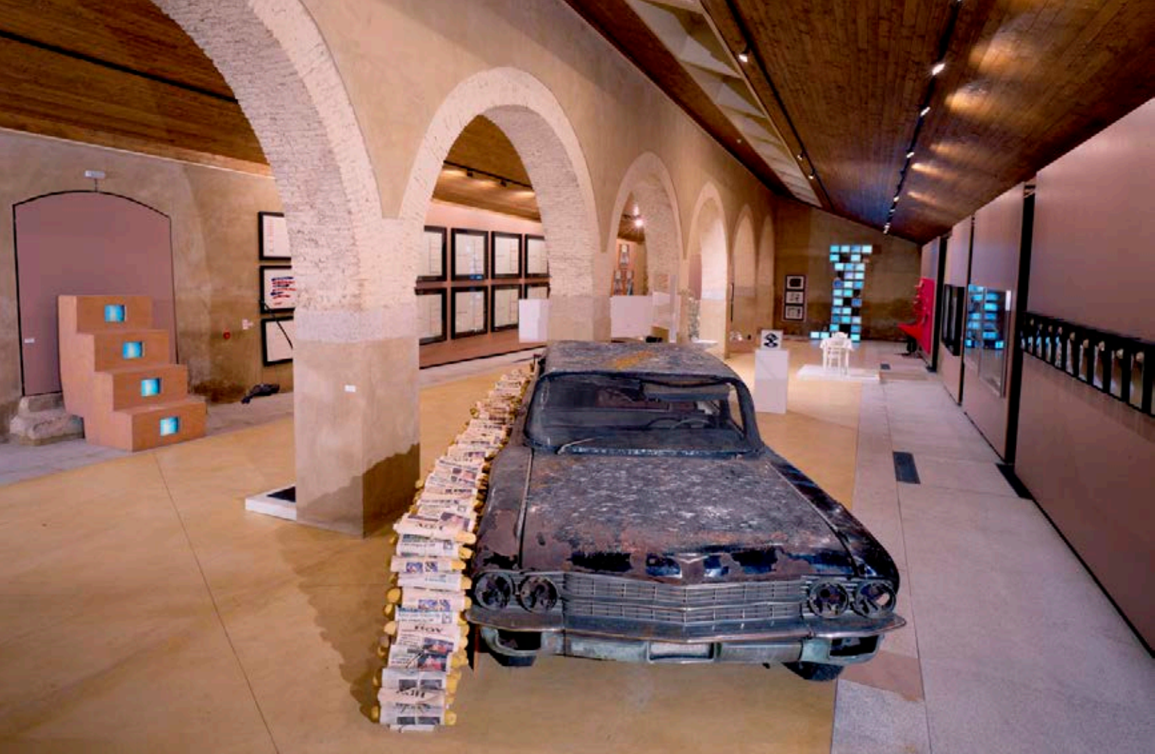
Colección Fluxus-Donación Gino Di Maggio.

de carácter etnográfico y tradición gastronómica, conferencias, presentaciones de libros y encuentros entre artistas con los vecinos.