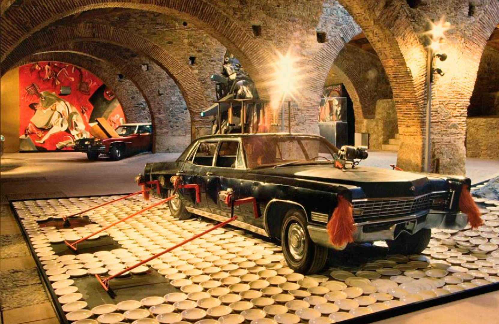
Colección Wolf y Mercedes Vostell. Sala de pesaje de la lana.