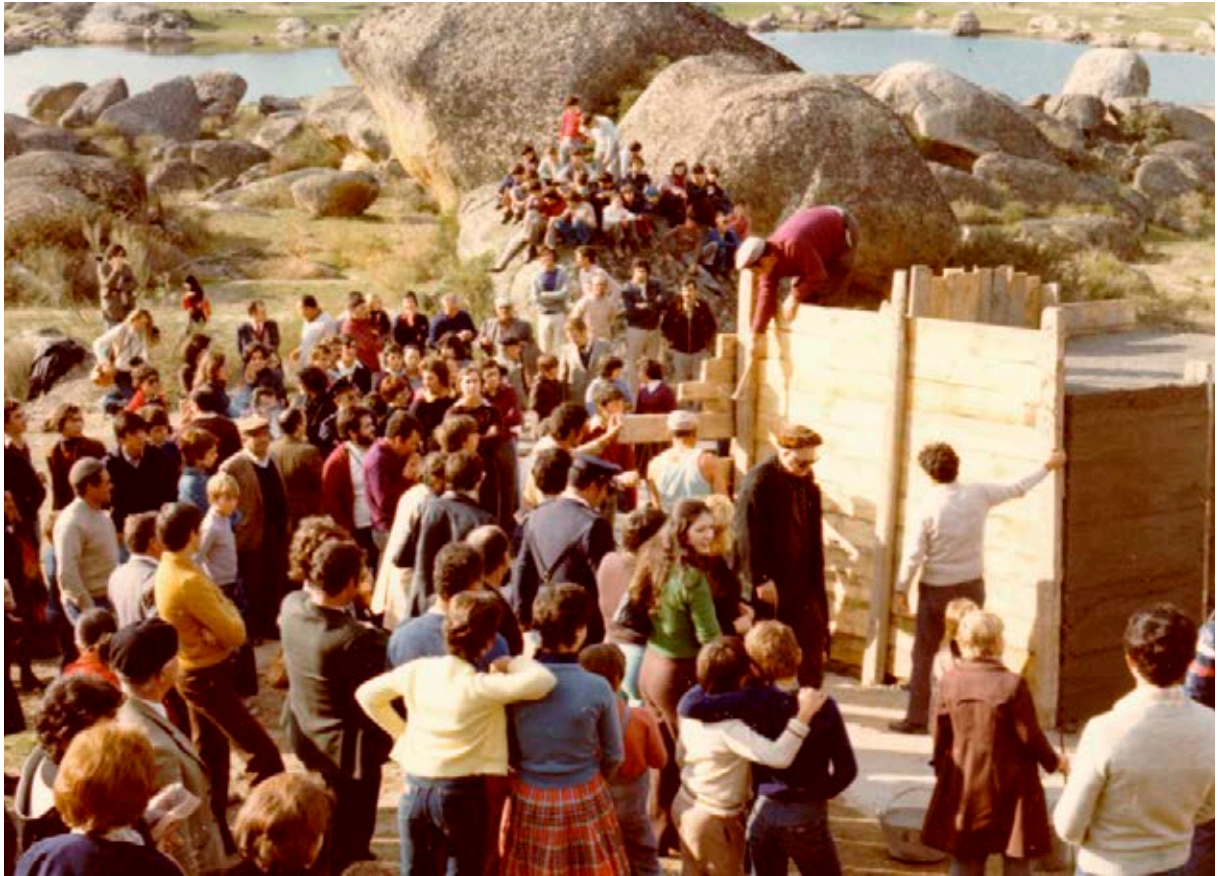
Desencofrado de V.O.A.EX. ( Viaje de (H)Ormigón por la Alta Extremadura ) el 30 de octubre de 1976.

El Museo Vostell Malpartida (MVM) cumplió cuarenta años de andadura el 30 de octubre de 2016. Y utilizo el término andadura en vez de la palabra existencia porque la idea de museo ya habitaba en la cabeza de Wolf Vostell desde, al menos, un par de años antes de aquella tarde de otoño de 1976, cuando tuvo lugar el desencofrado y presentación al público de la escultura V.O.A.EX. ( Viaje de (H)Ormigón por la Alta Extremadura ) 2 .