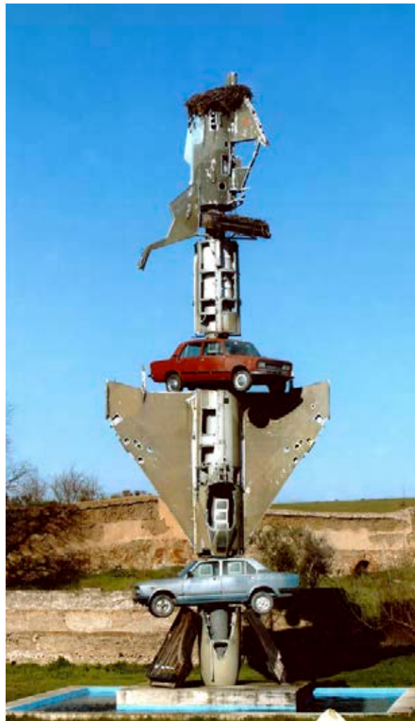
Wolf Vostell, ¿Porqué el proceso entre Pilatos y Jesús duró sólo dos minutos? , 1997.