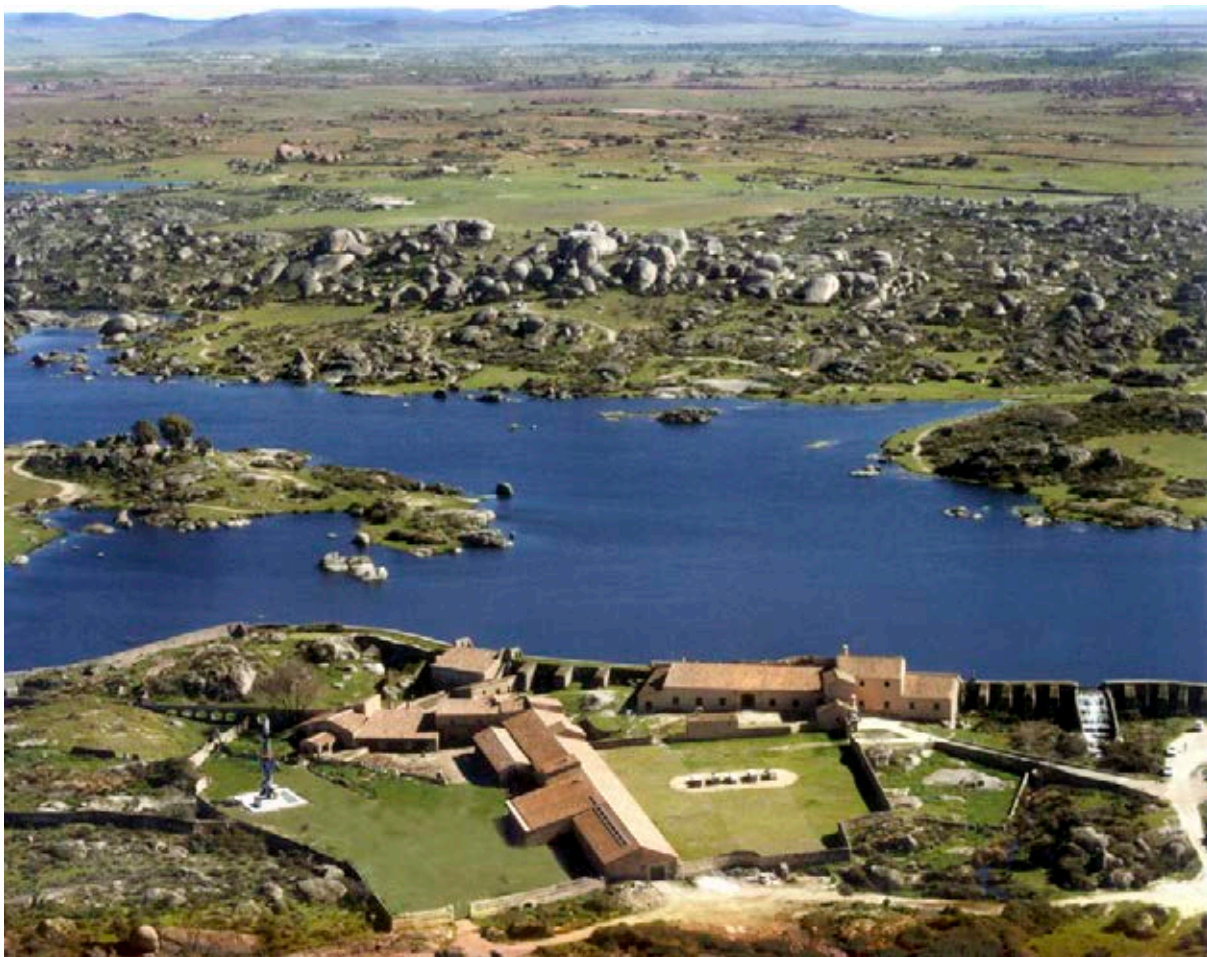
Vista aérea del Monumento Natural de Los Barruecos. En primer término, el Museo Vostell Malpartida.

La historia de su evolución, como punto de encuentro entre artistas y de éstos con el medio rural y la naturaleza en momentos de una presencia inexistente del arte contemporáneo internacional en Extremadura y en gran parte de España, ha sido contada al detalle por voces más experimentadas que la mía 3 que han conocido de primera mano los acontecimientos que, por fortuna, nos han traído hasta aquí. No obstante, resulta difícil trazar la sen-