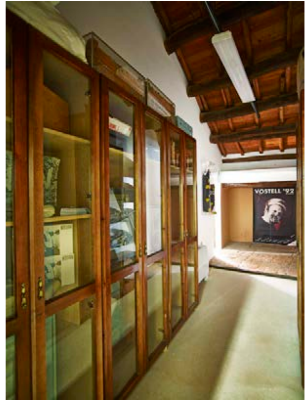
Una de las dependencias del Archivo Happening Vostell.

viene sucediendo durante los últimos cuarenta años en Los Barruecos.