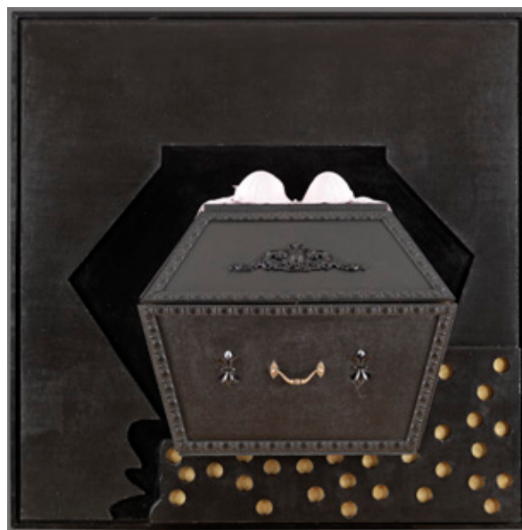
Ya no me hace falta o Estos fueron sus poderes tras la intervención (en la actualidad la prenda textil tiene otra disposición).

secuencia del señalado cambio. Tras finalizar el tratamiento de la parte principal, en la que las zonas mates, satinadas y brillantes desempeñaban un importante papel, se inicia una estrategia para recuperar el concepto primigenio planteando una serie de cuestiones en las que, conjuntamente con el artista, se baraja el mantenimiento o sustitución del sostén.