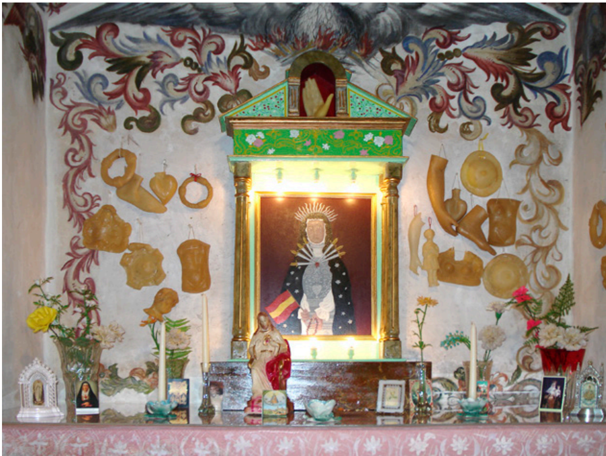
Fotografía tras la intervención del Altar de un pueblo español , de Alfredo Alcáin.

pictórica, el estucado, la reintegración y la aplicación de una capa de protección.