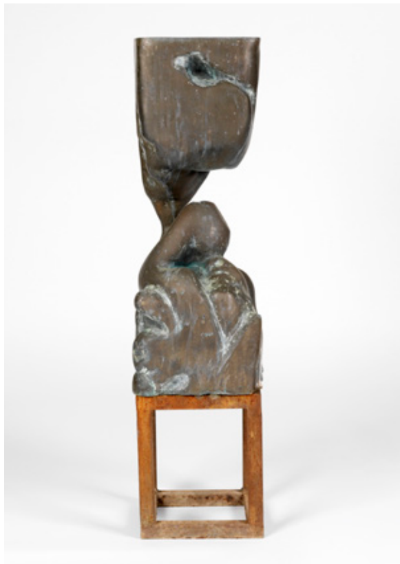
Foto antes de la restauración Opresión , Manuel Clemente.

De nuevo, presentamos una obra cuyo deterioro hubiera podido evitarse con la aplicación de medidas de conservación preventiva. Esto nos lleva a insistir de nuevo en la importancia de realizar una exhaustiva documentación paralela al ingreso de una obra en una colección.