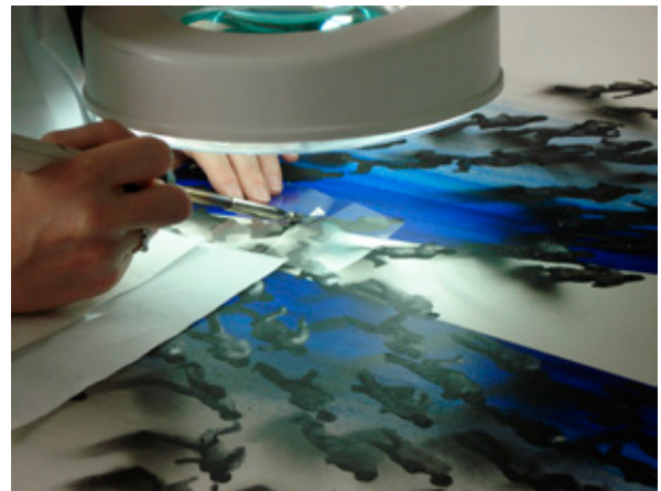
Detalle proceso adhesión película pictórica Secuencia 41 , Genovés.

Tras solicitar permiso al artista y a la Galería Marlborough, se inició el proceso de intervención. Un proceso, del cual, debemos destacar su complejidad técnica. Como en tantas obras contemporáneas, la limpieza y estabilización (consolidación y adhesión) constituyen tratamientos que son un verdadero problema a causa del peligro de alterar la obra y su concepto. Tras realizar diversas catas y