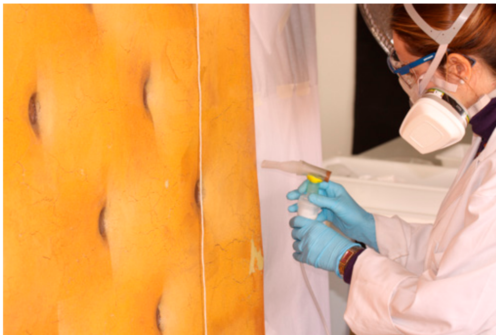
Proceso de consolidación espuma PUR La Galleta , Cillero.