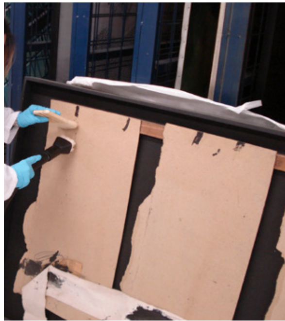
Extracción de polvo depositado en obra de Antoni Tàpies.

ESCOHOTADO IBOR, M a Teresa (1998) «La problemática de la obra de arte contemporáneo», La conservación y la restauración en el siglo xx . Madrid: Tecnos, pp. 199-205.