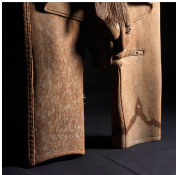
Detalle alteraciones del pantalón de Ropa tendida , Manolo Castañón.

En cuanto a la pérdida de color de las partes teñidas, se consensuó su reintegración con el artista, quien se mostró en todo momento muy receptivo y colaborador con el equipo, depositó su confianza en él.