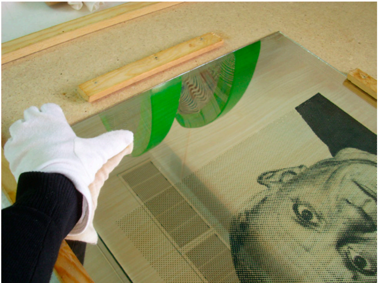
Jardín homenaje a Picasso, Eduardo Sanz.

La obra, realizada en vidrio, espejo de plata con diversos acabados, madera postformada y esmalte, está formada por cuatro elementos. En la pieza central (centro de la composición), asoma la cabeza de Picasso, el cual es homenajeado. La parte inferior corresponde a una barandilla y las laterales a dos árboles sobre peanas pintadas de blanco. Los espejos, colores y formas geométricas están en función del paisaje, en que el espectador entra a formar parte.