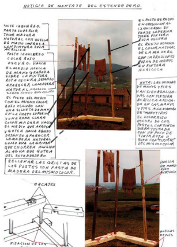
Instrucciones para el montaje de la obra Ropa tendida , Manolo Castañón.