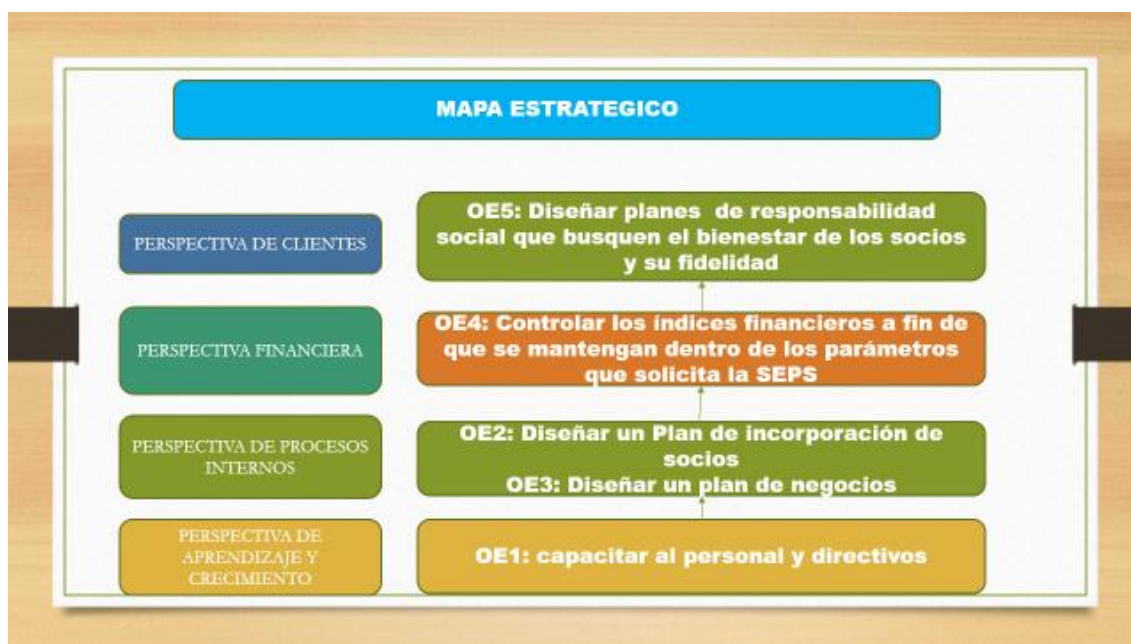
Grafico 3 Mapa Estrategico COAC EMAP-Q