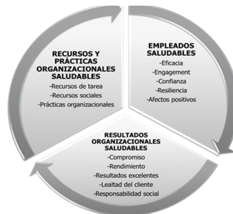
Figura 1: Modelo HERO

programas de salud psicosocial y comunicación e información organizacional) y el corazón del engagement de los equipos; (2) Torrente, Salanova, Llorens, y Schaufeli (2012) evidenciaron que el engagement de los equipos media de forma total la relación entre los recursos del equipo (i.e., trabajo en equipo, clima de apoyo y coordinación) y el desempeño evaluado por el supervisor directo (3) Cruz-Ortiz, Salanova, y Martínez (2013) evidenciaron que el engagement de los equipos media de forma total la relación entre liderazgo transformacional y desempeño del equipo evaluado por el supervisor directo; (4) Meneghel, Salanova, y Martínez (2016) evidenciaron que la resiliencia de los equipos media la relación entre las emociones positivas del equipo y el desempeño evaluado por el supervisor directo; (5) Olveira, Llorens, Acosta, y Salanova (2017) evidenciaron que la confianza horizontal media la relación entre liderazgo transformacional y desempeño del equipo en contexto sanitario.