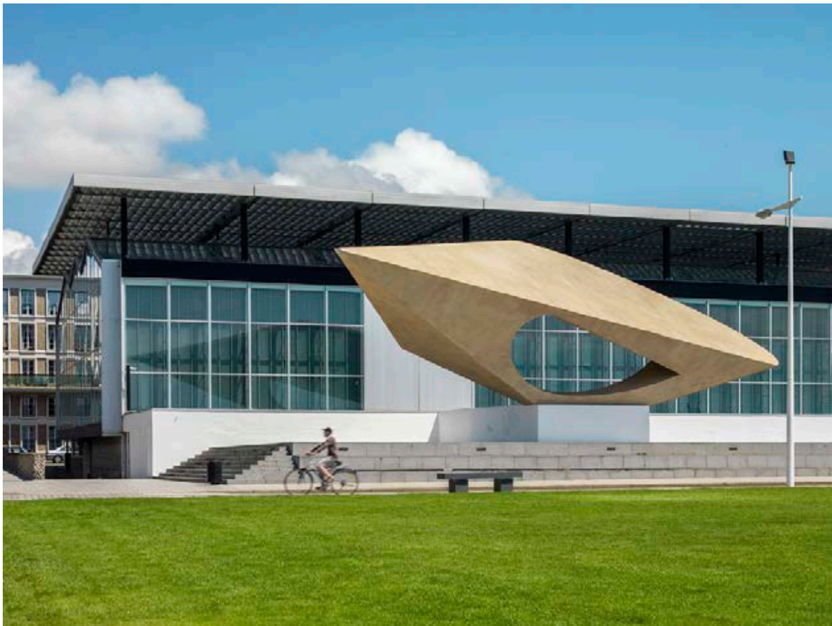
MuMa y la Signal

alrededores de esta ciudad normanda y que hoy forman parte del discurso de la exposición permanente. Además citar a Dufy, Pissarro, Monet, Renoir, Sisley, Bonnard, Courbet, Dubuffet, entre otros, que convierten esta colección en un referente del siglo XIX y XX, principalmente tras la incorporación de fotografía contemporánea. Con respecto a los donantes, destacan numerosos nombres de coleccionistas 11 de la localidad