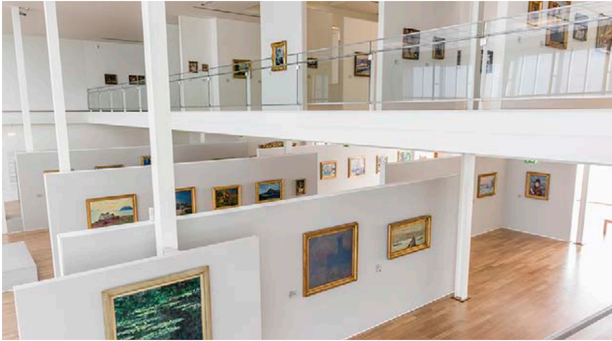
Vista general del interior del MuMa