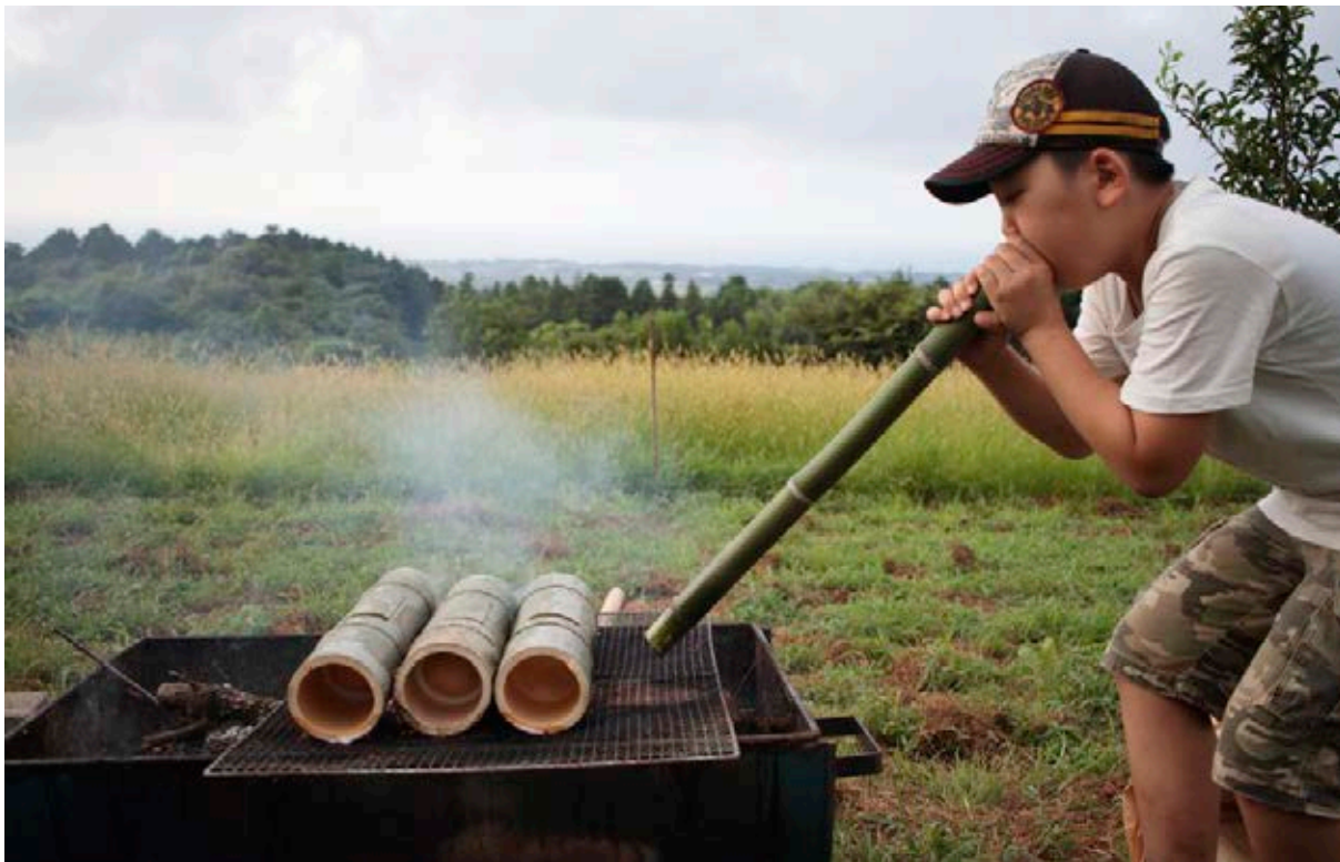
Actividades de GaGaGaGakkō

Hasta aquí, podríamos estar hablando de un centro cívico, que desde luego podría resultar fundamental como lugar de activación social de este entorno, pero no tenemos por qué comprender como museo. Para empezar, podríamos preguntarnos cuál es su patrimonio y su colección. Y podríamos respondernos que lo primero que se ha mantenido y que se preserva gracias a Mabuya es un bello ejemplo de arquitectura tradicional histórica, que corría el riesgo de desaparecer. Pero no solo el edificio estaba en riesgo de desaparición; también lo estaba el conocimiento sobre el tratamiento de los materiales y las técnicas de construcción tradicionales, que gracias a este proyecto se han actualizado y transmitido, con cariño y respeto, a nuevas generaciones.