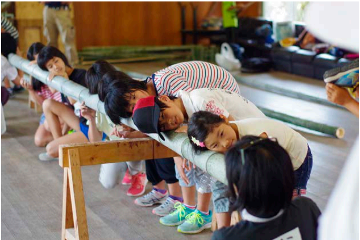
Actividades de GaGaGaGakkō

relaciones comunitarias? Y al mismo tiempo, ¿acaso no deseamos quienes trabajamos en este campo que los museos sean un espacio de florecimiento personal e intelectual? ¿No consideramos que estos espacios, estos objetos y sobre todo, los discursos que se construyen en torno a ellos tienen un enorme potencial de crear identidad y relaciones comunales?