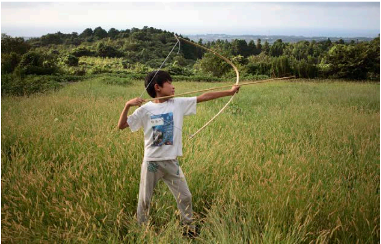
Actividades de GaGaGaGakkō

sí, que hacen de esta residencia un proyecto diferente. La primera consiste en el objetivo de conservar, mostrar y transmitir las prácticas y conocimientos tradicionales de la localidad; la segunda, la forma en que se reafirman las relaciones sociales construidas a partir de estos conocimientos, que pasan ellas mismas a constituir una nueva forma de patrimonio inmaterial.