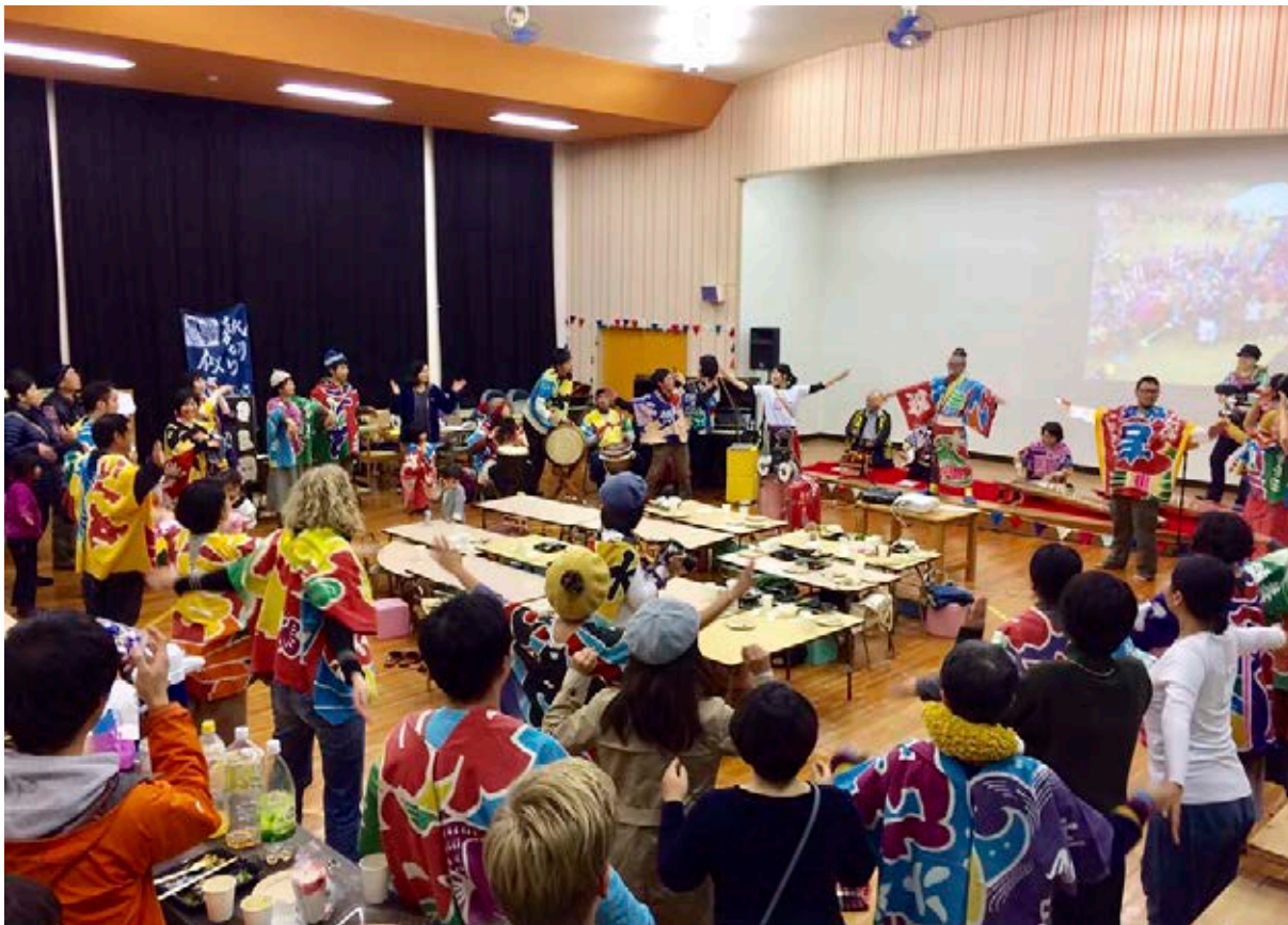
Aprendiendo el Daisen Ondó

ricos , Editorial Ariel: Quito, p. 387, citado en Gobierno de Ecuador, 2009: 6).