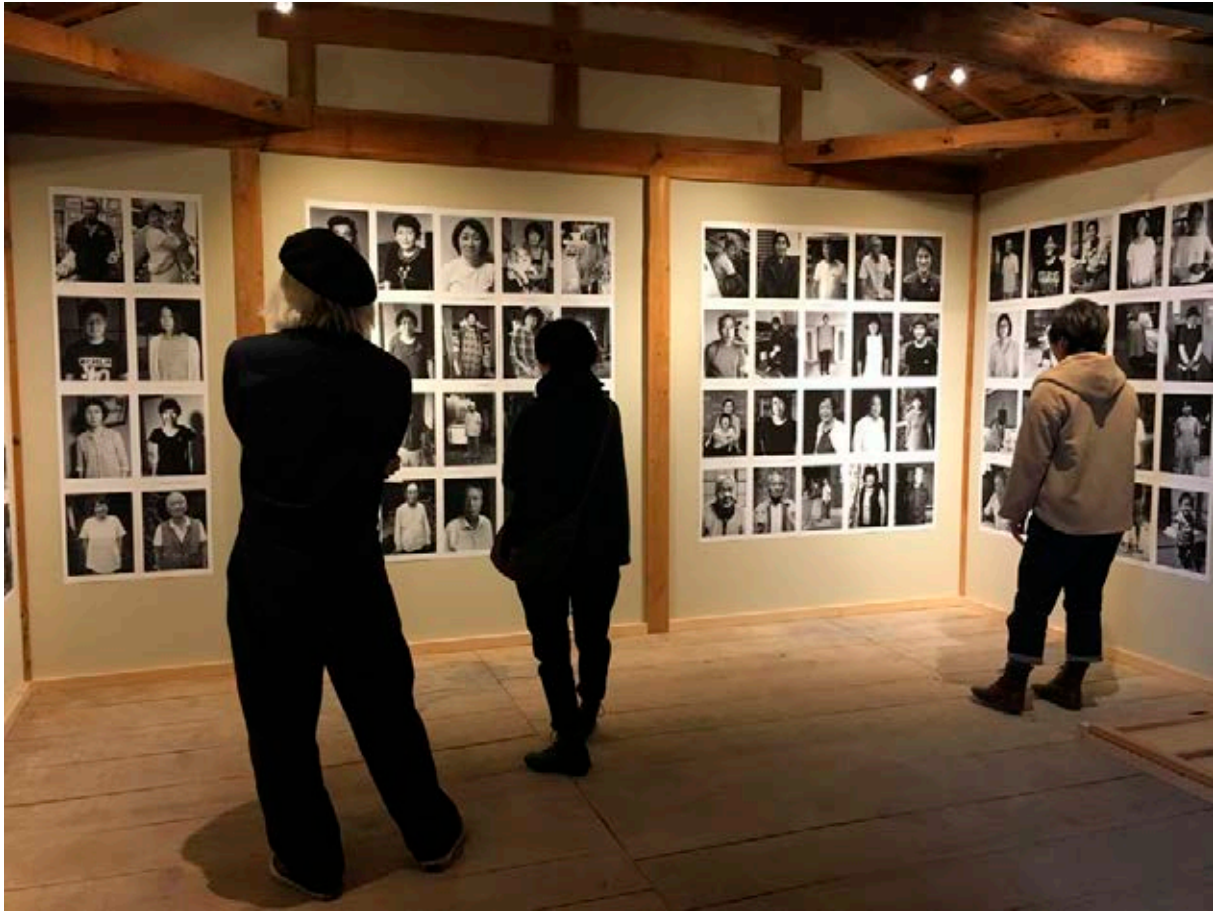
Exposiciones y conciertos en el Itonami Daisen Festival en Nagata, 2018