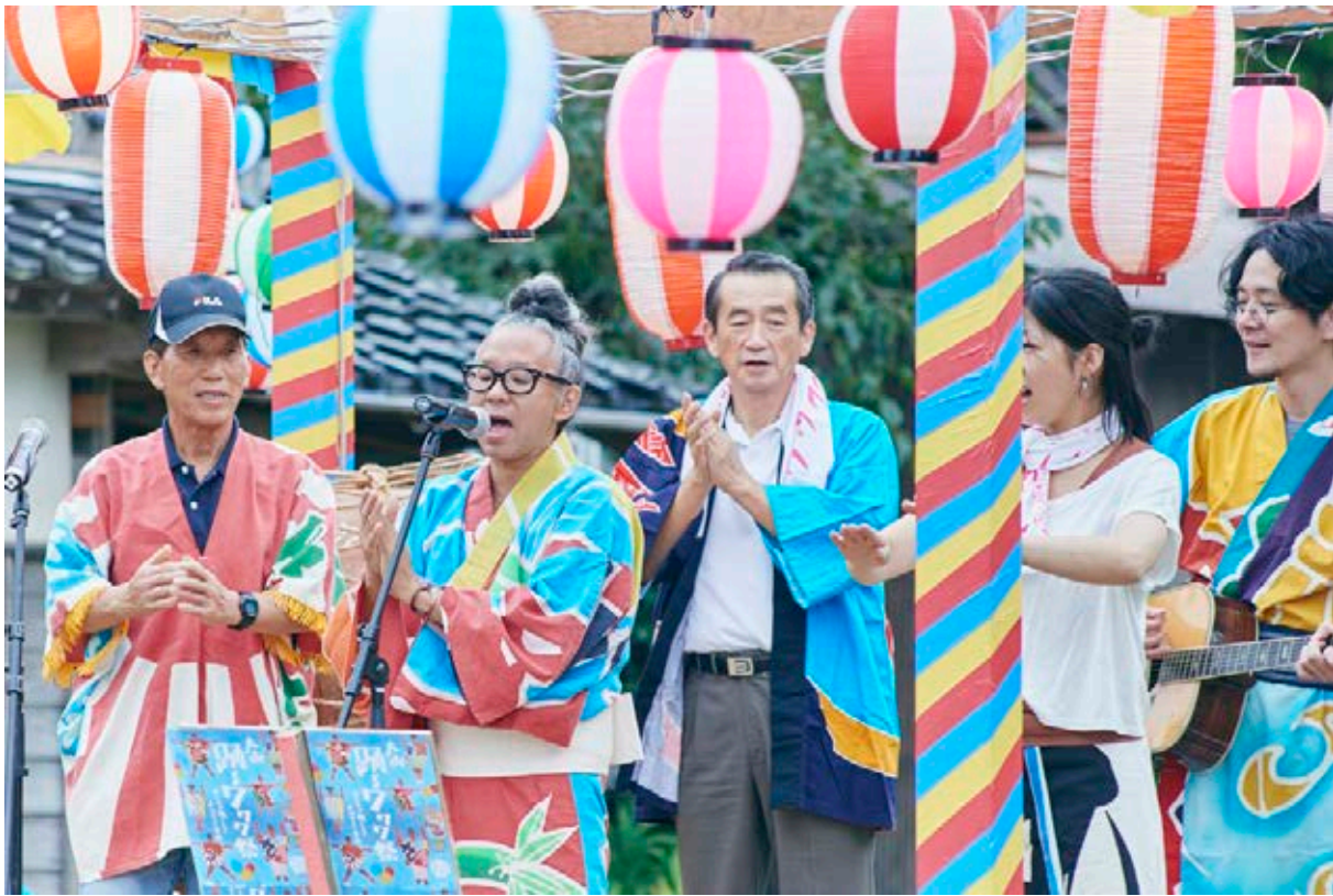
Daisen Ondō en el festival Wawawa

Nos encontramos, por lo tanto, ante un planteamiento muy unido al ecosistema, la historia y las tradiciones del valle, y con una importante vertiente creativa. Ofrece una actualización de conocimientos antiguos y no reglados, los hace convivir con otro tipo de saberes más sistematizados. A través de estas experiencias, se ponen en valor los diferentes saberes del lugar y se refuerza la idea de que constituyen un bien común y compartido, que no debe perderse, sino que debe cuidarse para poder transmitirlo a las próximas generaciones, y que incluso puede actualizarse. Junto con esta transmisión crítica, se refuerza el sentido de empoderamiento de varias personas mayores a las que, mediante la impartición de cursos, se hace sentir que sus conocimientos son válidos y necesarios, y que con ellos contribuyen a una vida mejor para toda la comunidad.