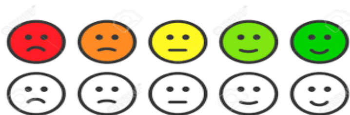
Figura 1: Grado de satisfacción por utilización de la aplicación

Por otra parte, tanto la web y la aplicación estarán a disposición tanto de las personas amenazadas, como de los/as testigos de la amenaza. Con ello se pretende crear una herramienta colaborativa y participativa, que facilite la construcción de un mapa de espacios seguros, identificados con un punto verde a los que la mujer puede dirigirse. Así como también, la identificación en el mapa de la ubicación mediante un punto rojo de la situación de acoso sexual callejero. Situando la propuesta en la misma línea de otras experiencias llevadas a cabo en España.