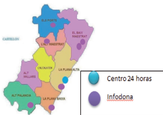
Figura 1. Localización según tipo de centro.