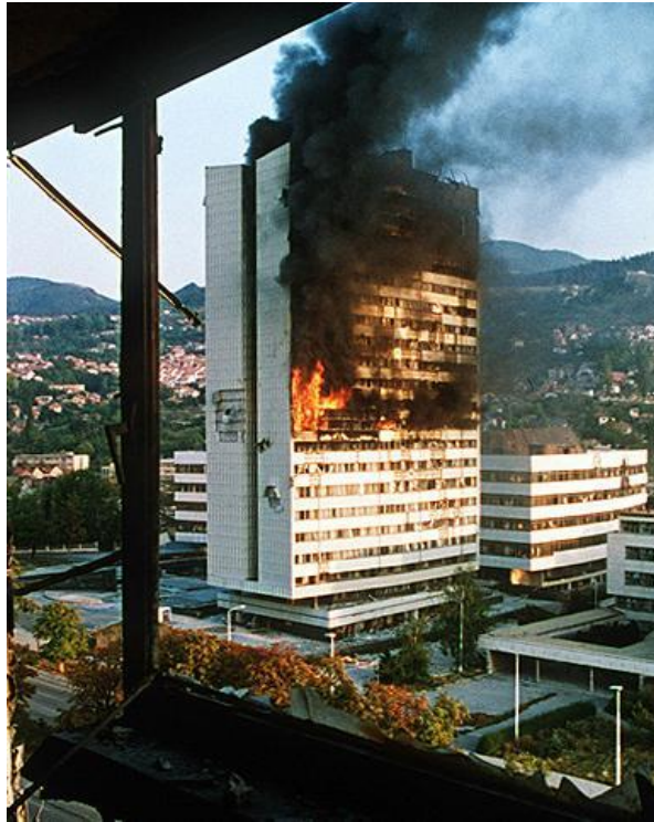
Figura 5. Incendio del Parlamento de Sarajevo por las fuerzas militares serbobosnias durante el Sitio de Sarajevo (1992-1995).