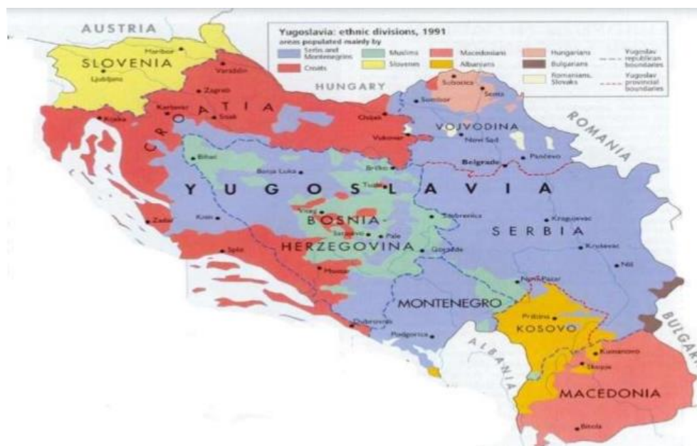
Figura 3. Mapa Étnico de Yugoslavia (1991). Se pueden distinguir la distribución de las diferentes etnias en Yugoslavia. Fuente: Crisis y conflictos en el siglo XX. Yugoslavia: Desde la idea nacional hasta la Guerra de Croacia. Marcos Ferreira (2015)