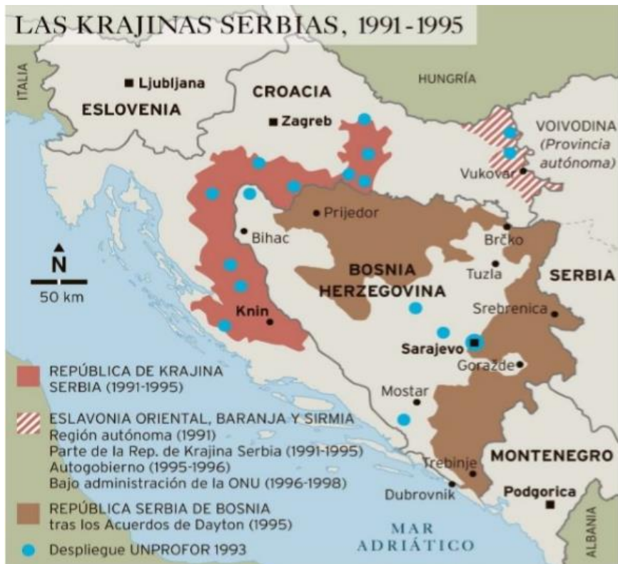
Figura 6. Mapa de las entidades serbias en las repúblicas de Croacia y Bosnia-Herzegovina, también las UNPA (zonas seguras) designadas por la ONU para ser protegidas.

Estas tres etnias preponderantes en territorio bosnio, convertidas en nacionalidades con posterioridad, dieron lugar a los tres bandos del conflicto en Bosnia. En primer lugar, los musulmanes que representados por Izetbegovic defenderían su integridad como nación y sus derechos cara al mundo, pero con un ejército gubernamental limitado, 150.000 hombres débilmente armados similar a las milicias se vieron sobrepasados enseguida por el ejército serbio que dominaba más de la mitad del país y sometía a sus ciudades a limpiezas étnicas y asedios para atemorizar al estado y así conseguir sus pretensiones sobre el territorio musulmán. En la zona oeste del país se encontraba la minoría bosnio-croata representada por Mate Boban que ya durante el transcurso de la guerra de Bosnia proclama su independencia del gobierno central, creando la República Croata de Herzeg-Bosna, apoyada lógicamente por Croacia y que contaba con 30.000 soldados en su milicia que luchaban en la Herzegovina atacando las ciudades bosniacas como Mostar, con la ayuda del ejército oficial croata apostado en Bihac. Finalmente aceptarían un acuerdo y se unirían con los musulmanes contra los desmanes de los serbios.