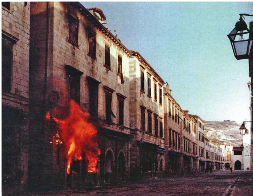
Figura 4. Fotografía de Dubrovnik durante el asedio de las fuerzas serbias que duró más de 3 años.

San Ruperto, 2009:108). Vukovar fue el conflicto más cruento durante la etapa de la guerra en Croacia, que desde junio de 1991 estaba sometida a bombardeos diarios y que persistieron durante todo el verano y destruyeron la ciudad. El hecho más destacable durante los enfrentamientos fue la Masacre de Ovčara, donde se llevó a cabo el asesinato masivo de prisioneros de guerra y civiles croatas por las fuerzas militares serbias de Zeljiko Raznatovic 20 con permiso del JNA. Este momento de la historia reciente ocurrió al final de la Batalla de Vukovar, después de meses de conflicto, se negoció entre los ejércitos de ambos bandos y los organismos de ayuda humanitaria, la evacuación del hospital de la ciudad. Los soldados serbios, se llevaron a un gran número de personas de nacionalidad croata salvo algunas excepciones hasta la granja de Ovčara (pedanía de la ciudad de Vukovar) donde fueron masacrados y ejecutados por los soldados serbocroatas y el grupo paramilitar serbio comandado por Arkan. El presidente Franjo Tuđman hizo un llamamiento a toda la población para defenderse del nacionalismo serbio y sus ataques, poco después él fue testigo de un atentado en Zagreb de origen desconocido que podría haber acabado con su vida. Finalmente, los partidos democráticos del parlamento croata acordaron unirse para confrontar al ejército federal y al grupo de paramilitares serbios y condenar todas sus atrocidades.