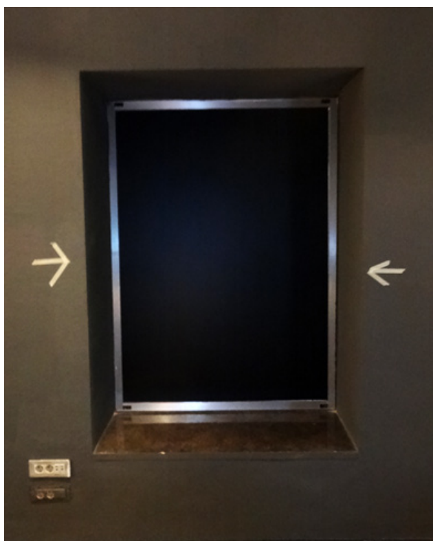
Figura 6. Intervención en el espacio: Espacio de refugio.

En el primer taller abordamos el espacio desde la noción del refugio , de nuestra necesidad natural de sentirnos seguros y guarecernos, explorando el espacio con una mirada íntima y primigenia. La metáfora habitual de la concha o el caparazón era un punto de partida, pero desde el enfoque más amplio que nos permite la ecología simbólica, ampliamos el análisis a los aspectos personales que definen nuestros hogares, esos rasgos y valores esenciales de la propia personalidad que favorecen que nos sintamos seguros en nuestro espacio, bajando nuestro nivel de alerta (Rochberg-Halton y Csikszentmihalyi, 1981). Esto es extrapolable a cualquier espacio que hemos dispuesto para reflejarnos, donde podemos olvidarnos del mundo exterior y centrarnos completamente en nuestro yo más íntimo y en nuestro trabajo. Lo que conecta con la necesidad infantil de buscar un espacio de refugio donde nos sintamos seguros, descansar del agotador reto de la convivencia, dándonos un tiempo de introspección, para posteriormente reintegrarse nuevamente con el resto de la sociedad. Ésta necesidad de conexión con uno mismo y la sensación de tranquilidad que conlleva se plantearon como motores creativos del primer taller, para a partir de las propias vivencias generadas en las diferentes actividades y dinámicas, relacionar el concepto de refugio con la necesidad de los alumnos por encontrar estos espacios de paz en las escuelas.