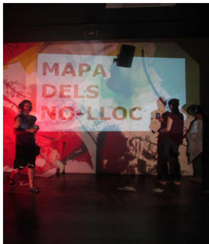
Figura 10. Mapa de los no lugares.

El lugar y el no lugar son más bien polaridades falsas: el primero no queda nunca completamente borrado y el segundo no se cumple nunca totalmente: son palimpsestos donde reinscribe sin cesar el juego intrincado de la identidad y de la relación.