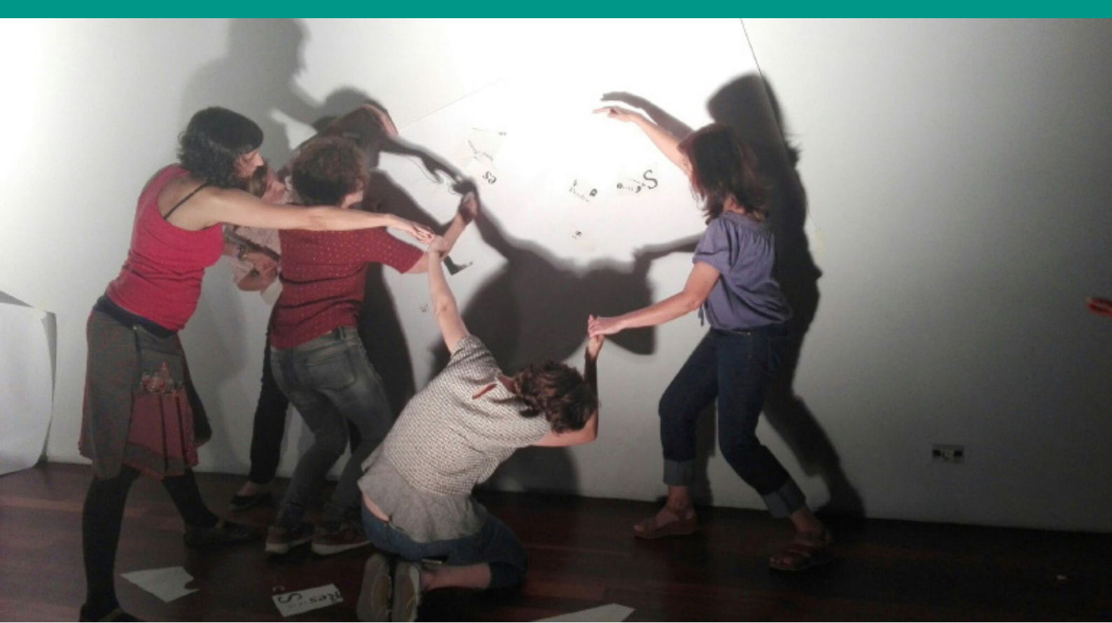
Figura 9. Acción cooperativa de dibujo corporal.