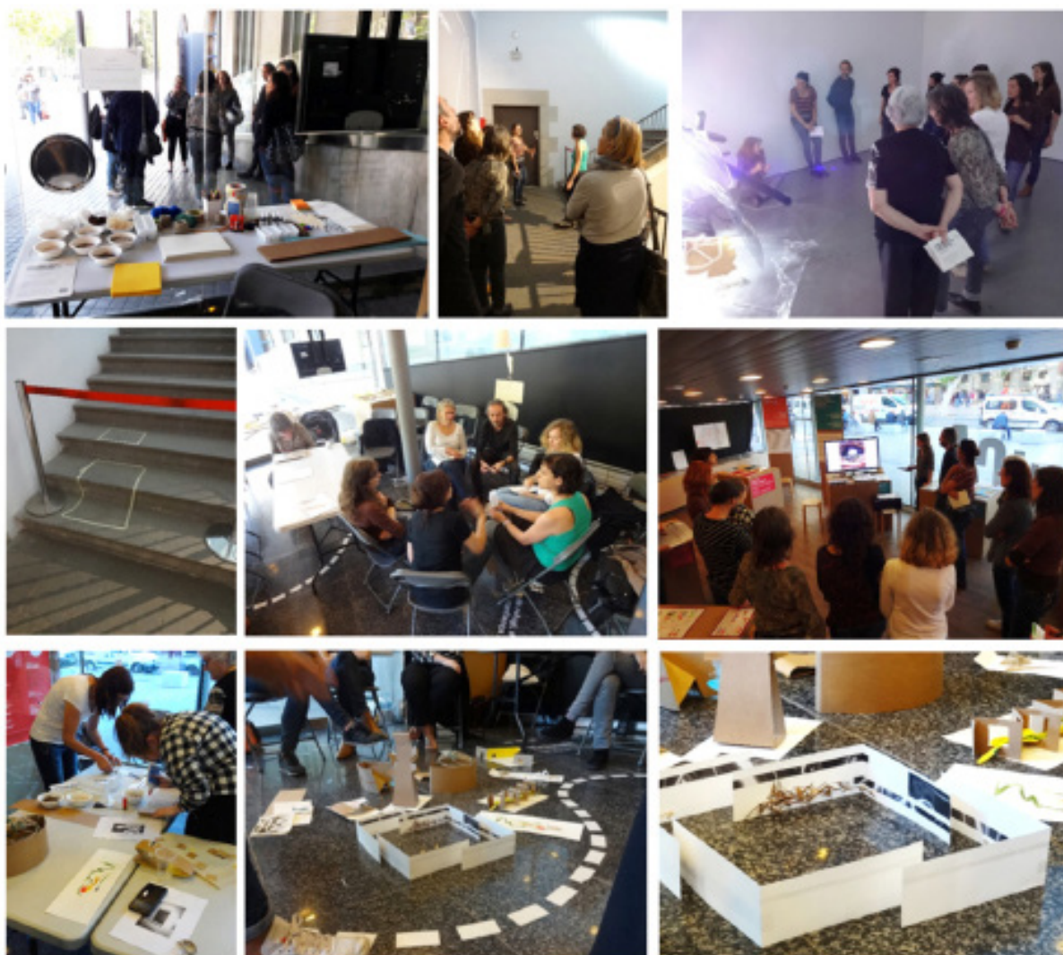
Figura 5. Recopilación de momentos vividos en una secuencia didáctica.