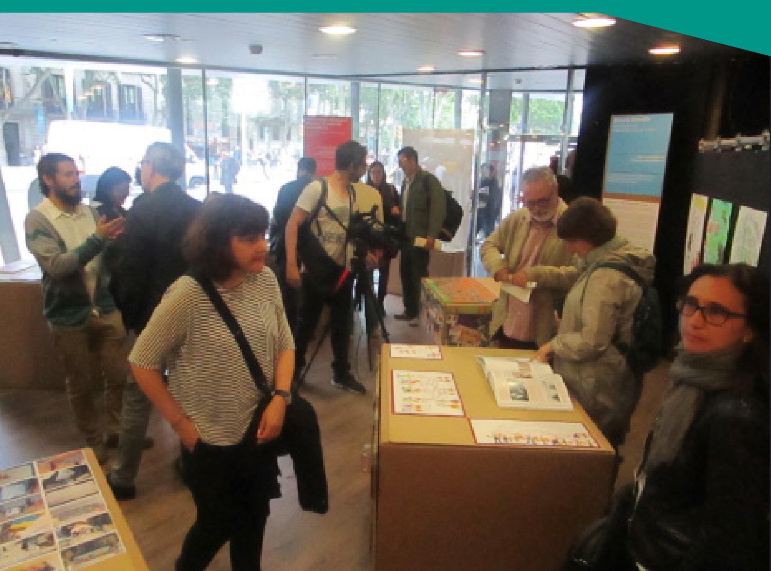
Figura 1. Muestra expositiva La educación de las artes II.

El lugar de las artes: escuela, transversalidad y redes.