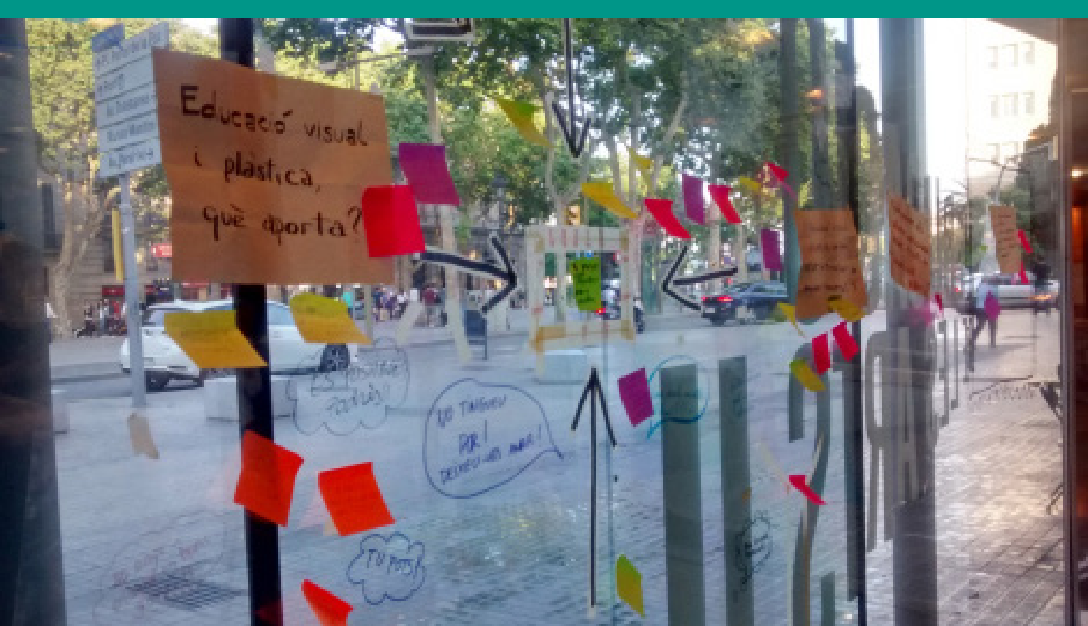
Figura 11. Ordenando ideas mediante Visual thinking.