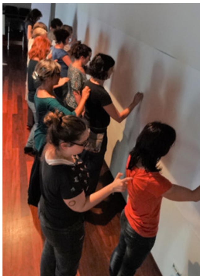
Figura 7. Dibujo transferido.

Por último, con la referencia de los collages fotográficos de David Hockney, los participantes deben utilizar el material generado durante el taller para crear un mural en equipo, que trate sobre el concepto de tránsito para realizar una acción creativa que permita plasmar lo experimentado durante la sesión.