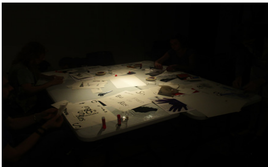
Figura 8. Trabajando en los poemas experimentales.

Con los términos empleados en la reflexión sobre el concepto de no lugar como material creativo, proponemos a los participantes que experimenten individualmente rompiendo los códigos establecidos creando un poema experimental, que emplee las letras como grafismos y no como un elemento constructor de significado a partir de unas reglas estipuladas Fig.8.