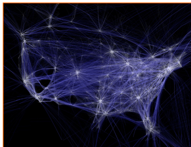
Imagen 1. Flight Patterns , Aaron Koblin, 2009

Otro popular entorno de desarrollo de representaciones gráficas de datos es Processing. Iniciado por Ben Fry y Casey Reas en el 2001, también distribuido gratuitamente y de código abierto, basado en Java, goza de gran popularidad entre la comunidad artística, gracias a que fue diseñado por y para artistas. Flight Patterns , de Aaron Koblin, es un ejemplo de visualización de datos realizada con Processing, que nos muestra la saturación del espacio aéreo en Estados Unidos, al representar gráficamente la información de 24 horas de vuelos sobre el país. Esta obra establece un paralelismo con las redes neuronales, donde determinadas interconexiones son más activas que otras y donde podemos también encontrar áreas de baja o ninguna actividad. Flight Patterns (Koblin 2009) no solo nos permite visualizar de manera objetiva y directa la desmesurada cantidad de vuelos que diariamente sobrevuelan Estados Unidos, sino que además nos invita a reflexionar sobre su sentido y necesidad y los efectos que estos producen a escala económica, social y ecológica.