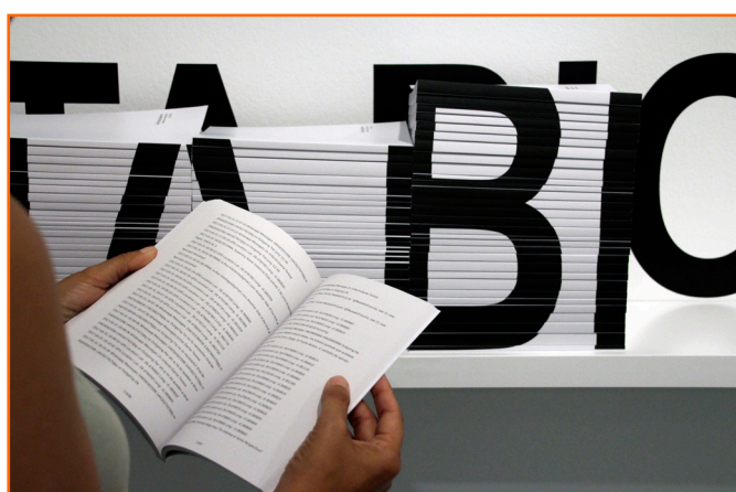
Imagen 5. Data Biography (detalle), Clara Boj y Diego Díaz, 2017

Si realizamos un primer análisis cuantitativo de nuestra actividad a partir de los datos recopilados, podemos visualizar determinadas métricas de nuestra actividad digital, como el número de registros por horas, día y mes, por categoría, etc., que nos muestran los momentos de máxima y mínima actividad digital. Esta información es valiosa, pero ciertamente limitada, pues no nos acerca a una aproximación más rica y pluridimensional de nuestras acciones.