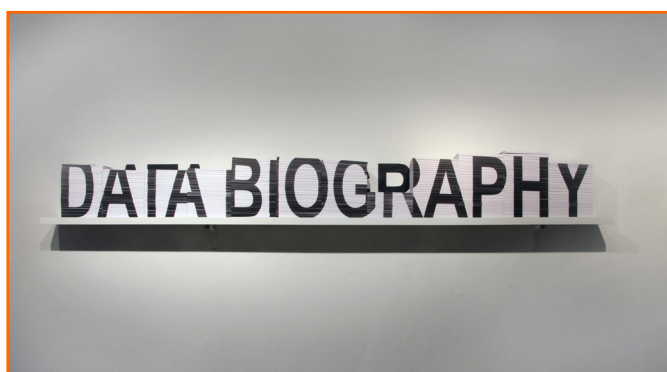
Imagen 4. Data Biography , Clara Boj y Diego Díaz, 2017

una acción realizada, donde se muestran el registro temporal y los distintos datos de la misma: el tipo de acción (localización GPS, email, WhatsApp, Facebook, Skype, etc) y su contenido. Los vídeos y las fotografías son mostrados en formato imagen, lo que genera un listado de información que permite al visitante acceder a la lectura de todas las acciones realizadas por nosotros durante el año 2017, resaltando que esta información está accesible, al alimentar el inmenso espacio digital del big data .