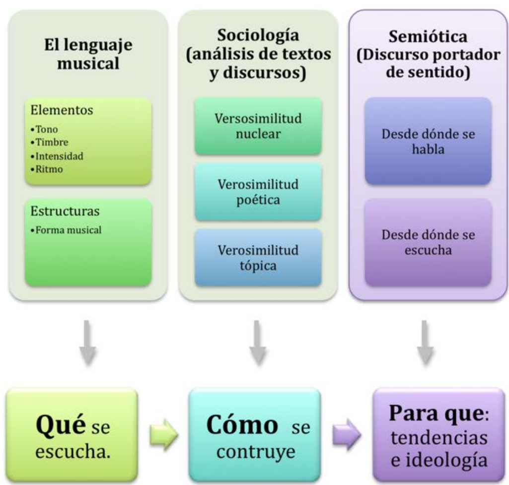
Figura 1. Qué, cómo y para qué la música cotidiana

dorff, 1990; Ibáñez, 1968) y el semiótico (Ballón y Campodónico, 1990; Talens, 1996) (Figuras 1 y 2).