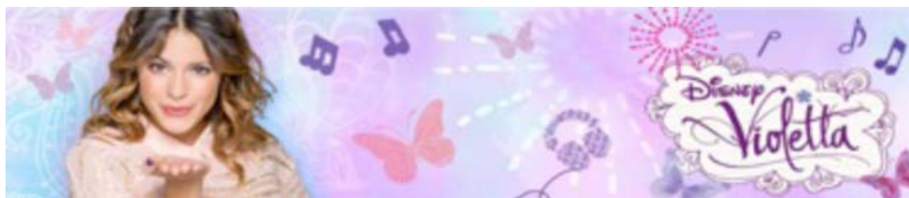
Figura 3. Imagen de la serie