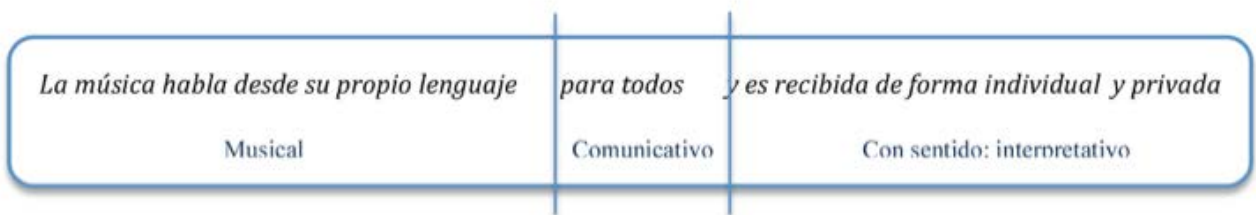
Figura 2. La música habla desde su propio lenguaje para todos y es recibida de forma individual y privada.